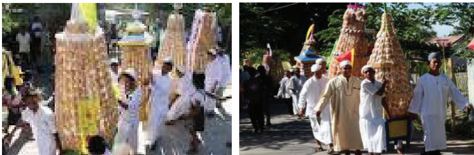
Gambar 1. Prosesi dikili (perayaan maulid Nabi)

Usai prosesi dikili , masyarakat di sekitar masjid yang merayakan maulid berkumpul di halaman masjid untuk berbagi bahkan berebutan kue yang diisi dalam sebuah tolangga. Tolangga adalah sebuah wadah besar yang dihiasi dengan berbagai macam jenis kue dan makanan seperti nasi putih, nasi kuning, nasi bilindi, telur, dan lain-lain. Tolangga inipun ada yang khusus untuk dibagikan kepada masyarakat, ada pula yang khusus diberikan kepada para Imam, ulama, maupun pegawai syara', sebagai "imbalan" atas pengorbanan mereka melantunkan dikili selama semalam suntuk. Di sinilah bagian yang paling unik dalam prosesi peringatan Maulid Nabi di Gorontalo, menyaksikan indahny hasil kreativitas masyarakat dalam menghias tolangga-nya masing-masing. Apalagi menyaksikan hiruk-pikuknya pembagian (mungkin lebih tepat disebut perebutan) kue walimah (walimah berasal dari bahasa Arab, artinya perayaan. Sedangkan kue walimah di Gorontalo sering diartikan sebagai kue yang menghiasi tolangga), seperti yang diperlihatkan dalam gambar berikut ini.