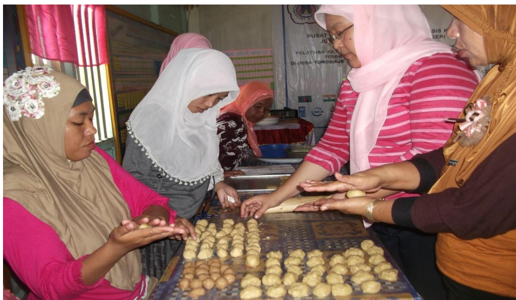
Gambar 2. Sebagian kegiatan pelatihan dan pendampingan kelompok perempuan dalam pembuatan produk pangan (kue pia) berbahan dasar buah mangrove

produk. Tim melakukan focus group discussion (FGD) dengan PKK dan Kelompok Sadar Lingkungan (KSL) di 3 desa yaitu; desa Torosiaje, Torosiaje Jaya dan desa Bumi Bahari. Diskusi ini untuk membentuk persepsi yang sama dalam mencapai tujuan kegiatan, serta pembentukan kelompok perempuan sebagai peserta pelatihan.