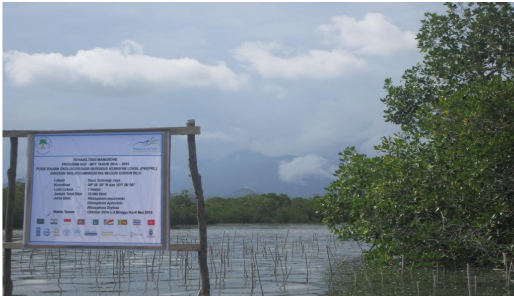
Gambar 3. Salah satu sisi lokasi rehabilitasi lahan mangrove 7 ha. di pesisir selatan Desa Torosiaje Jaya

dilakukan oleh masyarakat untuk memperoleh hasil pertumbuhan yang optimum bibit mangrove yang ditanam.