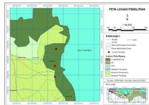
Gambar 1. Lokasi penelitian desa Langge, Kecamatan Anggrek, Kabupaten Gorontalo Utara

Area kajian di kawasan mangrove Desa Langge, Kecamatan Anggrek, Kabupaten Gorontalo Utara, Provinsi Gorontalo. Secara geografis wilayah penelitian terletak antara koordinat 00 o .48'. 28,809" N dan 122 o .50'. 24,836" E. Secara administrasi wilayah penelitian berbatasan dengan : Sebelah Utara berbatasan dengan Laut Sulawesi, Sebelah Timur berbatasan dengan Desa Tutuwoto, Sebelah Selatan berbatasan dengan Desa Tolongia, Sebelah Barat berbatasan dengan Desa Iloodulunga. Posisi geografis wilayah kajian disajikan pada peta (Gambar 1).