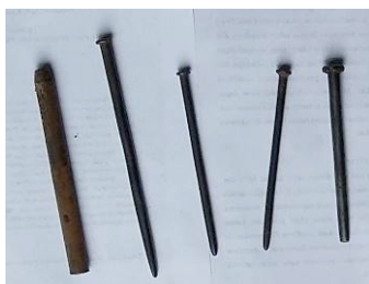
Gambar 8. Alat yang digunakan membentuk atribut

Alat tatah yang sudah jadi dapat ditemukan di toko-toko bangunan, namun umumnya para pengrajin home industri lebih memilih membuat sendiri alat tatah dari paku baja yang dibeli di toko bangunan. Keuntungan membuat sendiri alat tatah dari paku baja adalah dapat membuat bentuk sesuai keinginan, selain itu apabila sudah tumpul atau berubah bentuk maka dapat dibentuk kembali.