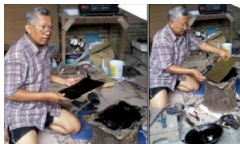
Gambar 5. Menyatukan plat kuningan dengan papan alas

Ketebalan adonan Jabung pada plat kuningan disesuaikan ukuran motif yang akan ditatah, semakin besar motif yang akan dibuat, semakin tebal lapisan yang diperlukan. Hal lain yang perlu diperhatikan adalah menuangkan adonan dengan merata karena jika ada bagian yang kosong, maka tidak akan memperoleh hasil sesuai motif yang diinginkan. Adonan Jabung juga dituangkan pada landasannya dengan tebal kurang lebih 2 cm. Plat kuningan dan papan alas yang sudah diberi adonan Jabung lalu dilengketkan dalam keadaan belum kering/dingin dan dibiarkan menyatu.