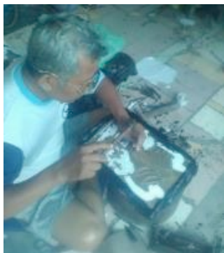
Gambar 6. Proses tatah sesuai dengan menggunakan pola

Alat tatah yang sudah jadi dapat ditemukan di toko-toko bangunan, namun umumnya para pengrajin home industri lebih memilih membuat sendiri alat tatah dari paku baja yang dibeli di toko bangunan. Keuntungan membuat sendiri alat tatah dari paku baja adalah dapat membuat bentuk sesuai keinginan, selain itu apabila sudah tumpul atau berubah bentuk maka dapat dibentuk kembali.