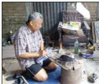
Gambar 8. Meratakan sisa Jabung pada papan alas

Sisa Jabung pada papan alas dapat digunakan kembali dengan cara meratakan. Serpihan-serpihan Jabung yang sudah digunakan, dapat dimasak kembali agar meleleh. Sebaiknya menghindari adanya serpihan-serpihan benda lain yang masuk karena dapat mempengaruhi saat menatah.