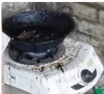
Gambar 3. Memasak adonan Jabung

Damarselo dan batu bata yang sudah dihaluskan kemudian dicampur menjadi satu dengan perbandingan 2 : 1 (2 kg damarselo + 2 kg bubuk batu-bata). Setelah tercampur rata, lalu ditambahkan minyak kelapa sedikit demi sedikit hingga adonan Jabung menyatu. Penggunaan minyak yang berlebihan hasilnya akan mudah mengikuti bentuk saat ditatah, sebaliknya jika kurang minyak maka adonan damarselo akan mudah patah karena efek yang keras.