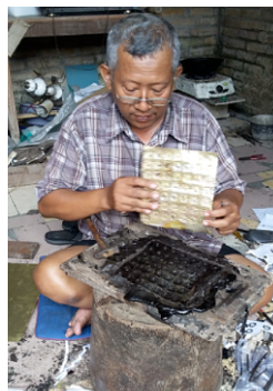
Gambar 7. Proses melepaskan atribut yang telah ditatah

Atribut busana yang sudah ditatah, kemudian dilepaskan dari Jabung, dengan menggunakan peralatan khusus. Melepaskah hasil tatahan dengan cara memahat Jabung yang berada di pinggaran kuningan. Jabung tersebut berfungsi untuk menyatukan plat kuningan dan papan alas serta melekatkan pola dari kertas