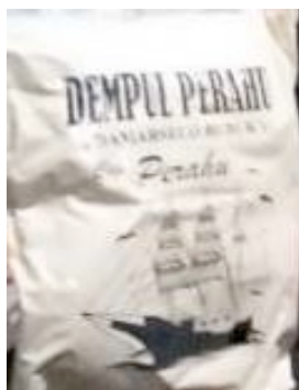
Gambar 2. Bubuk Damarselo

Damarselo dan batu bata yang sudah dihaluskan kemudian dicampur menjadi satu dengan perbandingan 2 : 1 (2 kg damarselo + 2 kg bubuk batu-bata). Setelah tercampur rata, lalu ditambahkan minyak kelapa sedikit demi sedikit hingga adonan Jabung menyatu. Penggunaan minyak yang berlebihan hasilnya akan mudah mengikuti bentuk saat ditatah, sebaliknya jika kurang minyak maka adonan damarselo akan mudah patah karena efek yang keras.