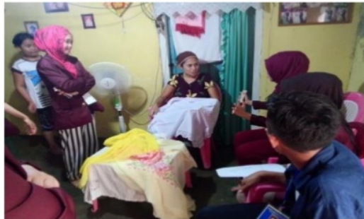
Gambar 1. Observasi produk Karawo

1 Karawo adalah kain tradisional khas Gorontalo yang pembuatannya merupakan hasil kerajinan tangan. Tak ada kain Karawo yang bukan hasil kerajinan tangan. Karawo merupakan bahasa Gorontalo yang artinya Sulaman tangan. Orang-orang diluar Gorontalo mengenalnya dengan sebutan Karawo. Karawo lahir dari proses panjang yang merupakan buah dari ketekunan para perajin. Seni membuat Karawo atau Karawo disebut "MoKarawo". Seni ini telah diturunkan dari generasi ke generasi sejak masa kerajaan Gorontalo masih berjaya. Keindahan motif, keunikan cara pengerjaan dan kualitas yang bagus membuat Karawo bernilai ekonomi sangat tinggi. Maka tak mengherankan jika keunikan dan kualitas tersebut diminati oleh banyak kalangan baik dari dalam maupun luar negeri.