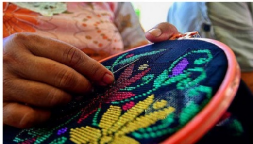
Gambar 2. Salah satu Proses Karawo

4 Produksi kain Karawo atau Karawo sempat mati suri. Tidak banyak perajin yang menekuni dunia ini karena kerumitan yang menyita banyak energi, waktu dan ketekunan. Oleh karena itu, pemerintah melakukan berbagai cara untuk membuat kerajinan ini dapat terus lestari dan semakin populer baik di dalam maupun di luar negeri. Salah satu cara yang dilakukan pemerintah adalah mengadakan festival Karawo yang telah digelar sejak pertama kalinya tanggal 17-18 Desember 2011. Festival yang akan terus digelar setahun sekali ini bertujuan untuk menarik minat masyarakat dalam mengenakan hasil industri produk Karawo sekaligus menguatkan ekonomi melalui pengembangan budaya daerah.