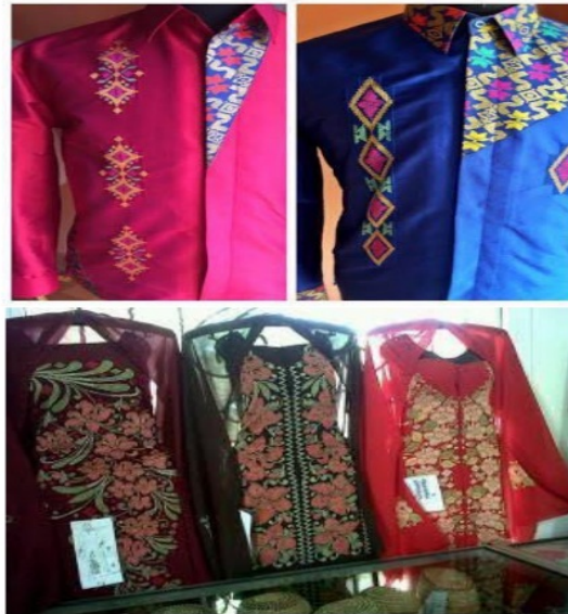
Gambar 3. Produk Karawo untuk Busana Pria dan Wanita

7 Industri adalah kegiatan ekonomi yang mengolah bahan mentah, bahan baku, barang setengah jadi atau barang jadi menjadi barang dengan nilai yang lebih tinggi lagi penggunaannya, termasuk kegiatan rancang bangun industri dan perikayasaan industri (Kartasapoetra, 2000). Industri kerajinan tangan sulaman kain Karawo merupakan salah satu produk original hasil karya masyarakat Gorontalo, yang selama ini menjadi khas dan populer berasal dari Gorontalo. Kerajinan ini telah dilakukan secara turun temurun di masyarakat Gorontalo yang banyak diminati bukan saja di wilayah Gorontalo tetapi juga diluar Gorontalo.