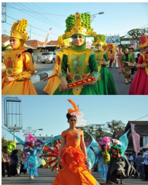
Gambar 4. Festival Karawo Gorontalo

5 Sinergi Pemerintah dan Perguruan Tinggi serta masyarakat sangat diperlukan dalam upaya Pemberdayaan untuk meningkatkan kesejahteraan (Sulila, 2016). Produk kerajinan Karawo terdapat di berbagai tempat di Gorontalo, salah satunya di desa Bongo Kecamatan Batudaa Pantai Kabupaten Gorontalo Provinsi Gorontalo. Dari beberapa usaha kecil sulaman Karawo di wilayah ini terdapat dua kelompok yang menarik perhatian tim untuk masuk dalam program pengembangan unggulan daerah, yaitu Kelompok usaha Sulaman Karawo Annisa dan Kelompok usaha Nirwana. Penetapan kedua kelompok ini dilatarbelakangi oleh beberapa alasan: 1) adanya kesungguhan dari kedua usaha kecil dimaksud dalam mempertahankan usaha walaupun dalam kondisi sulit, 2) produk sulaman Karawo yang belum dikembangkan, 3) masih kurangnya kapasitas manajemen dan mutu produk, 4) kesediaan dan keterbukaan untuk mengembangkan usaha kecil menjadi produk berstandar sesuai permintaan pasar.