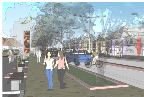
Gambar 4. Prinsip dimensi dan fasilitas pada jalur pedestrian