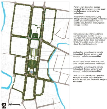
Gambar 6. Jalur green belt sepanjang koridor