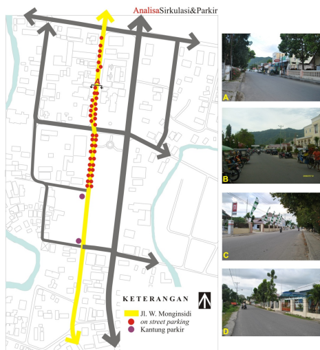
Gambar 1. Batas koridor komersial yang akan dirancang