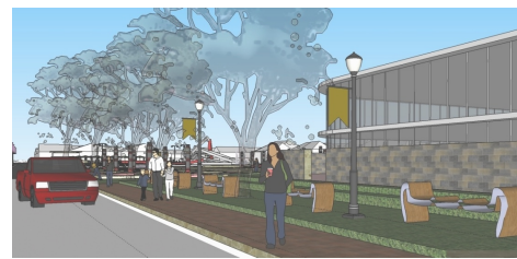
Gambar 5. Prinsip dimensi dan fasilitas pada jalur pedestrian