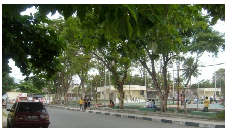
Gambar 7. Jenis Vegetasi pohon Angsana yang dipertahankan di sepanjang koridor