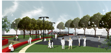
Gambar 8. Jenis Vegetasi pohon Angsana ditanam sepanjang koridor (sumber : Olahan, 2016)