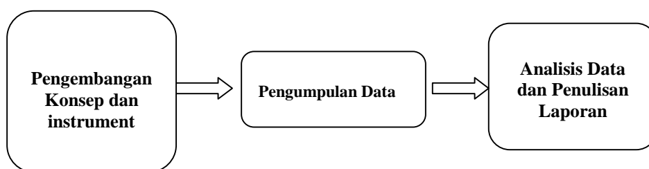
Gambar 2 Alur Penelitian

Secara umum, pelaksanaan tracer study ini dilakukan melalui tiga tahapan, seperti ditampilkan pada Gambar 2 di bawah ini.