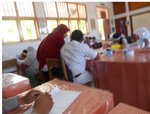
Gambar 2: Bimbingan Guru PPL dalam Diskusi Kelompok Kecil