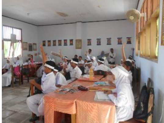
Gambar 1. Pemantauan Proses Belajar Mengajar oleh Tim Pdneliti di SMP Negeri 1 Gorontalo

teknik PDCA Penjaminan Mutu semakin mengental mewarnai kegiatan FGD, sebagai wahana pembentukan perilaku guru profesional calon guru Bahasa Inggris Profesional.