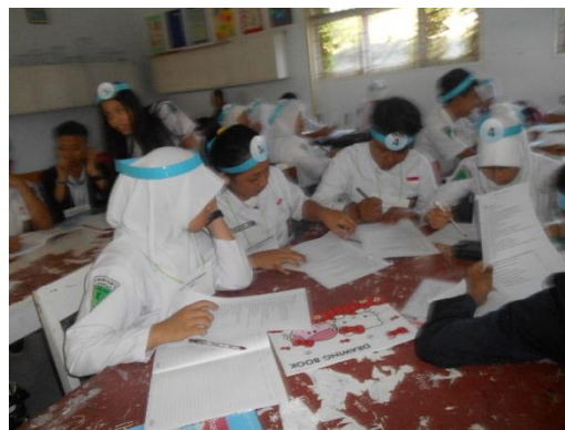
Gambar 3: Penyelesaian Tugas Kelompok