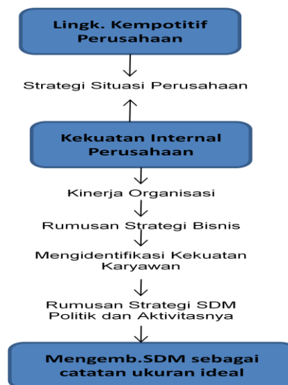
Bagan 3; Strategi MSDM Dessler (2011;112-113)

Dengan persyaratan kekuatan atau kemampuan pekerja ini, manajemen sumber daya manusia merumuskan strategi kebijakan-kebijakan dan praktek untuk menghasilkan keterampilan kekuatan pekerja yang diinginkan baik dari segi kemampuan, dan perilaku. Akhirnya, manajer sumber daya manusia dapat mengidentifikasi ukuran karyawan yang menggunakan ukuran pada tingkat kebijakan dan praktek barunya yang memang benar-benar memproduksi keterampilan serta perilaku karyawan yang diperlukan. Dibawah dapat dilihat melalui bagan arus proses strategi manajemen sumber daya manusia secara aplikatif yang dilakukan oleh perusahaan bisnis;