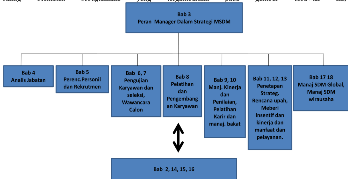
Bagan 1; Struktur Peran Manajer Dalam Strategi MSDM

Gary (2011:97) mengungkapkan bahwa ruang lingkup Bab III mencakup beberapa hal penting yang saling berkaitan sebagaimana yang tergambar pada gambar dibawah ini;