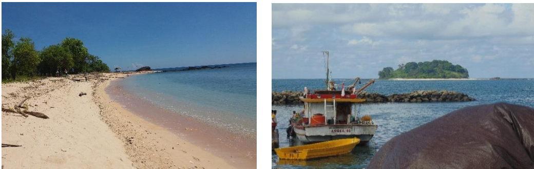
Gambar 1. Pulau Dokokayu

Desa Pasalae adalah salah satu desa di Kecamatan Gentuma Raya Kabupaten Gorontalo Utara yang resmi menjadi desa definitive pada tanggal 22 Desember 2010 memiliki batas wilayah sebelah utara berhadapan dengan Laut Sulawesi. Berdasarkan data dari balai desa, bahwa desa pesisir ini memiliki potensi hasil laut, sehingga jenis pekerjaan nelayan sebanyak 424 orang merupakan pekerjaan paling dominan dilakukan masyarakat. Selain itu juga, di desa pasalae terdapat salah satu pulau yang di berikan nama pulau Dokokayu yang memiliki potensi sebagai objek wisata dengan memiliki potensi karang dan pasir putih sehingga layak dijadikan sebagai destinasi wisata bahari. Jarak antara Daratan dengan pulau Dokokayu bisa ditempuh menggunakan perahu nelayan dengan memakan waktu tempuh 25 menit dari dermaga TPI Gentuma. Adapun keadaan pulau Dokokayu dapat dilihat pada Gambar berikut :