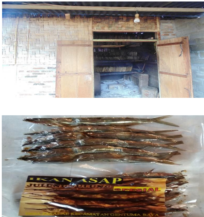
Gambar 2. Alat pengasapan dan Produk ikan asap yang akan dibuat Produk sambal

Selain potensi lokal bahari sebagai objek destinasi wisata, di desa Pasalae terdapat tempat Pengolahan ikan asap yang sudah berlangsung lama dan umumnya dilakukan secara turun temurun. Perbaikan teknologi pengolahan ikan asap di desa ini telah dilakukan melalui program KKS pengabdian UNG periode 2014 serta melalui penelitian MP3Ei Tahun 2016 telah menghasilkan P-IRT untuk produk ikan roa asap tersebut dengan Nomor P-IRT : 2027305156003621 dari Dinas Kesehatan Kabupaten Gorontalo Utara. Hasilnya diperoleh efisiensi bahan bakar dan waktu pengasapan serta mutu organoleptik dan kadar air telah sesuai standar SNI. Dimana nilai organoleptik 7 dan kadar airnya 35%. Metode pengasapan yang digunakan adalah metode pengasapan cabinet yang termodifikasi yang dapat dilihat pada Gambar 2.