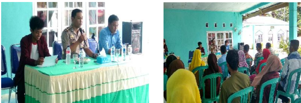
Gambar 8. Kegiatan sosialisasi tertib keamanan dan berkendara