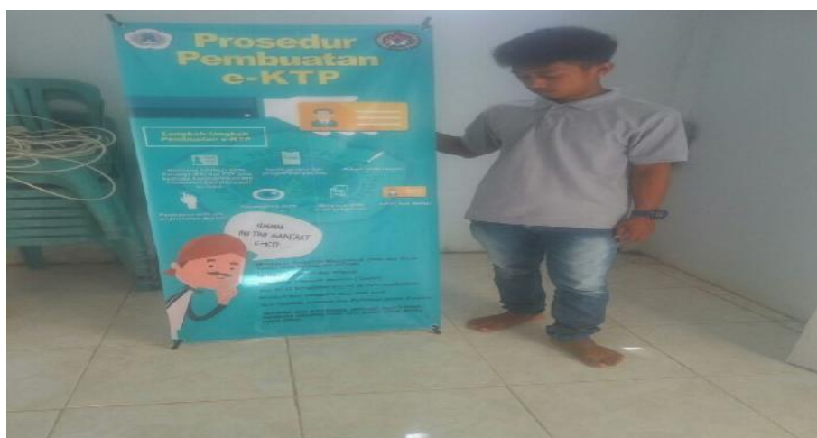
Gambar 1. Alur pengurusan KTP

Kegiatan ini dilaksanakan pada tanggal 25 September 2017. Sosialisasi ini dilakukan agar masyarakat sadar tentang pentingnya memiliki kartu identitas, tahu pentingnya KTP sbagai kartu identitas dan manfaat dan kegunaan yang diperoleh ketika memiliki KTP dan paham bagaimana prosedur pembuatan KTP seperti terlihat pada gambar dibawah ini :