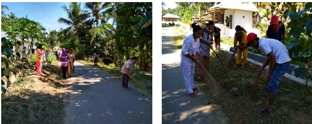
Gambar 6. Kegiatan bersih-bersih secara gotong royong dilingkungan desa