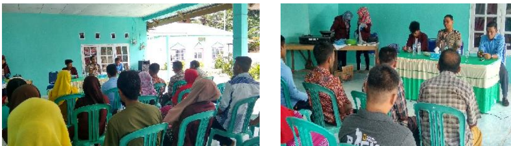
Gambar 7. Kegiatan sosialisasi narkoba dan KDRT

Kegiatan ini dilaksanakan pada tanggal 16 Oktober 2017. Kegiatan ini bertujuan untuk menginformasikan kepada generasi muda untuk mengetahui bahwa narkoba dan mengetahui hukum mengenai KDRT, selain itu agar peserta ikut berperan aktif berpartisipasi dalam pencegahan peredaran maupun penggunaan narkoba dan KDRT seperti terlihat pada gambar dibawah ini :