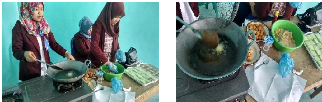
Gambar 9. Kegiatan pelatihan kewirausahaan

Kegiatan ini dilaksanakan pada tanggal 16 Oktober 2017. Kegiatan dilakukan dengan tujuan memberikan pelatihan kepada masyarakat dalam berwirausaha, dimana berwirausaha dapat menopang perekonomian masyarakat sehingga masyarakat lebih mandiri seperti terlihat pada gambar dibawah ini :