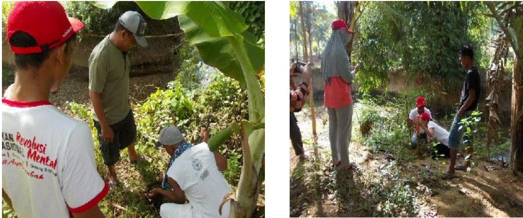
Gambar 2. Kegiatan penanaman pohon bambu adat