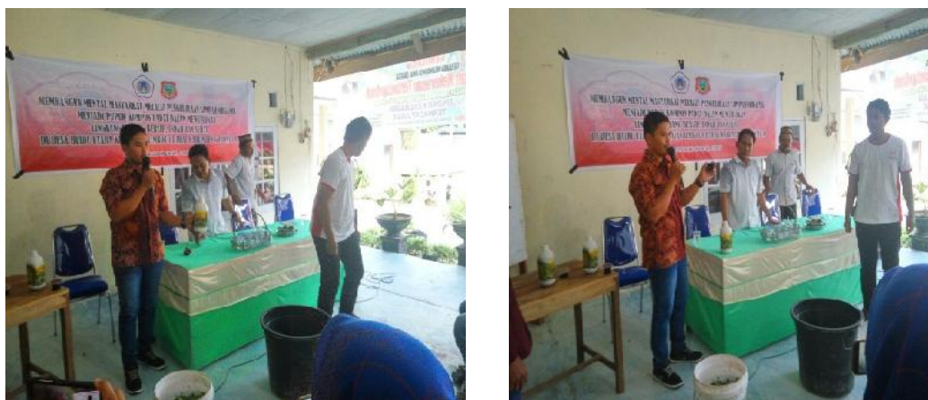
Gambar 5. Kegiatan pembuatan kompos dengan bahan baku sisa sampah rumah tangga

Kegiatan ini dilaksanakan pada tanggal 20 September 2017. Kegiatan ini bertujuan untuk memanfaatkan sisa sampah rumah tangga agar dapat berguna bagi masyarakat seperti terlihat pada gambar dibawah ini :