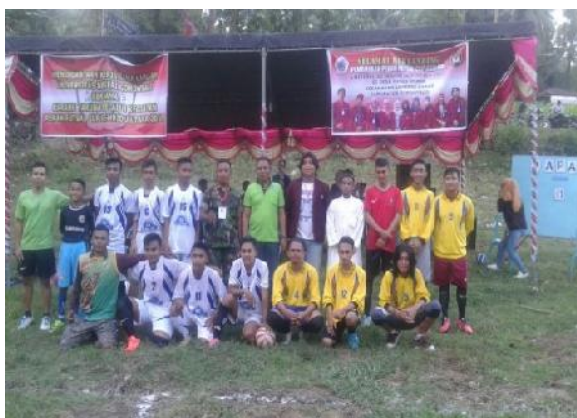
Gambar 11. Kegiatan Olahraga

Kegiatan ini dilaksanakan pada tanggal 8 Oktober 2017. Kegiatan ini dilaksanakan dengan tujuan untuk memepererat tali persaudaraan masyarakat antar dusun di desa Huidu Utara terlihat pada gambar dibawah ini :