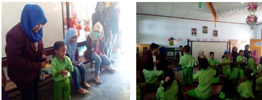
Gambar 4. Kegiatan sosialisasi gerakan mencuci tangan yang baik bagi siswa SD (Sumber : Dokumentasi Mahasiswa KKN)