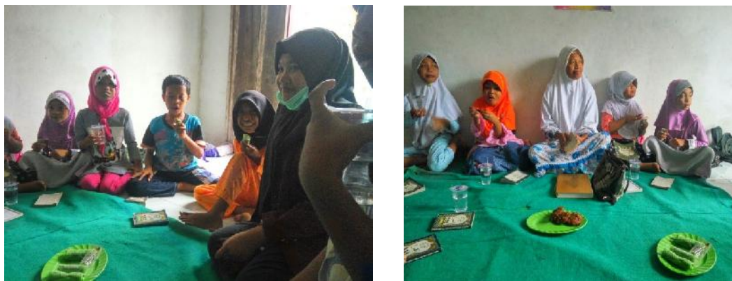
Gambar 10. Kegiatan meningkatkan kegiatan taman pengajian