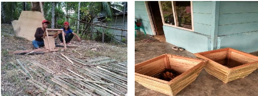
Gambar 3. Kegiatan pembuatan tempat sampah

Kegiatan ini dilaksanakan pada tanggal 18 September 2017. Kegiatan ini dilakukan agar kebersihan lingkungan lebih terjaga dengan tidak berserakannya lagi sampah-sampah seperti terlihat pada gambar dibawah ini :