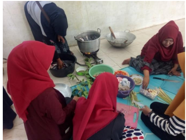
Proses Penyiapan Bumbu