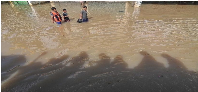
Gambar 1. Kondisi Banjir Desa Harapan