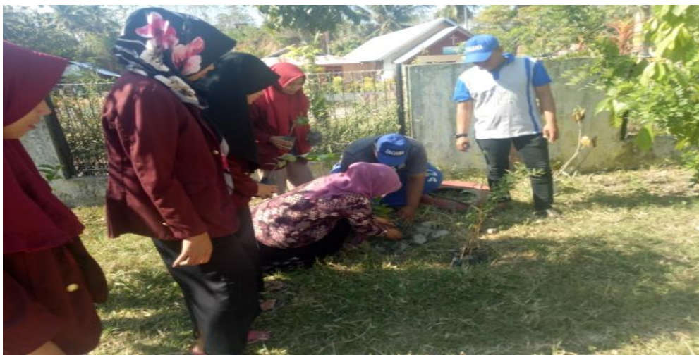
Foto kegiatan menanam pohon bersama masyarakat desa harapan