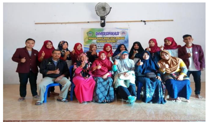
Pelatihan Olahan Ikan Lele Bersama PKK