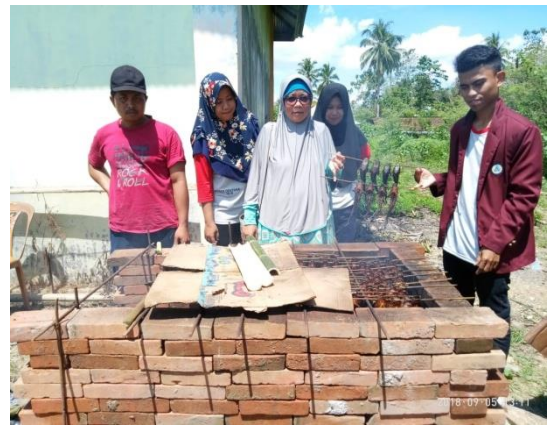
Proses Pengasapan Lele Asap