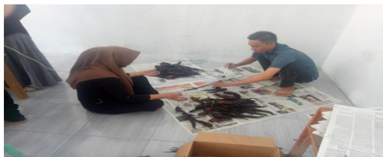
Gambar 9. Pengasapan ikan lele