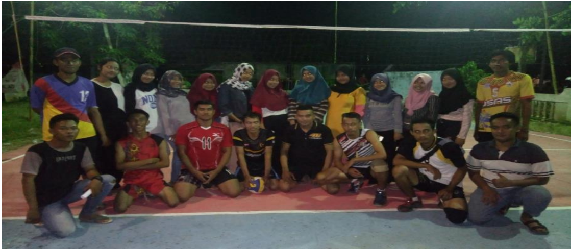
foto pelaksanaan kegiatan Tambahan desa harapan