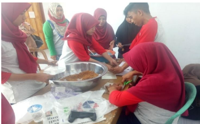
Proses Pengemasan Lele Abon dan Asap lele