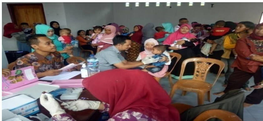
Gambar 16.Imunisasi Campak