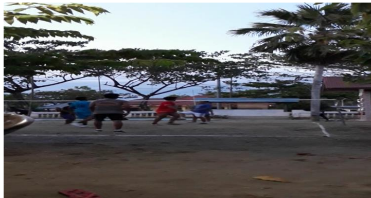
Gambar 15 .Lomba Sepak Bola Takraw