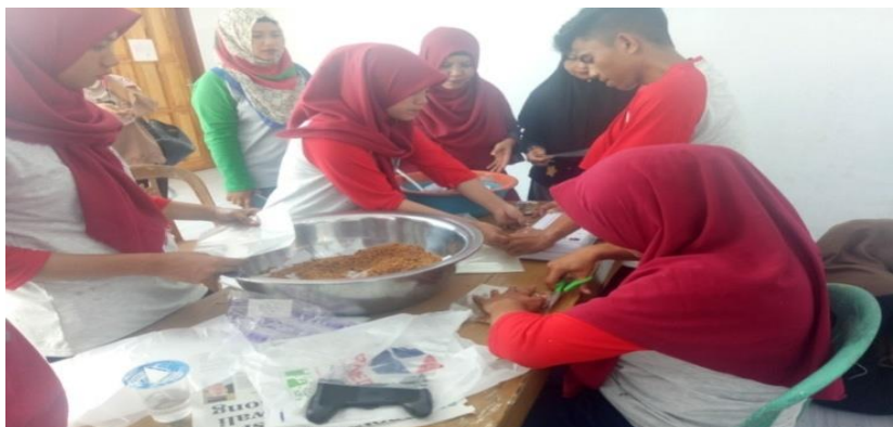
Gambar 7. Pelatihan olahan ikan lele