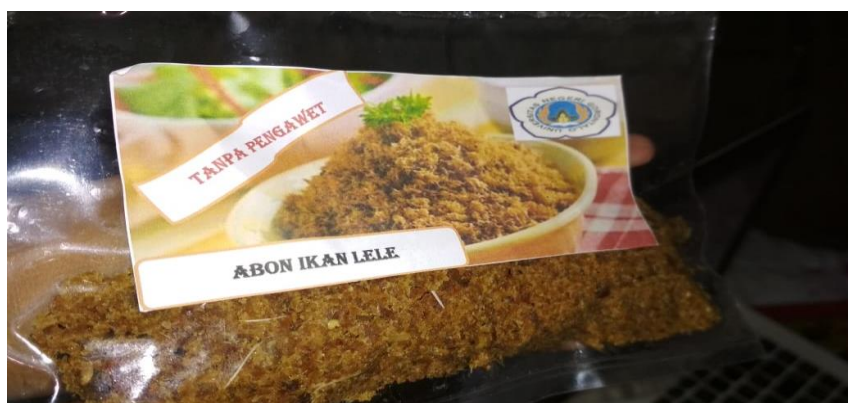
Gambar 8. Produk abon ikan lele