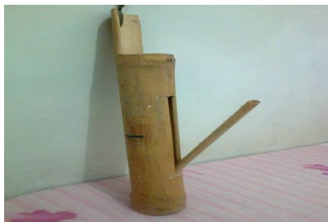
Gambar 6. Kentongan Sebagai Peringatan Dini Bencana

Tujuan penyiapan sistem peringatan dini bagi masyarakat Indonesia, Sistem Peringatan Dini sangat lah penting mengingat Negara kita merupakan negara yang memiliki ancaman bencana alam cukup tinggi. dengan adanya sistem peringatan dini ini di harapkan akan dapat dikembangkan upaya-upaya yang tepat untuk mencegah atau paling tidak mengurangi terjadinya dampak bencana alam bagi masyarakat. Keterlambatan dalam menangani bencana dapat menimbulkan kerugian yang semakin besar bagi masyarakat. Dalam siklus manajemen penanggulangan bencana, sistem peringatan dini bencana alam mutlak sangat diperlukan dalam tahap kesiagaan, sistem peringatan dini untuk setiap jenis data, metode pendekatan maupun instrumentasinya. Tujuan di ciptakan sistem peringatan dini ini agar masyarakat yang tinggal di kawasan bencana bisa aman dalam beraktifitas sebab peringatan dini akan terjadinya bencana sudah bisa di ketahui, sehingga masyarakat juga bisa melakukan pencegahan untuk menyelamatkan diri saat terjadinya bencana alam.