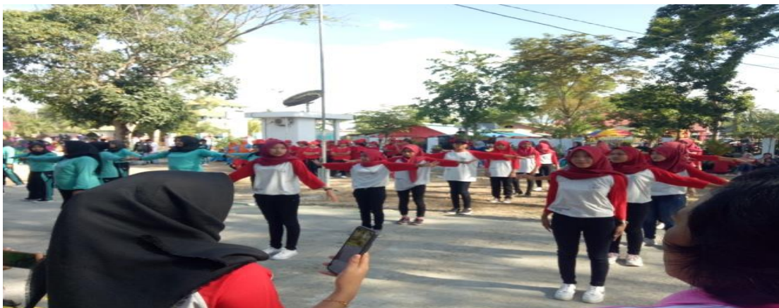
Foto mahasiswa kks desa harapan mengikuti lomba tobelo sekecamatan wonosari