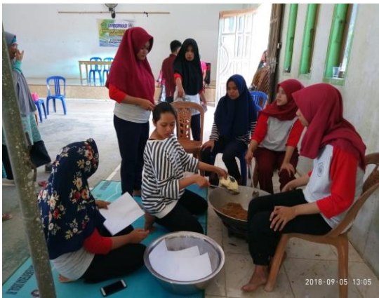
Proses Pembuatan Abon Ikan Lele