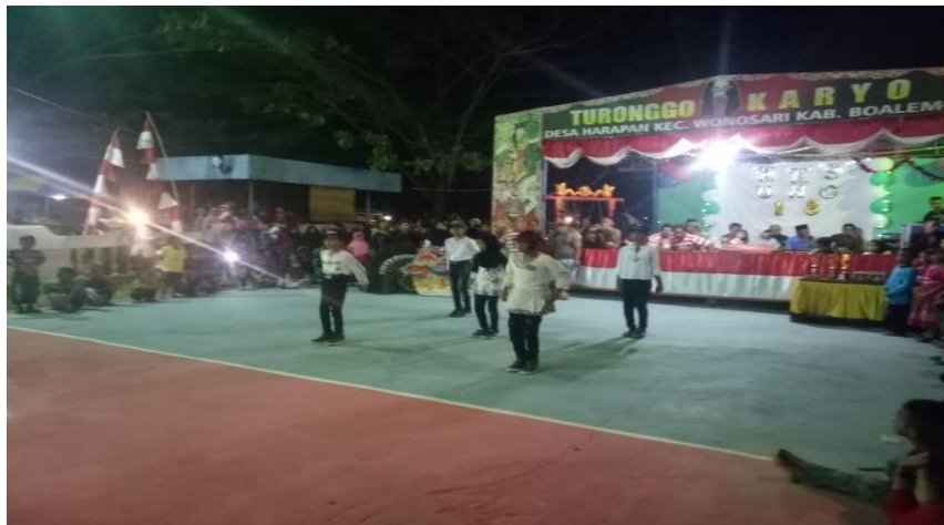
Gambar 12.Kesenian Turonggo