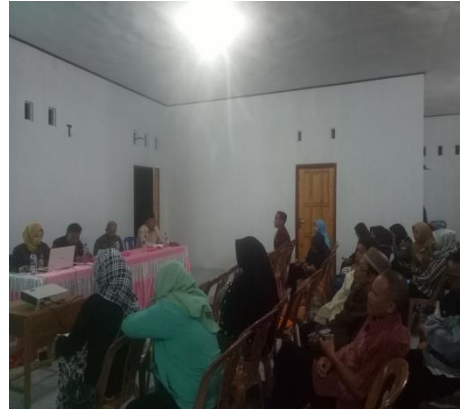
Pembentukan Forum Destana