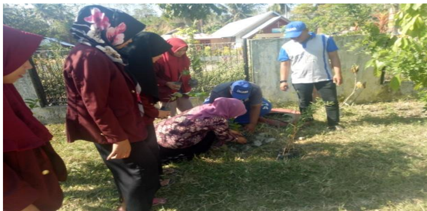
Gambar 10 . Penanaman Pohon Penghijauan