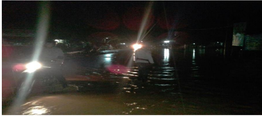
Gambar 2. Banjir Kecamatan Wonowari

Bencana alam yang terus-menerus terjadi belakangan ini menyebabkan banyak orang mengungsi atau tinggal di tempat-tempat darurat. Dalam beberapa kondisi, kejadian bencana menyebabkan rusaknya sarana dan prasarana sosial di lokasi bencana yang memutus akses korban terhadap ketersediaan air bersih dan bahan bakar (api, sumber energi) sehingga korban mengalami kesulitan untuk memperoleh kebutuhan pangannya. Disamping itu, kerusakan infrastruktur yang terjadi juga menyebabkan pemberian bantuan pangan ke lokasi menjadi sulit. Semua kondisi ini membuat tingginya kebutuhan terhadap bantuan pangan untuk korban bencana, terutama pangan darurat yang dapat langsung dikonsumsi dan memenuhi kebutuhan nutrisi korban dalam masa panik (beberapa hari pasca bencana sebelum dapur umum dapat beroperasi secara baik), serta mudah dikirimkan ke lokasi bencana (Kemenkes RI, 2011).