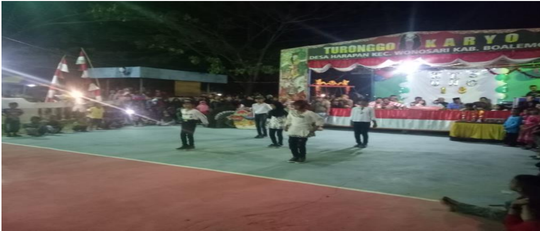
Foto penampilan kesenian turonggo pada saat acara penutupan kegiatan kks destana desa harapan