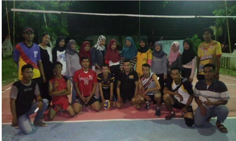
Gambar 14. Lomba Bola Volly