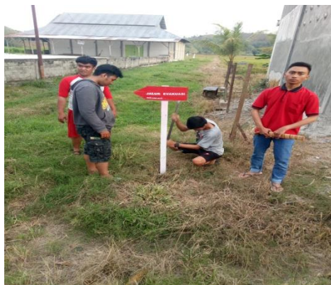
Pemasangan Jalur Evakuasi