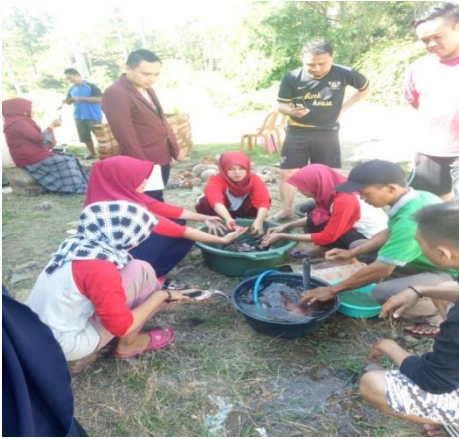
Proses Pembersihan Ikan Lele