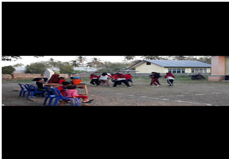
Gambar 13.Bola Kaki Dandut