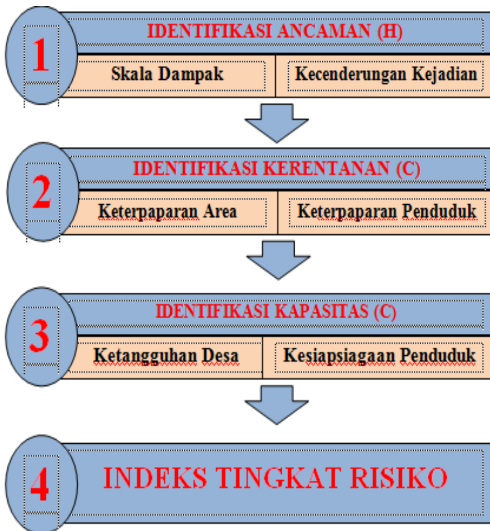
Gambar 4. Penilaian Resiko Bencana

Kajian risiko bencana Desa Harapan Kecamatan Wonosari Kabupaten Boalemo merupakan panduan bagi Pemerintah Desa dan Masyarakat dalam melaksanakan kegiatan pengurangan risiko bencana. Penilaian Risiko Bencana adalah mekanisme terpadu untuk memberikan gambaran menyeluruh terhadap risiko bencana suatu daerah dengan menganalisis tingkat ancaman, tingkat kerugian dan kapasitas daerah (Perka BNPB No. 1 Th. 2012).