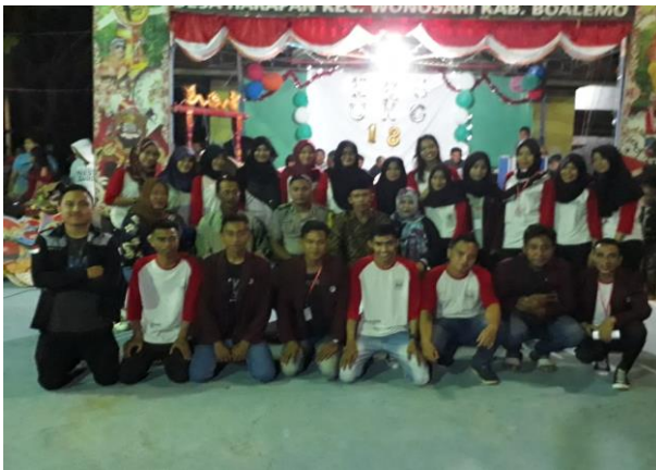
Foto bersama dengan kapolsek dan aparat Desa Harapan