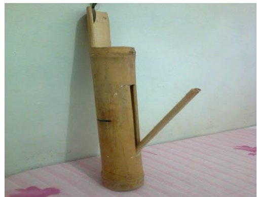
Alat Peringatan Dini(Kentongan)