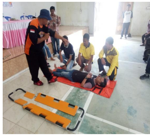
Sosialisasi dan Pelatihan Destana Desa Harapan