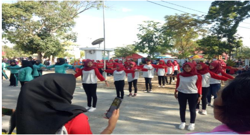
Gambar 11.Senam Tobelo