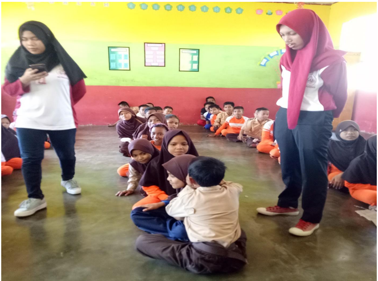
Pelaksanaan Kegiatan Inti di Desa Diloato