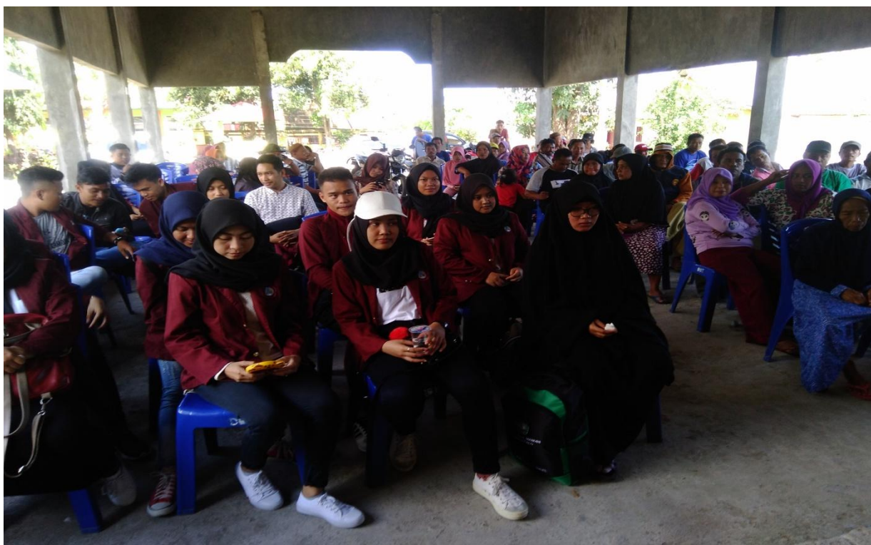
Kegiatan Penerimaan KKS Destana 2018 di Desa Bongo Tua