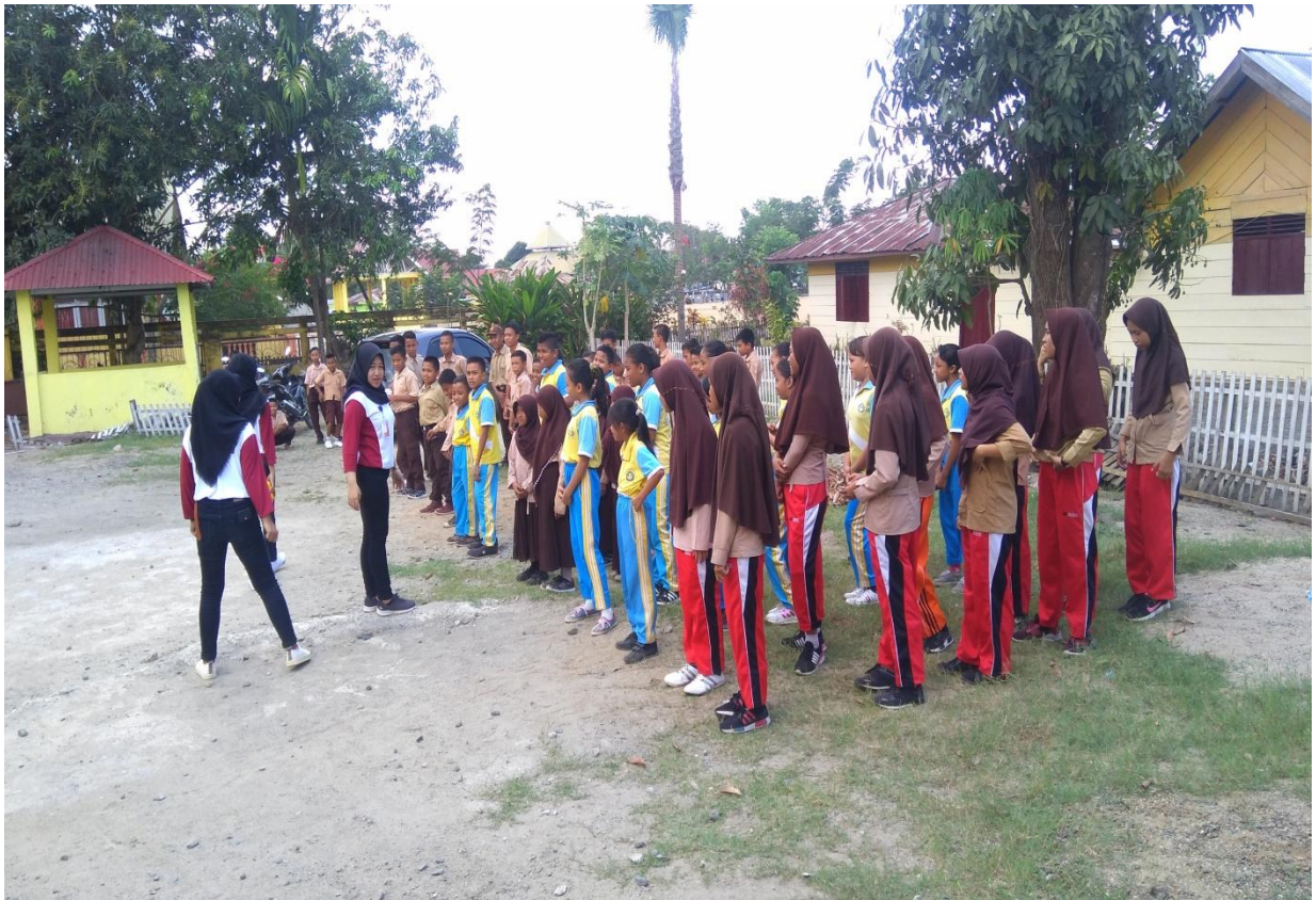
Pelaksanaan Kegiatan Inti di Desa Bongo Tua