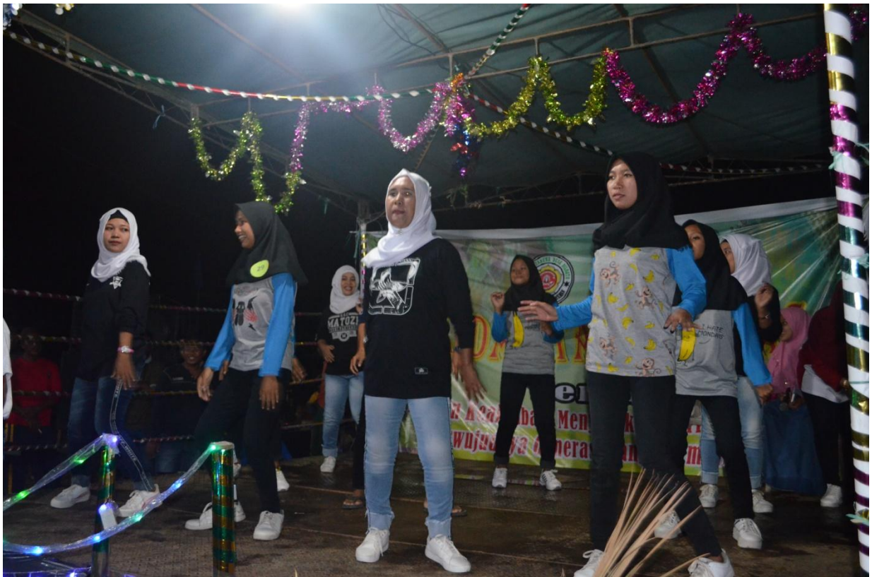
Pelaksanaan Kegiatan Tambahan