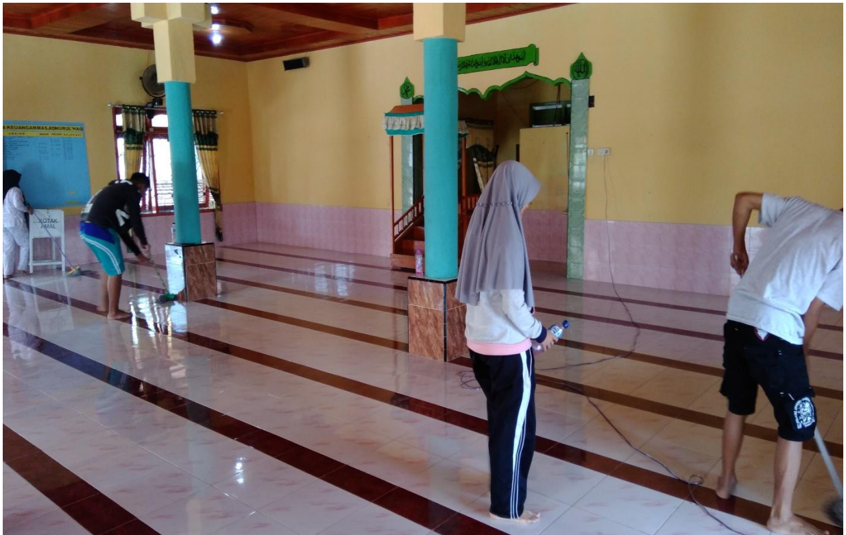
Pembersihan Mesjid Oleh Mahasiswa KKS di Desa Bongo Tua