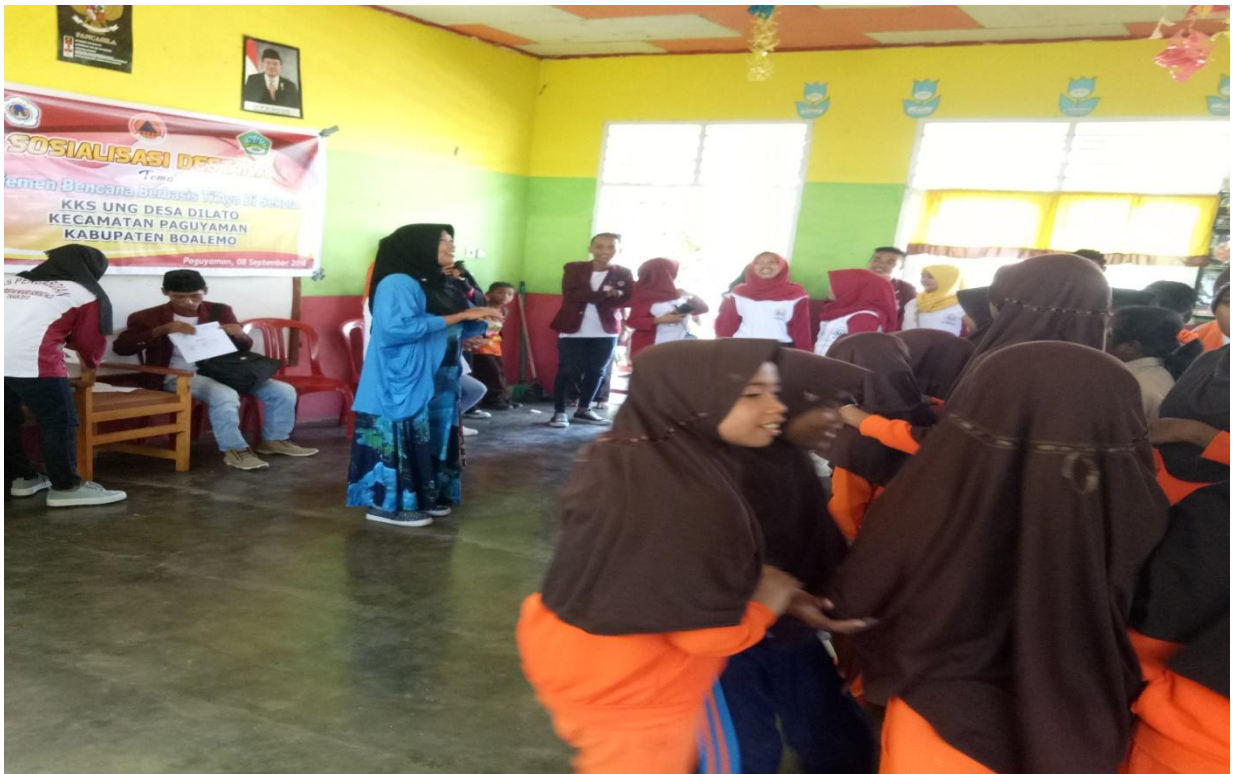
Pelaksanaan Kegiatan Inti di Desa Diloato