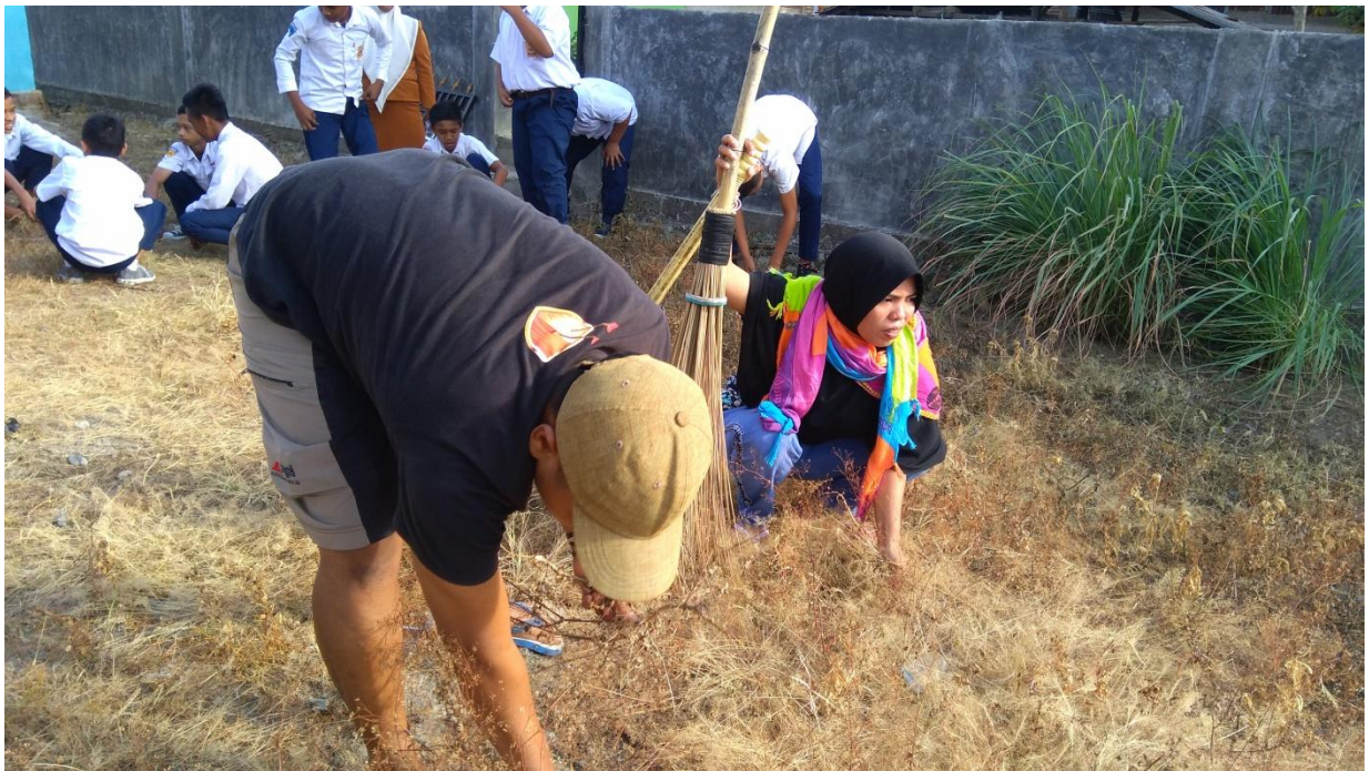
Kegiatan Kebersihan Lingkungan Oleh Mahasiswa KKS, Siswa dan Masyarakat di Desa Bongo Tua