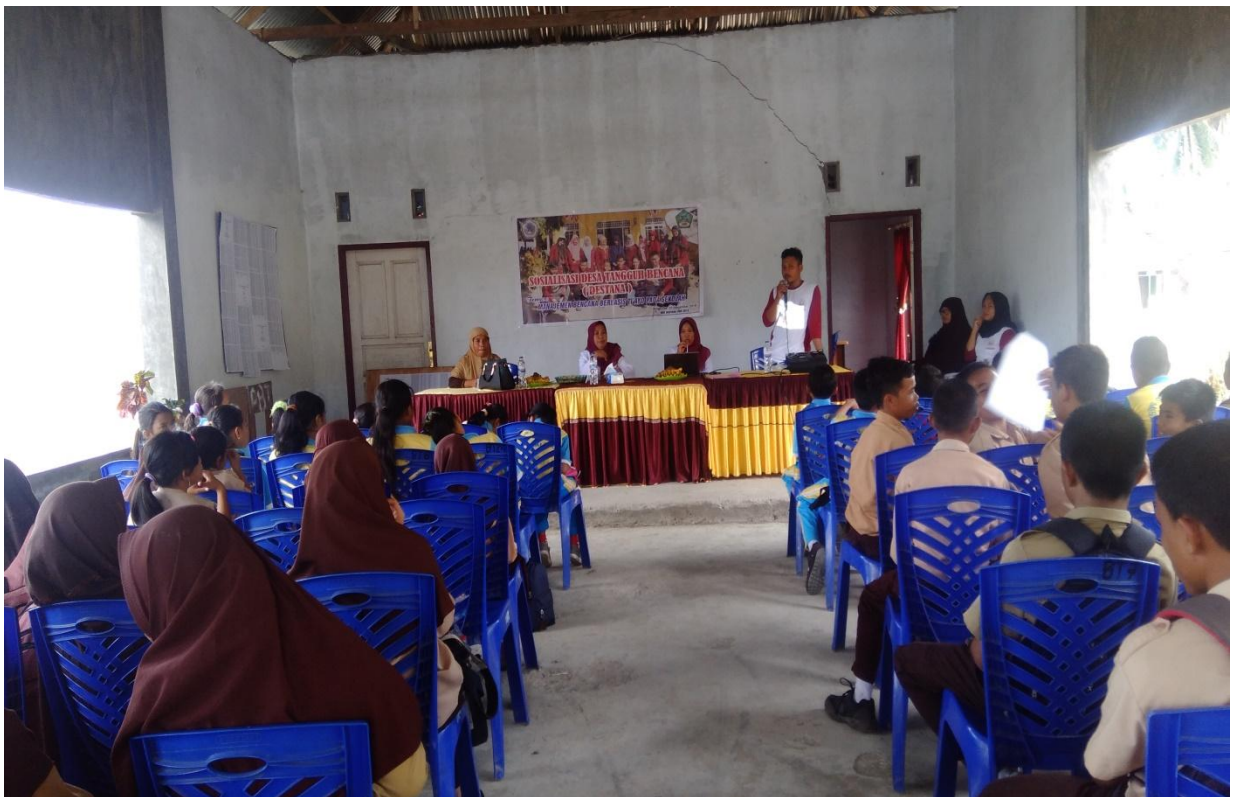
Pelaksanaan Kegiatan Inti di Desa Bongo Tua