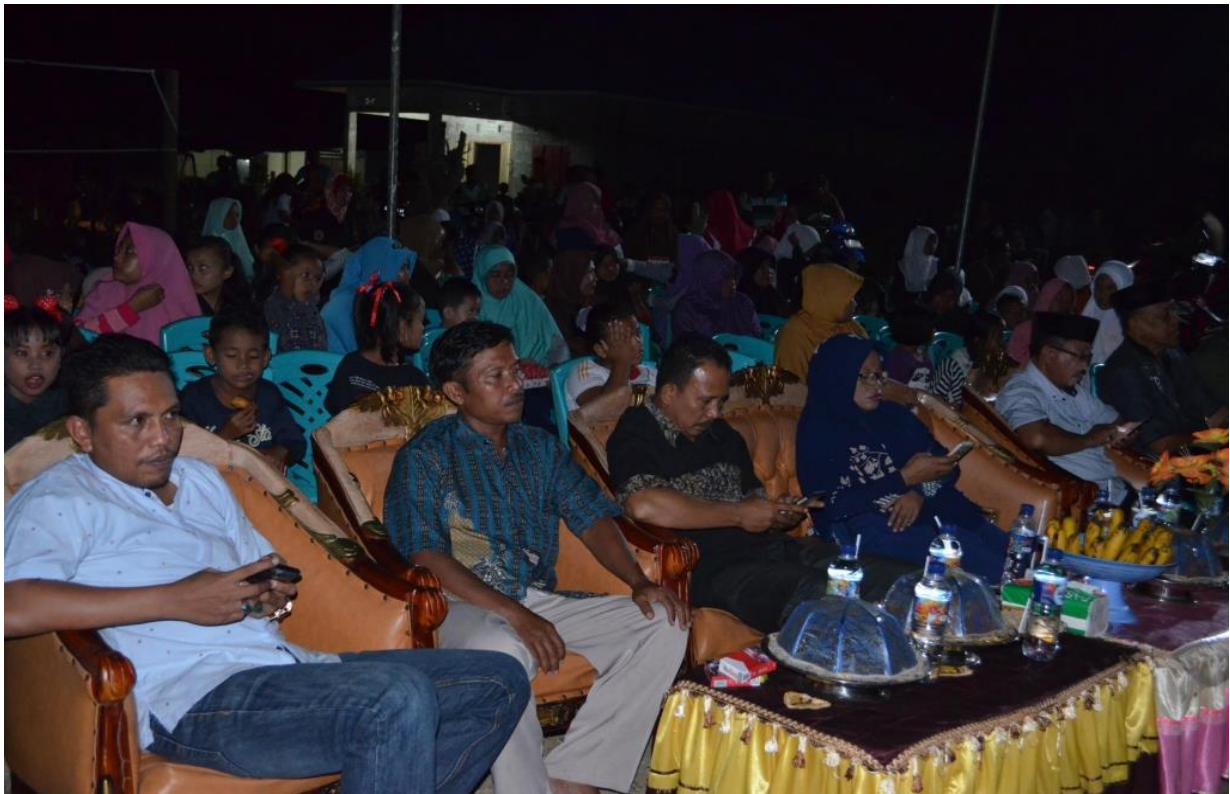
Pelaksanaan Kegiatan Tambahan