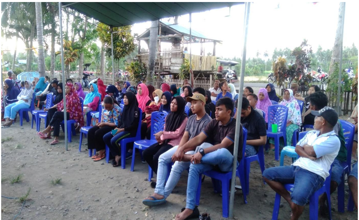
Kegiatan Sosialisasi dan Pelatihan Forum Destana di Desa Bongo Tua