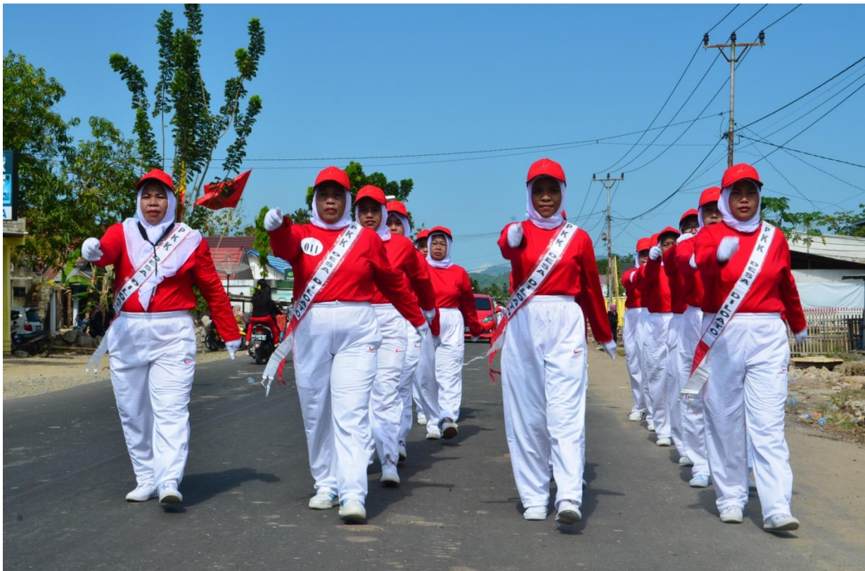
Partisipasi Mahasiswa KKS Pada Peringatan Hari Kemerdekaan 17 Agustus 2018 di Desa Diloato