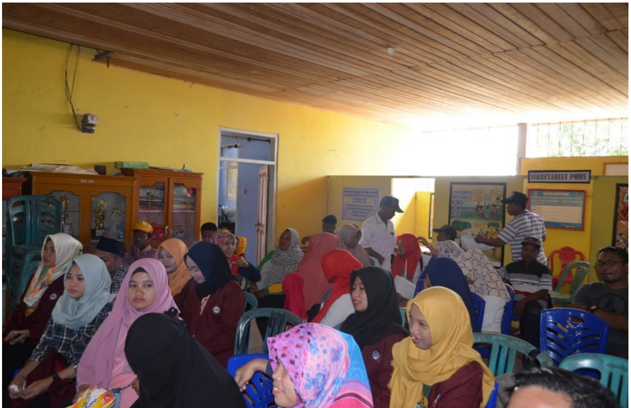
Sosialisasi dan Simulasi Destana di Desa Diloato