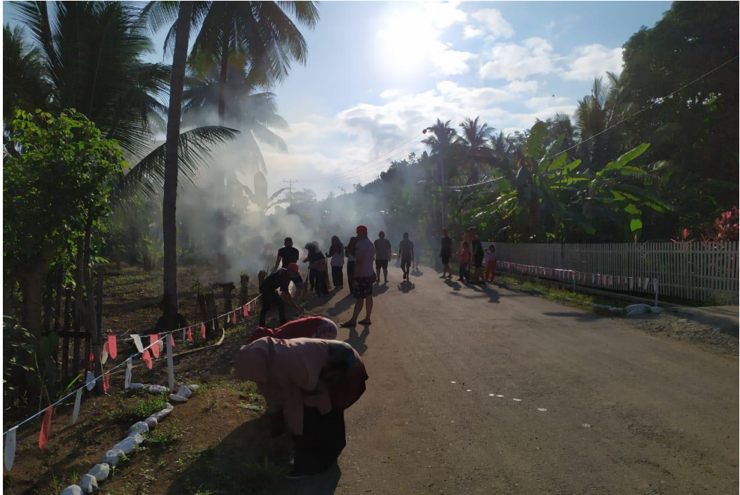
Kegiatan Tambahan : Kerja Bakti membersihkan lingkungan desa