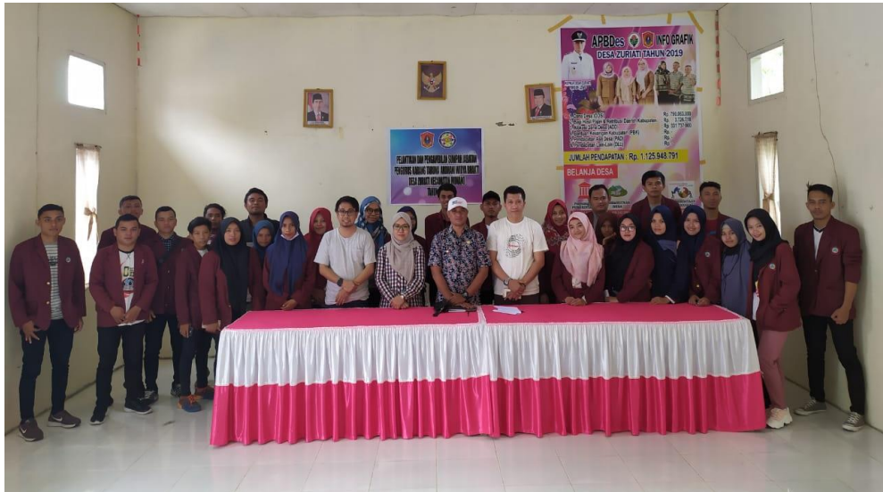
Foto bersama saat Penerimaan Peserta KKS di Desa Zuriaty oleh Kepala Desa