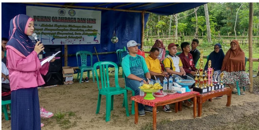
Gambar 5.4. Evaluasi Kegiatan melalui Acara Pembukaan Kegiatan Olahraga

Pada kegiatan ini dilakukan perengkingan terhadap kinerja aparat desa dari hasil yang diperoleh melalui pengolahan data yang dilakukan oleh mahasiswa bersama Dosen Pembimbing Lapangan. Hasil yang telah didapatkan tersebut di sosialisasikan kepada masyarakat beserta aparat desa yang bersangkutan agar dapat menjadi bahan evaluasi dalam menjalankan tugas dan kewajibannya kedepan, sehingga kinerjanya dapat lebih meningkat. Bagi masyarakat desa, hal ini dapat menjadi acuan dalam menilai kinerja aparat desa di tahun-tahun yang akan datang. Kegiatan ini kami laksanakan pada saat melaksanakan kegiatan tambahan yaitu pembukaan kegiatan Olahraga dan Kesenian antar masyarakat desa.