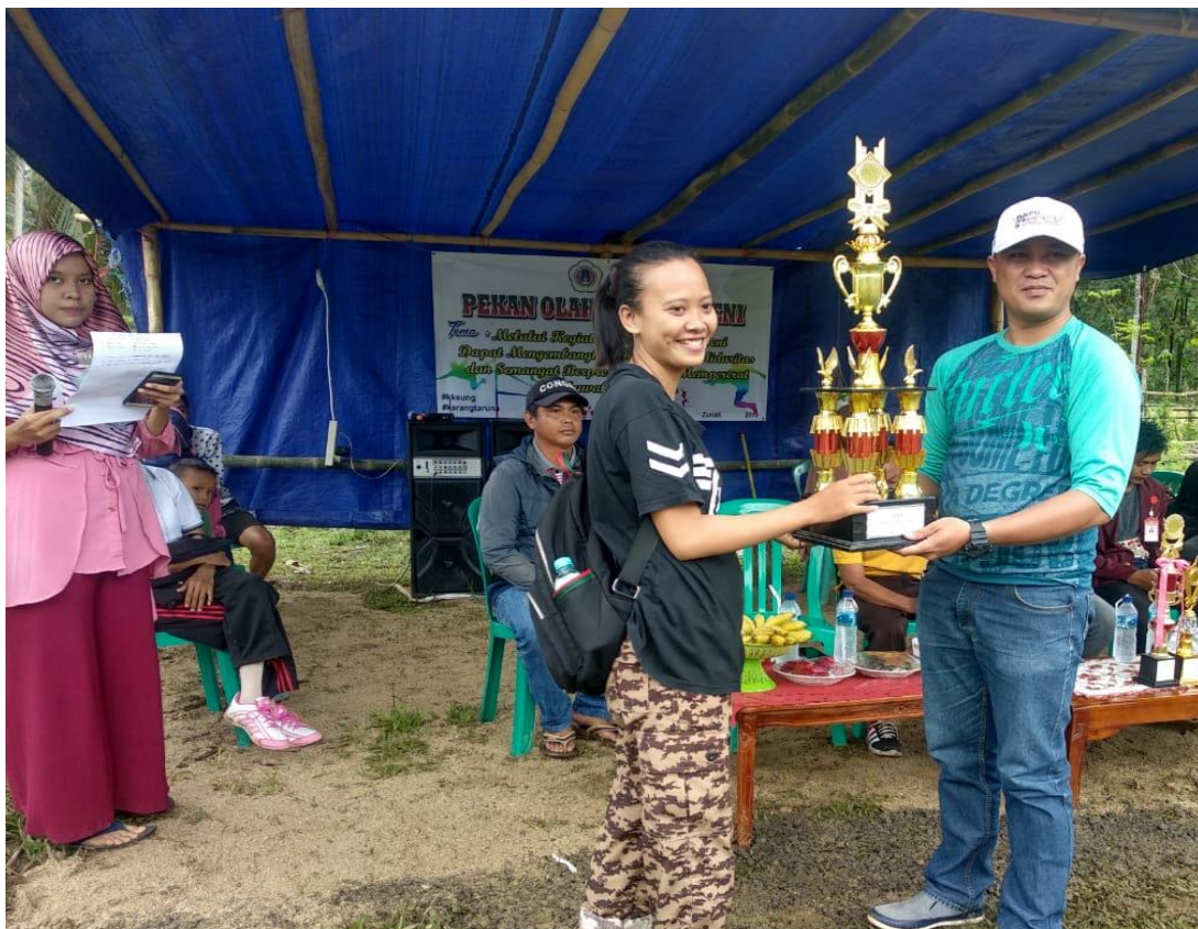
Gambar 5.4. Pemberian trophy bagi aparat desa dengan kinerja terbaik

Hasil yang didapatkan tentunya sangat bermanfaat baik bagi masyarakat maupun aparat desa dalam meningkatkan kinerjanya kedepan, serta dapat menjadi pembelajaran sudah sejauh mana kinerjanya dalam melayani masyarakat desa Zuriati. Diakhir acara, Kepala Desa menyerahkan trophy kepada Aparat Desa dengan kinerja terbaik. Menurut Kepala Desa, hal ini dimaksudkan agar dapat menjadi sebuah motivasi bagi aparat desa dalam meningkatkan kinerjanya di masa-masa yang akan datang.