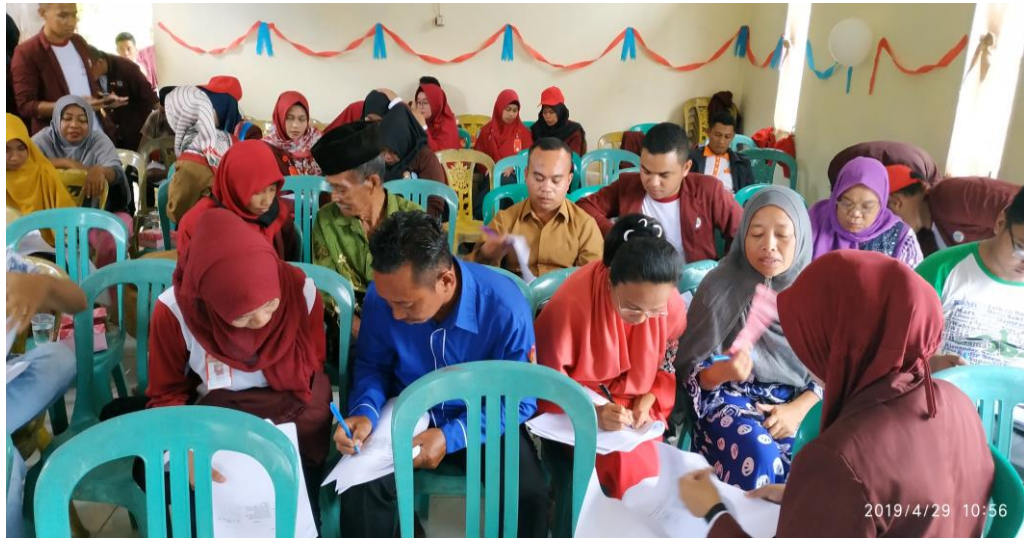
Gambar 5.3. Pendampingan mahasiswa kepada masyarakat dalam mengisi kuesioner.