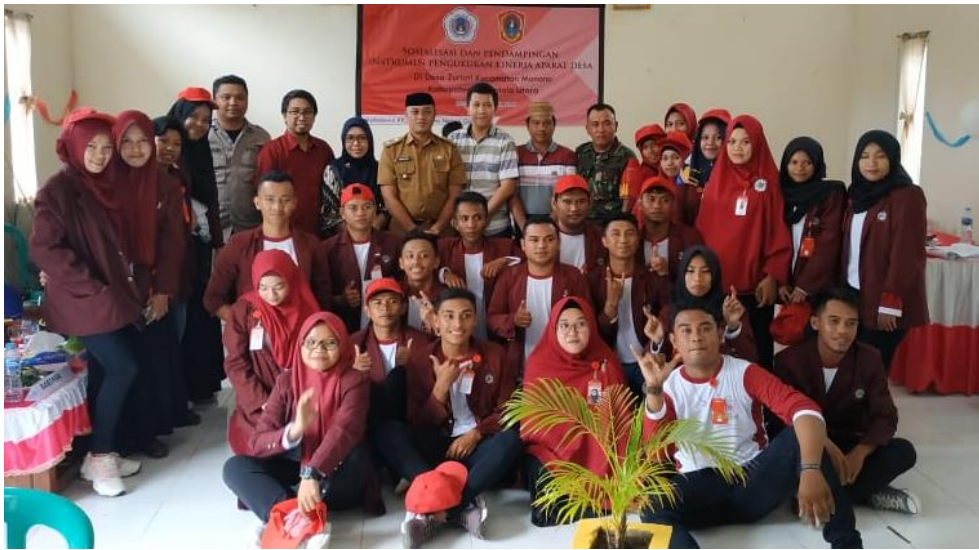
Foto bersama Usai Kegiatan Sosialisasi dan pendampingan instrumen penilaian kinerja aparat Desa Zuriati