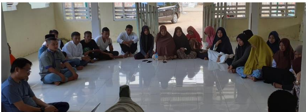
Pertemuan Rutin peserta di Posko KKS