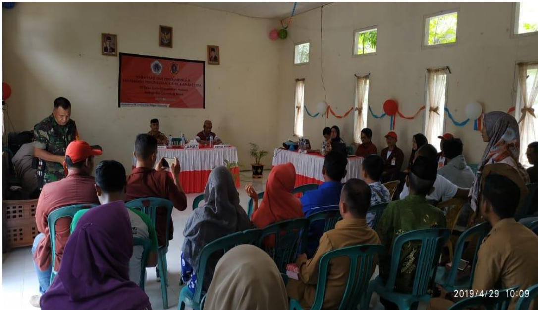
Gambar 5.2. Pendampingan penilaian kinerja aparat desa Zuriati

Pendampingan ini sangat membantu dan memudahkan masyarakat dalam proses penilaian kinerja aparat desa melalui pengisian kusioner yang telah disediakan. Kegiatan pendampingan ini dilaksanakan selama satu hari penuh dan dilaksanakan di Aula kantor desa zuriati, yang juga dihadiri oleh unsur keamanan desa yakni Babinsa dan Babinkamtibmas. Rangkaian kegiatan ini berlangsung dengan aman, lancar, dan sukses atas dukungan seluruh lapisan masyarakat desa, serta perangkat desa yang selalu membantu baik sarana maupun prasarana untuk memudahkan kegiatan.