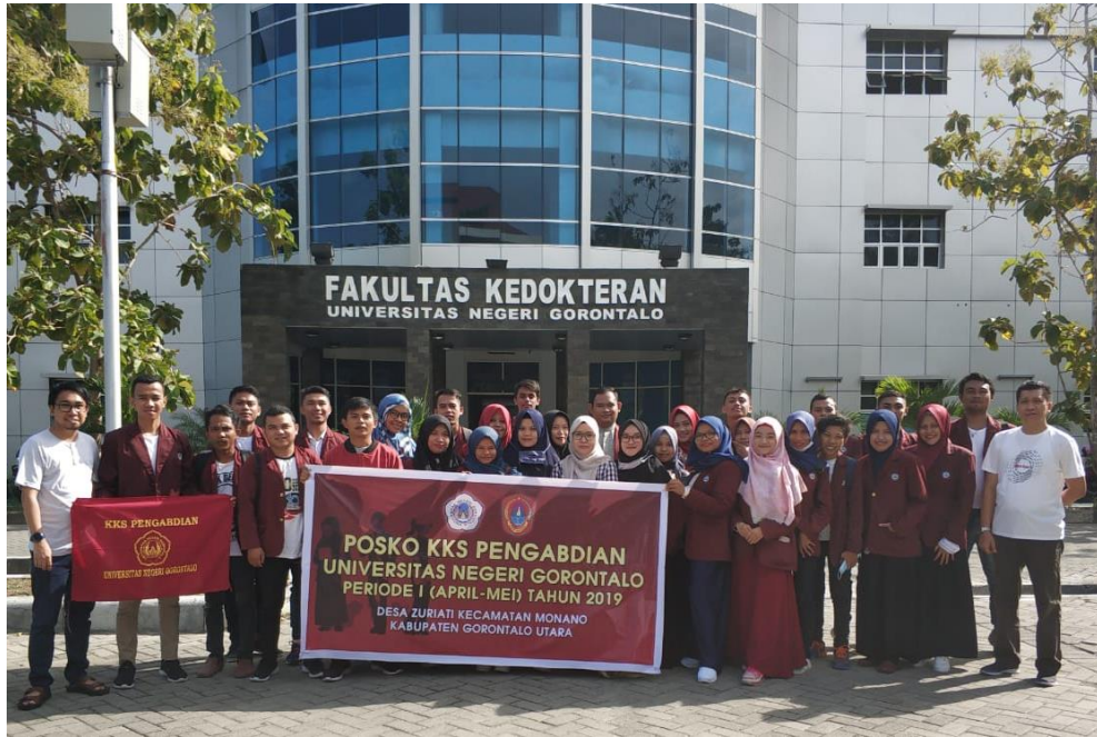
Foto bersama saat Pengantaran Peserta KKS