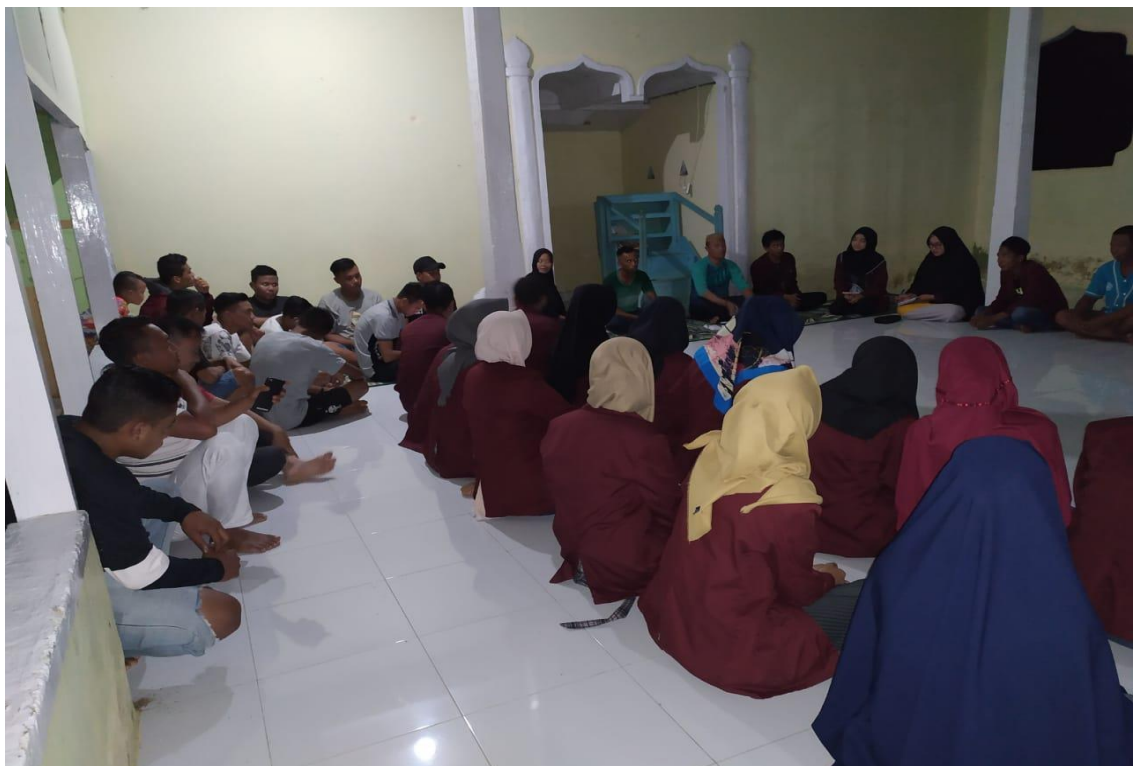
Gambar 5.1. Sosialisasi kegiatan penilaian kinerja aparat desa

yang berada pada lingkungan desa Zuriati yang merupakan objek yang akan menilai kinerja aparat desa. Dalam pelaksanaannya terdapat kendala yaitu beberapa masyarakat tidak dapat kami sosialisasikan dikarenakan sedang ada keperluan di luar rumah sehingga tidak dapat disampaikan mengenai teknis penilaian kinerja aparat desa yang akan dilaksanakan. Akan tetapi hal tersebut dapat diatasi dikarenakan bantuan dari kepala desa yang juga membantu dalam mensosialisasikan kegiatan tersebut.