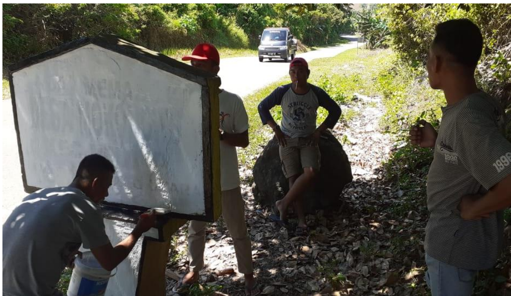
Kegiatan Tambahan : Memperbaharui Tapal Batas Desa