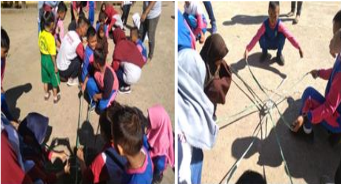
Gambar 4. Outbond SDN 2 Anggrek

Agenda tambahan yang kami lakukan yaitu kegiatan outbond di sekolah SDN 2 Anggrek. majelis taklim bekerjasama dengan ibu-ibu majelis taklim di desa popalo, kerja bakti di mesjid dan gereja yang ada di desa popalo, kegiatan pentas seni dan olahraga, dan pembuatan batas-batas dusun di desa popalo.