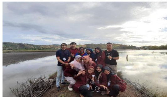
Gambar 2. Penyuluhan Good Handling Practice Udang Vaname