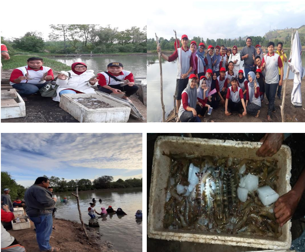
Gambar 3 Proses Panen dan Penanganan Pasca Panen Udang Vaname

Grading atau pengkelasan adalah mengelompokkan produk berdasarkan ukuran, bentuk, warna hingga tingkat kematangan. Masing-masing komoditi memiliki syarat mutu tertentu untuk pengkelasannya yang diatur dalam sebuah Standard Operational Procedure (SOP). Grading bermanfaat untuk menghasilkan produk yang seragam sehingga dapat memberikan kepuasan bagi konsumen.