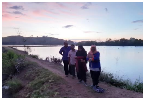
Gambar 1. Penerimaan mahasiswa KKS