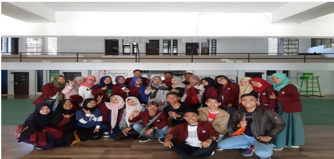
Gambar 7. Mahasiswa KKS tiba di UNG