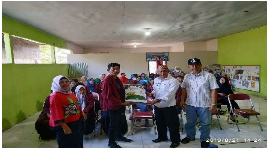
Gambar 17. Penyerahan pupuk organik kepada kepala desa Bulalo