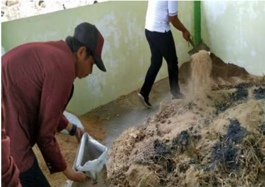
Gambar 12. Pencampuran bahan-bahan