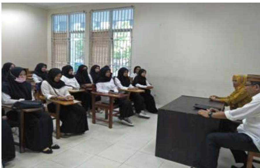
Gambar 2. Pembekalan (Coaching) Mahasiswa KKS Desa Bulalo

KKS Pengabdian ini diikuti oleh 30 orang mahasiswa berasal dari berbagai fakultas dan jurusan di Universitas Negeri Gorontalo. Pembekalan atau (coaching) diberikan kepada mahasiswa sebelum terjun ke lokasi dengan tujuan untuk memberikan wawasan kepada mahasiswa tentang mereka sebagai inovator dengan konsep working with community untuk membangun Desa. Pembekalan umum diberikan kepada mahasiswa meliputi peran dan tugas mahasiswa KKS, cara hidup bermasyarakat, sikap dan etika moral. Selanjutnya diberikan pembekalan khusus mengenai gambaran tentang program dan kegiatan yang akan dilaksanakan dan harus dicapai yang selanjutnya dapat dikembangkan sendiri oleh mahasiswa serta penyusunan program KKS Pengabdian.