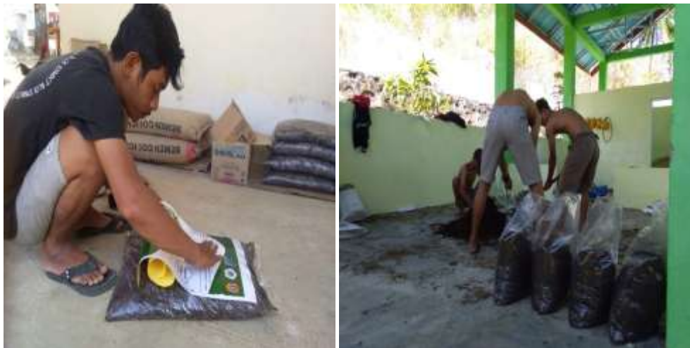
Gambar 16. Pengemasan pupuk organik dari limbah jagung

Pupuk organik yang telah jadi dikemas dalam kemasan 5 kg dan diberi label yang mencantumkan komposisi dan cara penggunaannya