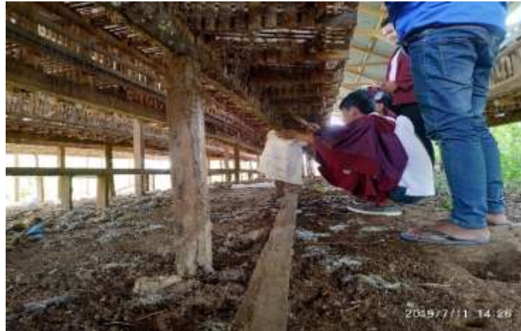
Gambar 7. Pengambilan kotoran ternak