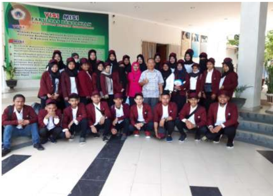
Gambar 3. Pengantaran mahasiswa KKS Pengabdian ke lokasi

Mahasiswa ditempatkan di Desa Bulalo dan diwajibkan tinggal di desa selama empat puluh lima hari berbaur dengan masyarakat, tokoh agama dan bekerjasama dengan masyarakat dan memberdayakan masyarakat khususnya target sasaran yaitu kelompok tani, ibu rumah tangga, remaja, pelajar dan anak-anak, karena mereka yang akan menjadi ujung tombak untuk keberlanjutan pembangunan di Desa Bulalo. Tempat Pelaksanaan KKS Pengabdian di Desa Bulalo meliputi delapan dusun yaitu Cisadane, Beringin Jaya, Beringin, Abati, Molamahu, Wapalo, Hulapa dan Hulapa Pantai.