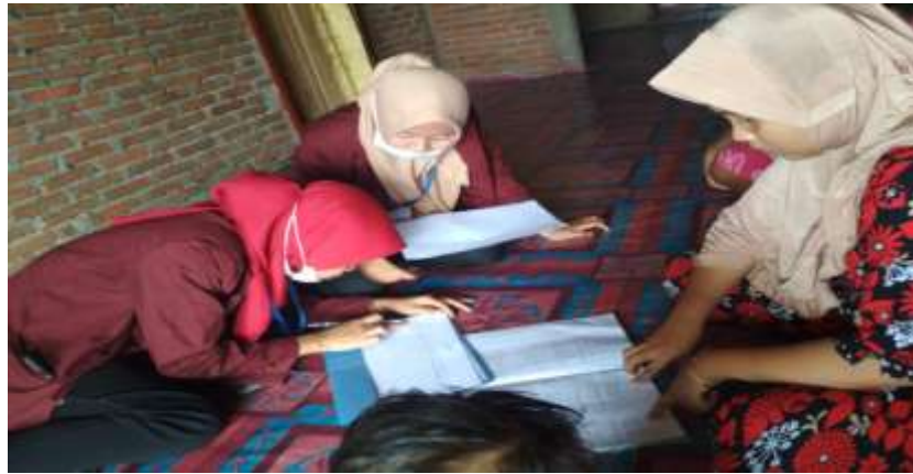
Gambar 19. Pendataan penduduk di desa Bulalo

Pendataan penduduk merupakan kegiatan tambahan bersama aparat Desa dengan tujuan untuk memvalidasi data agar diperoleh data riil dari lapangan. Kegiatan dilaksanakan pada tanggal 24 juli 2019 sampai dengan tanggal 27 juli 2019 pada 8 dusun yang ada di Desa Bulalo dengan bentuk kegiatan adalah pendataan di tiap-tiap rumah. Kegiatan ini dilaksanakan oleh Aparat desa Bulalo dibantu oleh mahasiswa KKS Pengabdian.