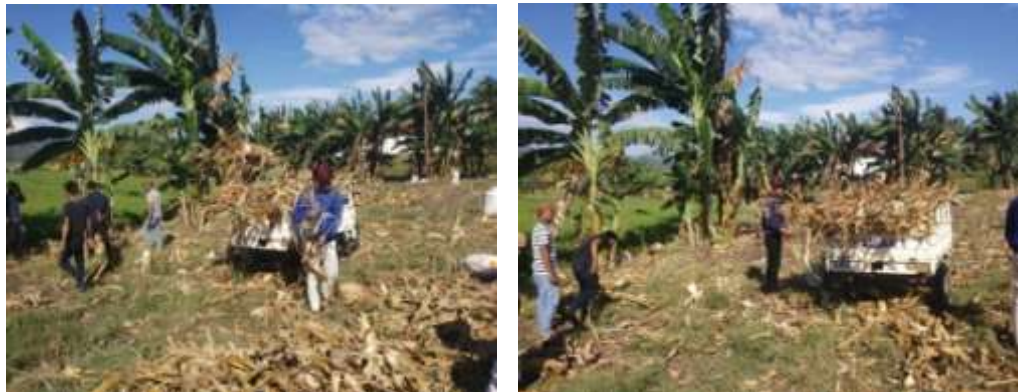
Gambar 4. Pengambilan limbah jagung