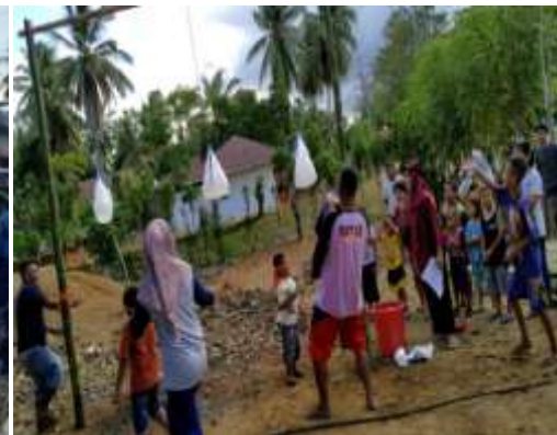
Gambar 22. Lomba pukul balon isi air