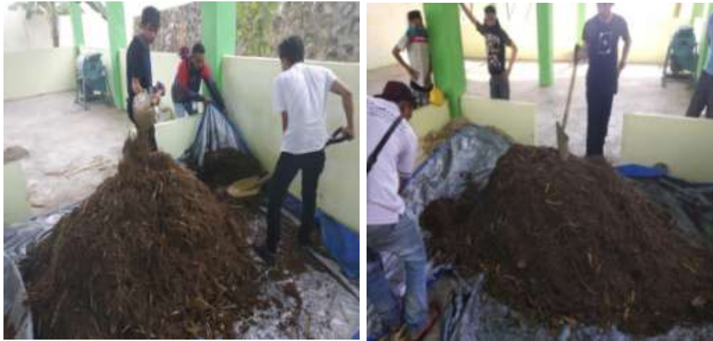
Gambar 15. Proses pengadukan