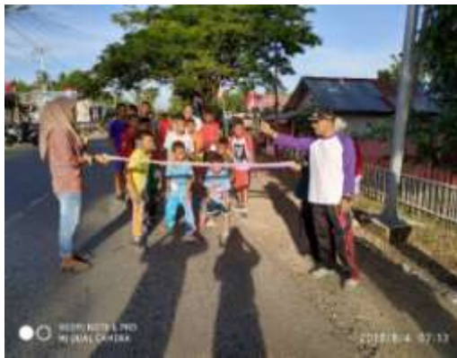
Gambar 24. Lomba lari marathon

Kegiatan olahraga dilakukan untuk memeriahkan acara dalam rangka Hari Kemerdekaan Republik Indonesia yang ke 74 tahun.