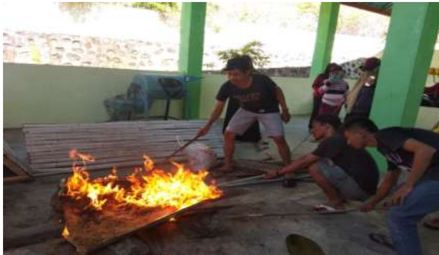
Gambar 9. Pembakaran sekam padi