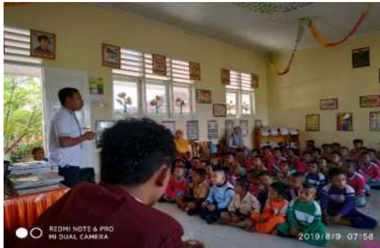
Gambar 18. Gerakan ayo perangi sampah plastik

Kegiatan gerakan ayo perangi sampah plastik yang dilakukan mahasiswa KKS Pengabdian berlangsung pada hari jumat tanggal 9 agustus 2019. Kegiatan ini dilakukan di Sekolah Dasar yang ada di desa Bulalo, yaitu SDN 19 Kwandang dan SDN 9 Kwandang. Bentuk kegiatan adalah mensosialisasikan tentang bahaya sampah plastik dan menghimbau untuk mengurangi penggunaan benda berbahan plastik agar jumlah sampah yang ada di desa Bulalo makin berkurang. Kegiatan ini diberikan kepada anak anak Sekolah Dasar untuk mengajarkan kepada mereka sejak dini untuk selalu menjaga kebersihan dan kelestarian lingkungan.