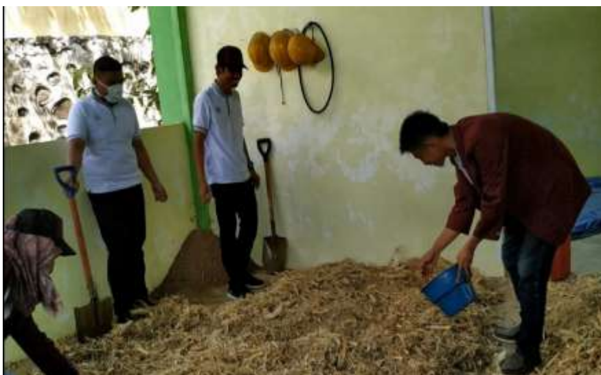
Gambar 13. Pemberian EM4

EM 4 berperan untuk mendekomposisi bahan dasar sehingga proses penguraian akan menjadi lebih cepat daripada proses yang terjadi secara alami.