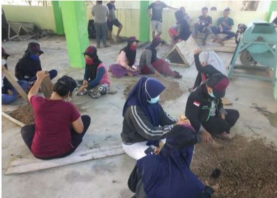
Gambar 10. Penghalusan kotoran ternak