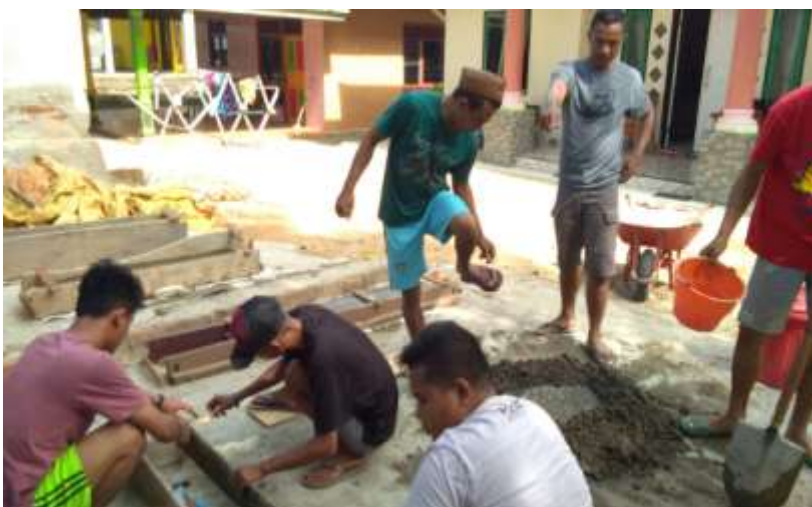
Gambar 20. Proses pembuatan batas dusun desa Bulalo