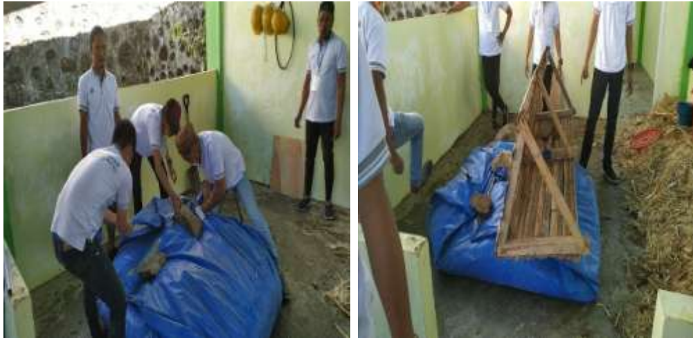
Gambar 14. Proses inkubasi