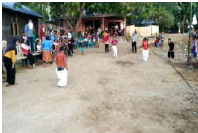
Gambar 23. Lomba lari karung