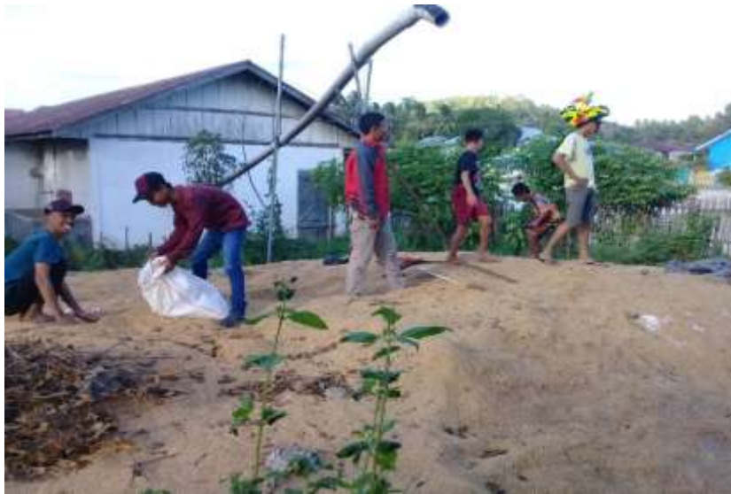
Gambar 5. Pengambilan sekam padi