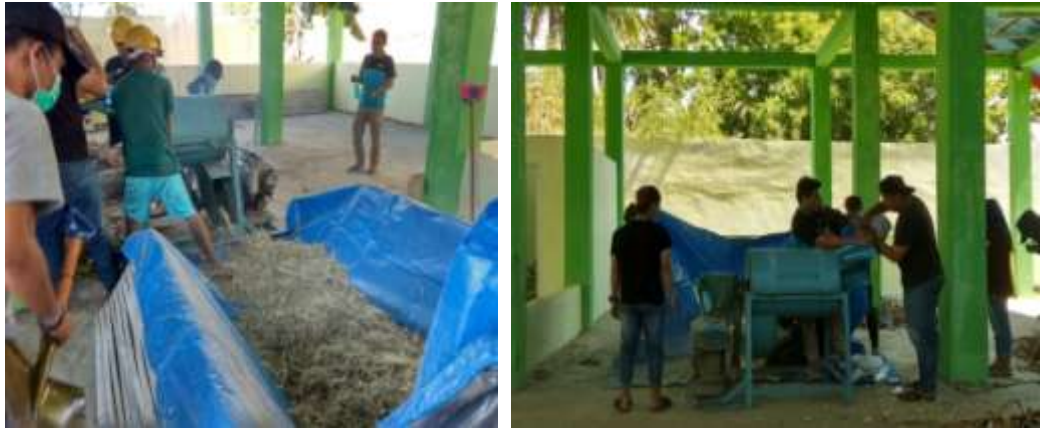
Gambar 8. Pencacahan limbah jagung