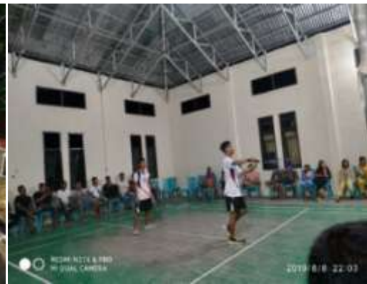
Gambar 25. Lomba bulutangkis

Kegiatan tambahan ini dilaksanakan oleh mahasiswa KKS dengan Karang taruna. Kegiatan ini terdiri dari dua cabang olahraga yaitu Bulu tangkis dan Lari marathon. Kegiatan ini dilaksanakan pada tanggal 4 Agustus 2019 di depan kantor Desa Bulalo yang dibuka langsung dengan Lomba lari Maraton dan dilanjutkan pembukaan kegiatan Bulutangkis Tanggal 6 Agustus 2019. Kegiatan ini bertujuan untuk memperingati HUT RI ke-74.