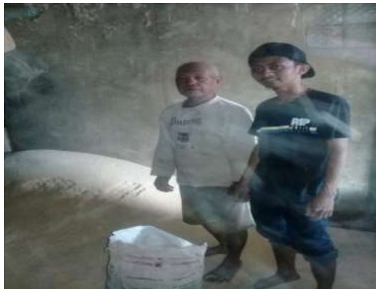
Gambar 6. Pengambilan dedak