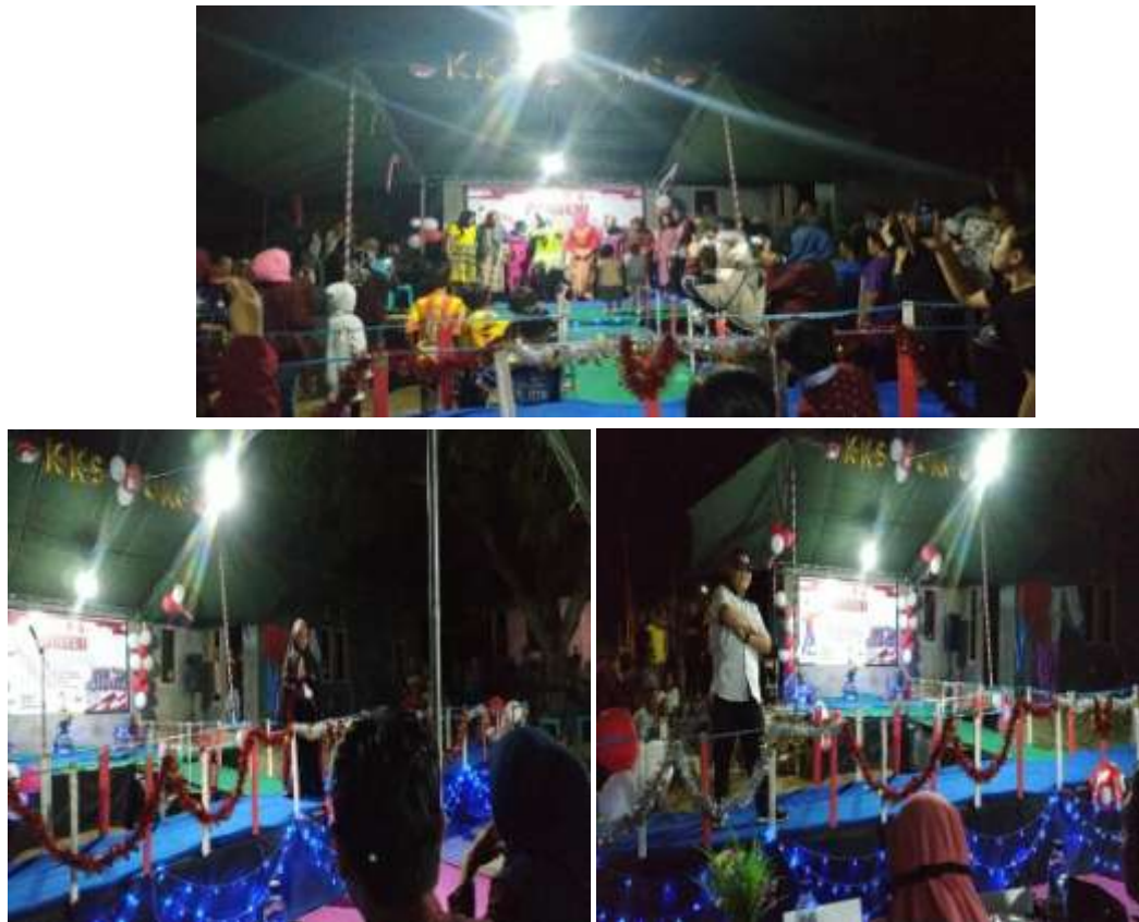
Gambar 26. Lomba kesenian

Kegiatan kesenian merupakan kegiatan yang dilakukan oleh mahasiswa KKS dengan Karangtaruna Desa Bulalo. Kegiatan ini terdiri dari kegiatan Busana muslim dan Kontes Kacamata yang dilaksanakan pada tanggal 19 Agustus 2019. Kegiatan ini bertujuan untuk mempererat tali silaturahmi, kebersamaan mahasiswa KKS dengan Masyarakat desa Bulalo.