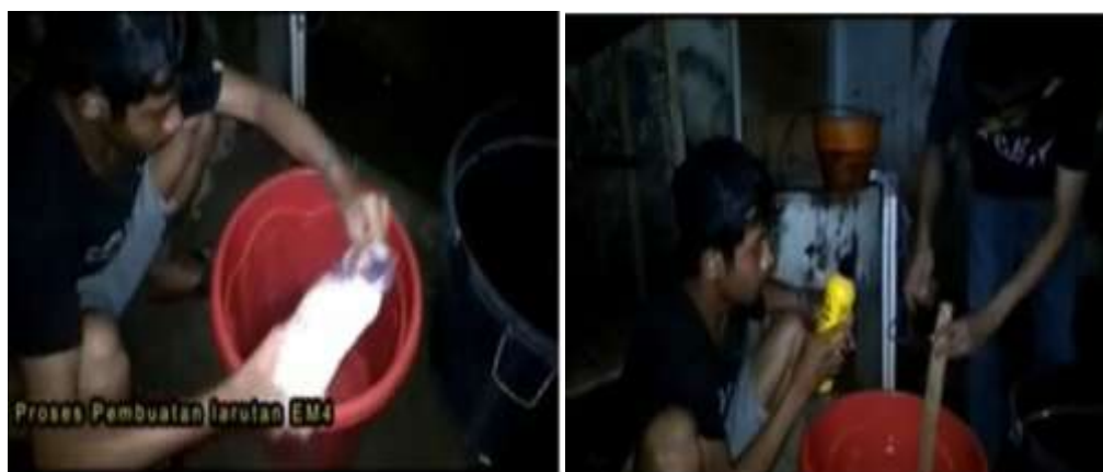
Gambar 11. Pencampuran gula pasir, EM4 dan air