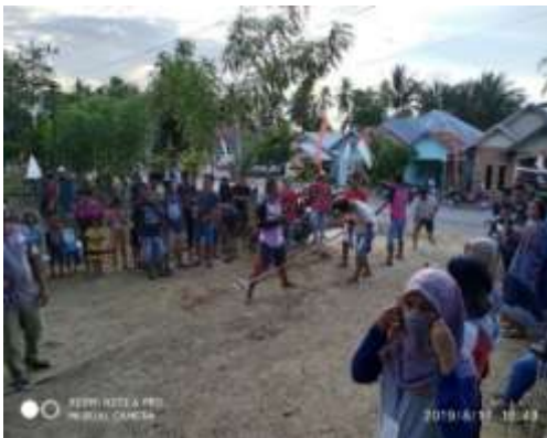
Gambar 21. Lomba tarik tambang