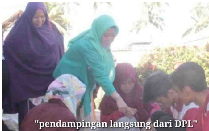
Gambar 5.15. DPL Memberikan Arahan dan Petunjuk Proses Pembuatan Pot Bunga

Pelatihan yang dilaksanakan Mahasiswa KKS Desa Manunggu didukung oleh masyarakat, ditandai dengan peran aktif dari Karang Taruna, mulai dari perencanaan sampai dengan pelaksanaan kegiatan pelatihan. Kegiatan pelatihan dihadiri oleh ketua Karang Taruna yang memberikan tanggapan bahwa pelatihan pembuatan pot bunga dari limbah sabut kelapa dapat dijadikan salah satu program kegiatan BUMDES Desa Manunggu.