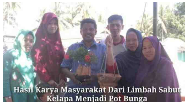
Gambar 5.18. Hasil Karya Masyarakat Hasil dari Pelatihan

Setelah pelatihan selesai, kelompok kerja masyarakat masing-masing memperlihatkan hasil karyanya. DPL didampingi oleh Mahasiswa KKS yang bertugas pada kelompok kerja masyarakat yang mengikuti pelatihan memberikan arahan masukan atas produk yang sudah dibuat.