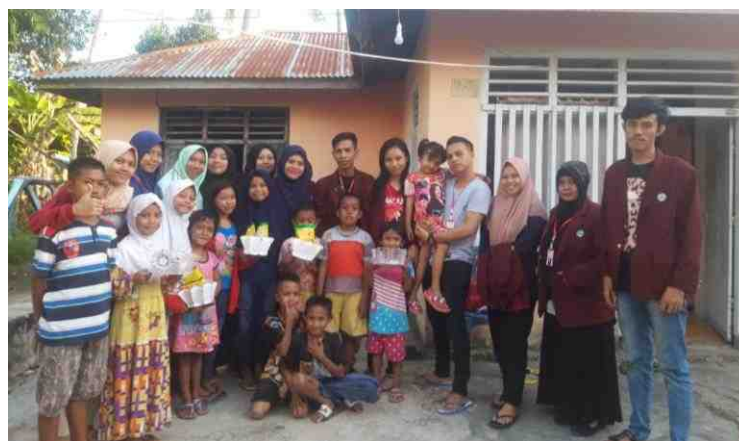
Gambar 5.29. Hasil Karya Seni dari Limbah Botol Plastik

Kegiatan tambahan terkait dengan Bank Sampah juga dilakukan oleh Mahasiswa KKS Desa Mananggu. Bentuk kegiatannya adalah mengajak anak-anak yang ada di Desa Mananggu bermain sambil mengumpulkan limbah botol plastik sekitar pemukiman masyarakat. Limbah botol-botol plastik tersebut dibersihkan lalu disiapkan menjadi bahan membuat karya seni. Anak-anak dibekali mengenai langkah-langkah penciptaan karya seni dari botol plastik. Kegiatan tersebut dilaksanakan secara santai di halaman Posko Induk Mahasiswa KKS.