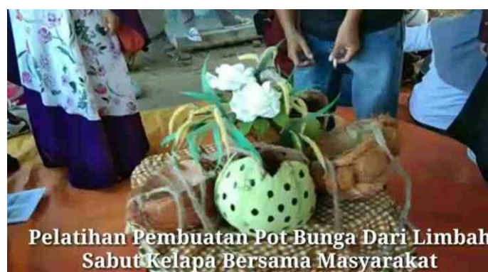
Gambar 5.19. Hasil Karya Masyarakat Hasil dari Pelatihan