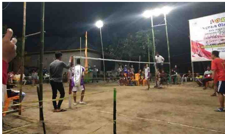
Gambar 5.27. Lomba Sepak Takrow Dalam Rangka Menyambut Hari Kemerdekaan RI

Kegiatan Porseni ikut menjadi kegiatan tambahan mahasiswa KKS di Desa Mananggu. Kegiatan Porseni dilaksanakan dalam rangka menyambut hari Kemerdekaan RI. Bentuk kegiatan yang dilaksanakan adalah Sepak Takrow, Dakwah Tingkat Anak Sekolah Dasar, Peragaan Busana Muslim Anak, dan Komedi. Lomba sepak Takrow diikuti oleh pemuda Karang Taruna dan Mahasiswa KKS.