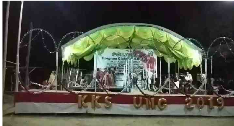
Gambar 5.28. Panggung Peragaan Busana Muslim Dalam Kegiatan Porseni