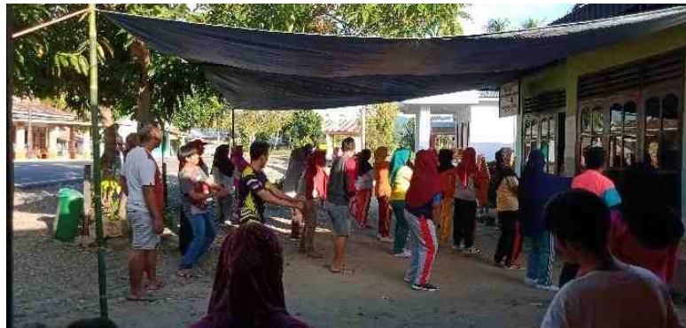
Gambar 5.31. Senam Sehat Masyarakat Desa Manunggu di Halaman Kantor Desa Manunggu

yang tidak senam untuk bersama-sama senam sehat dengan memberikan pemahaman pentingnya bagi kesehatan.