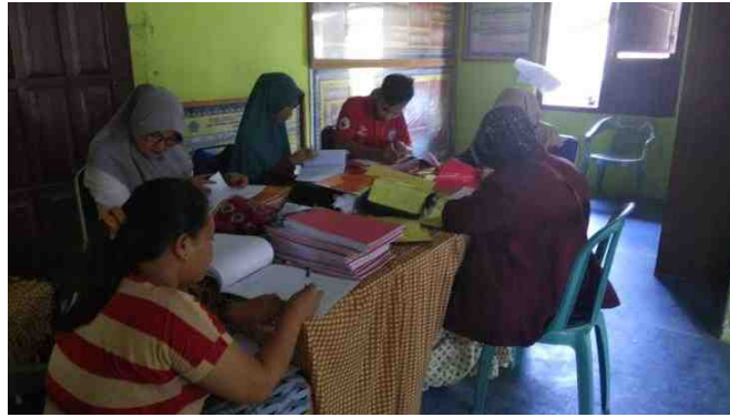
Gambar 5.33. Kegiatan Rutin Mahasiswa KKS di Kantor Desa