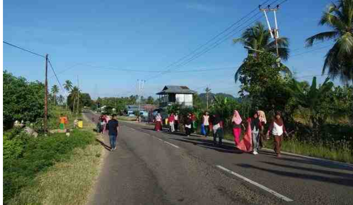
Gambar 5.30. Mahasiswa KKS Desa Mananggu Bersama-sama Mengumpulkan Sampah Di Perbatasan Boalemo – Pohuwato

Kegiatan bakti sosial dilaksanakan dengan berjalan sepanjang jalan Perbatasan Boalemo – Pohuwato sambil memungut sampah yang ada di jalanan dan sekitarnya. Kegiatan tersebut dilaksanakan bersama dengan Mahasiswa KKS SeKecamatan Mananggu.