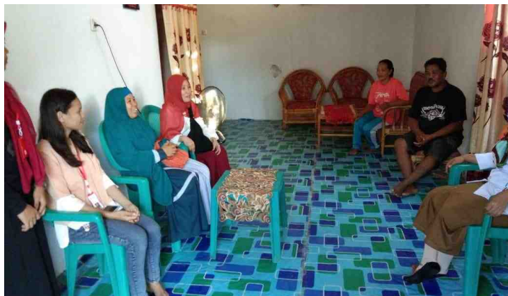
Gambar 5.5. Dosen Pendamping Lapangan Mengantarkan Mahasiswa KKS Ke Posko Yang Sudah Ditentukan

Selanjutnya sekretaris desa membagi Posko Mahasiswa KKS menjadi 7 Posko, terdiri dari 6 Posko perempuan dan 1 Posko laki-laki. Tujuh posko yang ditunjuk berada disepertaran kantor Desa Mananggu yang terdiri dari tiga dusun. Sebelum DPL meninggalkan lokasi KKS, mahasiswa diantar ke Posko masing-masing yang diterima langsung oleh tuan rumah.