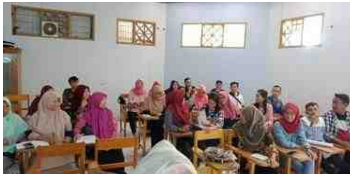
Gambar 5.2. Mahasiswa KKS Membentuk Tim Kerja

Sekretaris, Bendahara, dan Seksi Dokumentasi. Tim kerja masing-masing kelompok dibentuk lagi setelah tiba di lokasi berdasarkan kesepakatan bersama.