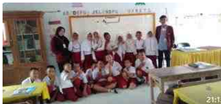
Gambar 5.25. Foto Bersama Mahasiswa KKS dan Siswa Sekolah Dasar Setelah Kegiatan Sosialisasi Selesai

Mahasiswa KKS Desa Manunggu membagi kelompok sebelum ke Sekolah-sekolah untuk sosialisasi. Setiap kelas dibentuk empat orang mahasiswa yang melaksanakan sosialisasi, sehingga waktu yang digunakan menjadi efisien.