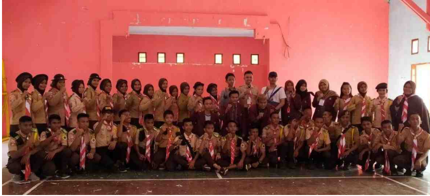
Gambar 5.26. Sosialisasi Bank Sampah Kepada Adik-Adik pramuka Tingkat SMP dan SMA di Kecamatan Mananggu