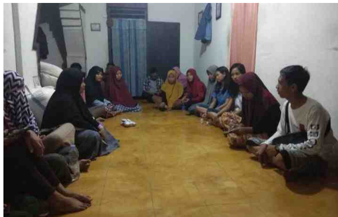
Gambar 5.11. Rapat Persiapan Kegiatan Pelatihan

Desa Manangu sebagai salah satu Desa menjadi lokasi KKS Pengabdian Universitas Negeri Gorontalo Tahun 2019 termasuk desa swasembada (Kecamatan Manangu dalam Angka, 2017). Berdasarkan hal tersebut, perlu adanya peran lembaga pendidikan, termasuk Universitas Negeri Gorontalo untuk menumbuhkan jiwa kreatifitas masyarakatnya untuk memafaatkan benda disekitarnya menjadi lebih bermanfaat dan berilai ekonomi. Bentuk kegiatan inti yang dilakukan oleh mahasiswa KKS Desa Manangu adalah Pelatihan Upcycle Pot Bunga Sebagai Pemanfaatan Limbah Sabut Kelapa. Harapan dari mahasiswa KKS UNG Desa Manangu adalah melalui kegiatan ini, masyarakat jadi terdorong untuk menjadikan kegiatan tambahan yang bernilai seni dan bernilai jual.