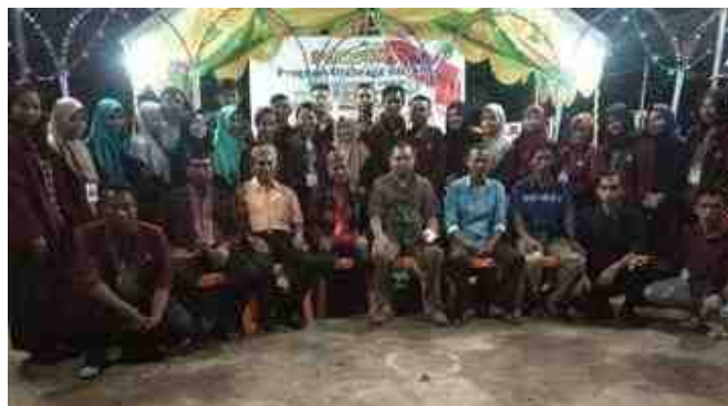
Gambar 5.37. Penutupan Porseni Mahasiswa KKS dirangkaiakan dengan Perpisahan Mahasiswa KKS dengan Masyarakat Desa Mananggu

Akhir dari kegiatan Mahasiswa KKS Desa Mananggu adalah melaksanakan Penutupan Porseni yang dirangkaiakan dengan Perpoisahan antara masyarakat Desa dan Mahasiswa KKS. Kegiatan penutupan porseni yang dirangkaiakan dengan perpisahan mahasiwa KKS dihadiri oleh Camat Mananggu, Kepala Desa Mananggu, Karang Taruna, dan masyarakat Mananggu pada umumnya.