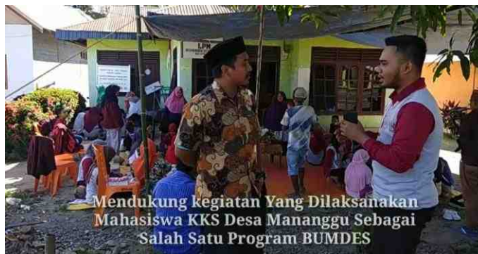
Gambar 5.16. Wawancara Oleh Mahasiswa KKS Kepada Ketua Karang Taruna Desa Manunggu

Pelatihan yang dilaksanakan Mahasiswa KKS Desa Manunggu didukung oleh masyarakat, ditandai dengan peran aktif dari Karang Taruna, mulai dari perencanaan sampai dengan pelaksanaan kegiatan pelatihan. Kegiatan pelatihan dihadiri oleh ketua Karang Taruna yang memberikan tanggapan bahwa pelatihan pembuatan pot bunga dari limbah sabut kelapa dapat dijadikan salah satu program kegiatan BUMDES Desa Manunggu.