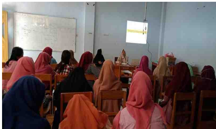
Gambar 5.1. Materi Pelatihan Upcycle Limbah Sabut Kelapa Menjadi Pot Bunga disampaikan Oleh DPL

Mahasiswa KKS yang akan berangkat ke lokasi KKS diberikan pembekalan. Pembekalan yang didampingi oleh Dosen Pendamping Lapangan dilaksanakan pada tanggal 06 Juli 2019 bertempat di Lab Pendidikan Seni Rupa, Fakultas Teknik, Universitas Negeri Gorontalo dimulai Jam 08.00-11.30. Pembekalan bermaksud untuk memberikan pemahaman dasar berdasarkan tema KKS Bank Sampah di Boalemo dan tentang kegiatan pelatihan inti di lokasi. Tentang Bank Sampah tujuannya mengajak masyarakat membentuk dan mengelolah Bank Sampah dan bagaimana memanfaatkannya, sedangkan tema kegiatan inti terkait dengan pemanfaatan limbah sabut kelapa menjadi produk yang bernilai seni dan ekonomi.