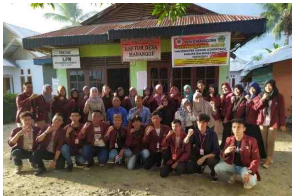
Gambar 5.23. Sosialisasi Bank Sampah di Desa Mananggu

Pada hari yang sama Mahasiswa KKS Desa Mananggu melanjutkan kegiatan sosialisasi Bank Sampah di Kantor Desa Mananggu. Kegiatan tersebut dihadiri oleh masyarakat desa, mahasiswa KKS Desa Mananggu, dan pihak dari BPBD Boalemo. Kegiatan yang dilaksanakan pada sore hari diakhiri dengan foto bersama di halaman kantor Desa Mananggu.