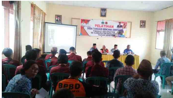
Gambar 5.22. Sosialisasi Bank Sampah SeKecamatan Mananggu dihadiri oleh Perwakilan Mahasiswa KKS Desa Mananggu

Sosialisai Bank Sampah Se-Kecamatan Mananggu dilaksanakan di kantor Kecamatan Mananggu. Mahasiswa KKS dari Desa Mananggu mengirimkan perwakilannya dalam mengikuti kegiatan tersebut. Kegiatan dilaksanakan pada tanggal 17 juli 2019.