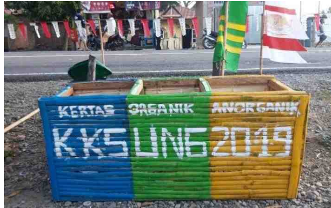
Gambar 5.10. Tempat Sampah Sebagai Bentuk Sosialisasi Dalam Memilah Sampah