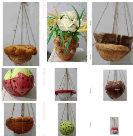
Gambar 5.21. Pot Bunga Dari Limbah Sabut Kelapa

Kepala Desa Manangu dan Pemuda Karang Taruna berharap jika nantinya pelatihan pot bunga dari limbah sabut kelapa ini menjadi program Desa, maka besar harapan masyarakat agar akademisi dari Universitas Negeri Gorontalo dapat mendampingi kembali.