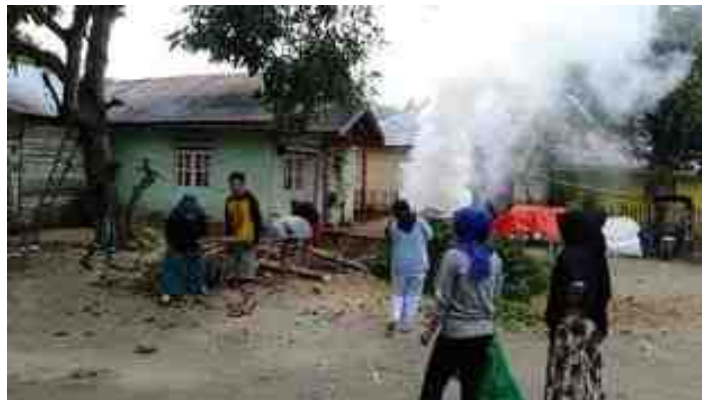
Gambar 5.32. Mahasiswa KKS Melaksanakan Bakti Sosial Bersama Masyarakat

Setelah kegiatan senam sehat dilaksanakan, dilanjutkan dengan membersihkan lingkungan sekitar kantor Desa Manunggu dan pekarangan rumah masing-masing warga. Kegiatan rutin tersebut menyadarkan masyarakat pentingnya menjaga kesehatan tubuh dan kebersihan lingkungan.