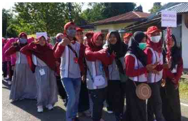
Gambar 5.35. Kegiatan Pawai Antar Sekolah, Ibu Dasawisma, dan Mahasiswa KKS Se-Kecamatan Mananggu

Keterlibatan mahasiswa KKS di Kegiatan Desa tidak hanya pada kegiatan yang dilaksanakan dalam Kantor Desa tetapi juga terlibat dalam kegiatan Kecamatan yang melibatkan perwakilan dari Desa. Salah satu contohnya kegiatannya adalah pawai Se-Kecamatan Mananggu diikuti oleh mahasiswa KKS bersama dengan anak sekolah dan Ibu Dasawisma dari Desa Mananggu.