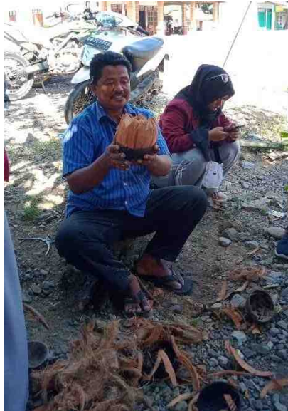
Gambar 5.17. Keterlibatan Laki-Laki dalam Kegiatan Pelatihan

Setelah pelatihan selesai, kelompok kerja masyarakat masing-masing memperlihatkan hasil karyanya. DPL didampingi oleh Mahasiswa KKS yang bertugas pada kelompok kerja masyarakat yang mengikuti pelatihan memberikan arahan masukan atas produk yang sudah dibuat.