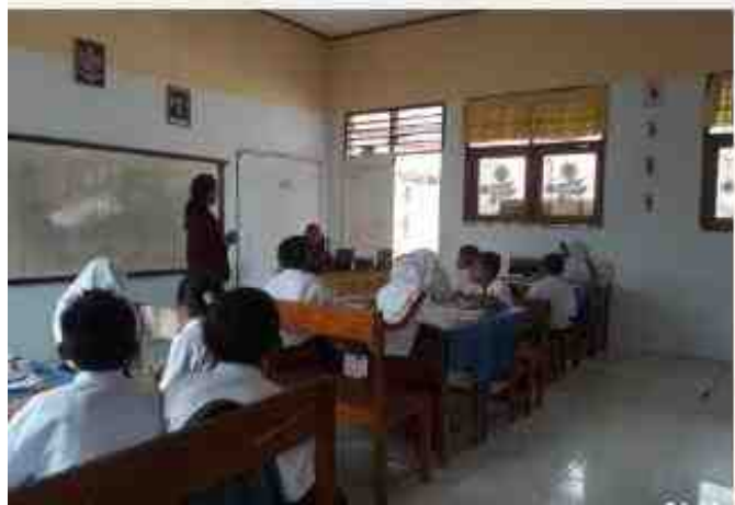
Gambar 5.24. Sosialisasi Bank Sampah di Sekolah Dasar Desa Manunggu

Kegiatan sosialisasi merupakan salah satu kegiatan tambahan Mahasiswa KKS Desa Manunggu dengan mengadakan sosialisasi Bank Sampah kepada anak sekolah, baik ditingkat Sekolah Dasar, SMP, dan SMA. Bagi tingkat sekolah dasar sosialisasi Bank Sampah diadakan di SD yang ada di Desa Manunggu.