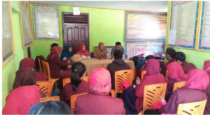
Gambar 5.4. Mahasiswa KKS Desa Mananggu diterima langsung oleh Kepala Desa Mananggu

Mahasiswa KKS tiba di lokasi Kantor Kecamatan Mananggu, kemudian dilanjutkan penerimaan di Kantor Desa Mananggu. Mahasiswa KKS berjumlah 29 orang diterima di Kantor Desa yang disambut oleh Kepala Desa dan aparatnya. Kepala Desa memberikan sambutan dengan harapan mahasiswa KKS bisa bekerja sama dengan masyarakat setempat dan Karang Taruna Desa Mananggu dalam mensukseskan program KKS Bank Sampah di Kabupaten Boalemo pada umumnya, khususnya di Desa Mananggu.