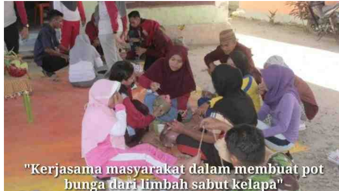
Gambar 5.13. Mahasiswa KKS Mendampingi Masyarakat Dalam Kegiatan Pelatihan Secara Berkelompok

Kerja secara kelompok yang dirancang oleh mahasiswa KKS menjadikan kegiatan lebih dapat dikontrol oleh dua instruktur yang didatangkan dari kota Gorontalo. Instruktur mendatangi kelompok-kelompok masyarakat yang sedang membuat pot bunga. Peranan instruktur sangat penting karena bisa memberikan ide-ide kreasi pot bunga yang dibuat masyarakat. Nilai estetika suatu produk khususnya pot bunga dapat tercipta dari lekapan atau hiasan yang ditempatkan dari bentuk dasar pot tersebut.