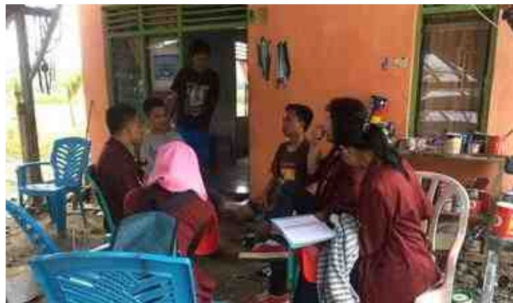
Gambar 5.7. Mahasiswa KKS Survei Awal ke Masyarakat

Kegiatan awal mahasiswa KKS adalah survei ke tiga dusun yang ada di Desa Mananggu. Bentuk kegiatannya silaturahmi dengan mendatangi langsung ke rumah-rumah warga, membicarakan terkait bentuk kegiatan masyarakat sehari-hari. Kegiatan survei tersebut memberi informasi pada mahasiswa KKS terkait dengan rencana program kegiatannya. Melalui survei itu juga mahasiswa sekaligus mensosialisasikan bentuk kegiatan yang akan dilakukan, yaitu pengelolaan Bank Sampah dan pelatihan keterampilan pembuatan Pot Bunga dari limbah sabut kelapa.