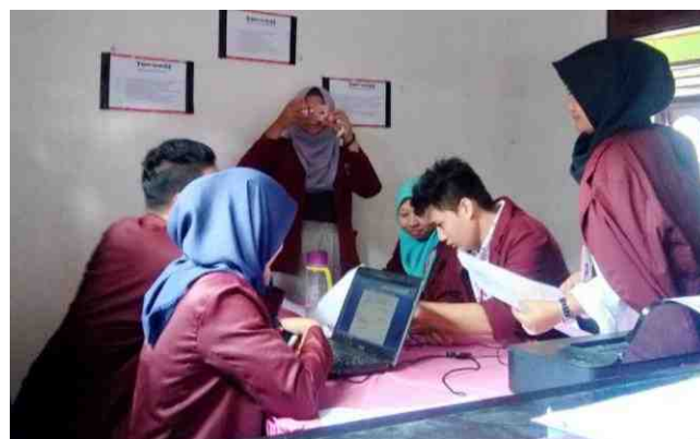
Gambar 5.34. Membuat Dokumen Desa Dalam Bentuk File

Keterlibatan mahasiswa KKS di Kegiatan Desa tidak hanya pada kegiatan yang dilaksanakan dalam Kantor Desa tetapi juga terlibat dalam kegiatan Kecamatan yang melibatkan perwakilan dari Desa. Salah satu contohnya kegiatannya adalah pawai Se-Kecamatan Mananggu diikuti oleh mahasiswa KKS bersama dengan anak sekolah dan Ibu Dasawisma dari Desa Mananggu.