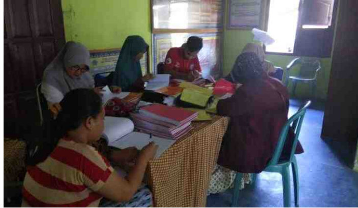
Gambar 5.12. Data Peserta Pelatihan diperoleh dari Data Masyarakat yang ada di Kantor Desa

Langkah awal pelaksanaan kegiatan pelatihan dimulai dari mendata peserta pelatihan. Peserta yang didata berjumlah 20 orang terdiri dari masyarakat produktif baik golongan remaja, ibu rumah tangga, pemuda ataupun kepala rumahtangga. Pemuda atau kepala rumah tangga diperlukan karena dalam membuat pot bunga, ada langkah-langkah kerja yang membutuhkan tenaga yang kuat.