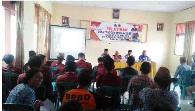
Gambar 5.8. Pelatihan Desa Tangguh Bencana (DESTANA) Tingkat Kecamatan Se-Kabupaten Boalemo

Tindak lanjut pertemuan di Kantor Kecamatan, dilanjutkan sosialisasinya di Desa Mananggu. Desa Mananggu melaksanakan sosialisasi Bank Sampah di Kantor Desa Mananggu tanggal 17 Juli 2019, dihadiri oleh BPBD Boalemo, pemerintah setempat, dan masyarakat Desa Mananggu. Salah satu hasil dari kegiatan yang dilaksanakan adalah terbentuknya Relawan Bank Sampah Desa Mananggu, ditandai dengan Surat Keputusan No. 01 Tahun 2019 ditetapkan pada tanggal 17 Juli 2019 Jumlah Pengurus 3 orang dan anggota 11 orang (SK terlampir).