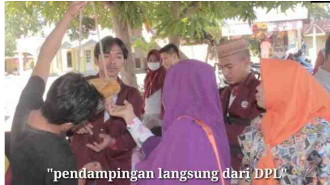
Gambar 5.20. Peserta Pelatihan Memperlihatkan Karyanya Kepada DPL, Instruktur, dan Mahasiswa KKS