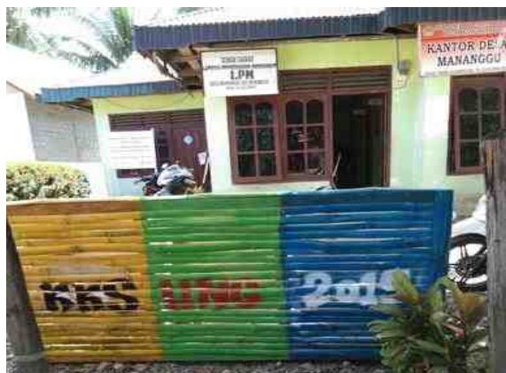
Gambar 5.9. Tempat Sampah sebagai upaya menjaga kebersihan lingkungan

Setelah relawan Bank Sampah terbentuk, dilanjutkan dengan diskusi terarah tentang kesiapan lokasi Bank Sampah. Masyarakat Desa Mananggu mengalami kesulitan dalam menentukan lokasi penampungan sampah karena posisi Desa Mananggu dikelilingi pemukiman masyarakat dan belum adanya lokasi yang tersedia. Namun mahasiswa KKS tetap melaksanakan program kerja Bank Sampah dengan beberapa bentuk kegiatan seperti pembuatan tempat sampah umum yang ditempatkan di depan Kantor Desa Mananggu.