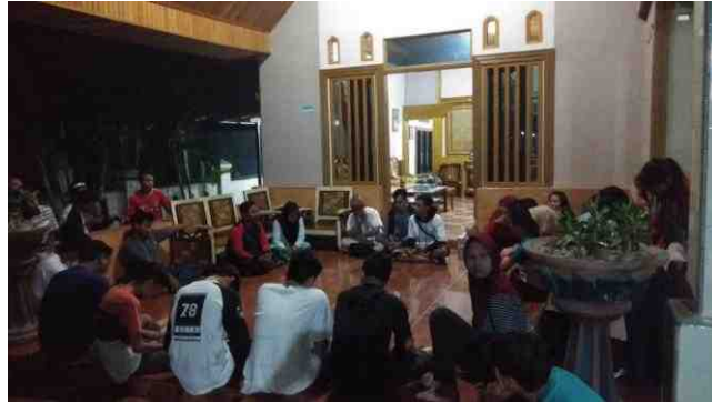
Gambar 36. Mahasiswa KKS Rapat Bersama Pemuda Karang Taruna di salah satu Posko Mahasiswa KKS

Kegiatan Mahasiswa KKS sangat didukung oleh Karang Taruna Desa Mananggu. Segala bentuk kegiatan Mahasiswa KKS di lokasi terus dikoordinasikan dengan Karang taruna Desa Mananggu. Pada waktu-waktu tertentu, Mahasiswa KKS Desa Mananggu melibatkan pemuda Karang Taruna dalam mendiskusikan kegiatan yang akan dilaksanakan. Peran serta pemuda Karang Taruna sangat membantu Mahasiwa KKS dalam melaksanakan kegiatannya di lokasi.