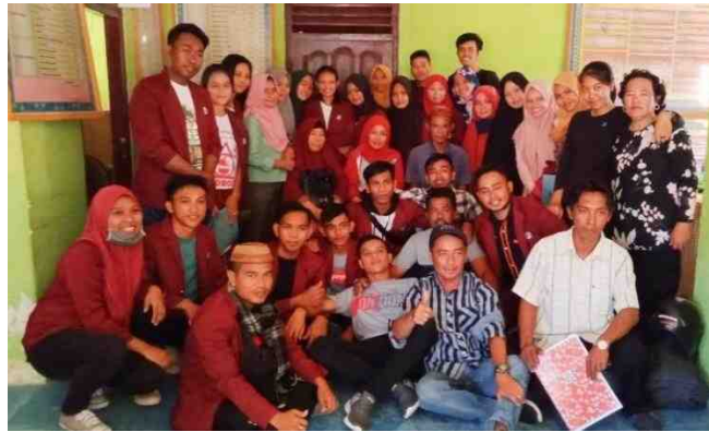
Gambar 5.38. Foto Bersama Kepala Desa Mananggu dan Masyarakat Sebelum Meninggalkan Lokasi KKS

wita bertempat di Kantor Desa Mananggu. Ucapan terima kasih kepada Ayahanda Desa Mananggu dan masyarakat Desa Mananggu yang hadir saat itu, disampaikan langsung oleh DPL saat penarikan Mahasiswa KKS. Ayahanda Desa Mananggu juga menyampaikan terima kasih kembali kepada Mahasiswa KKS dan pihak Universitas Negeri Gorontalo yang diwakili oleh DPL atas pelaksanaan kegiatan Mahasiswa KKS dengan baik dan memberi manfaat bagi masyarakat Desa.