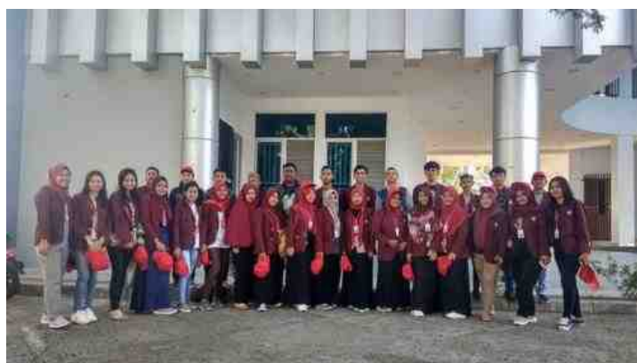
Gambar 5.3. Mahasiswa KKS Desa Mananggu sebelum Pemberangkatan ke Lokasi

Pembekalan diakhiri dengan tanya jawab terkait dengan rencana kegiatan di lokasi KKS. Terkait dengan kegiatan Inti yang akan dilaksanakan, sedikit mengalami kesulitan dalam memberikan pemahaman mengenai keterampilan pelatihan. Kendala tersebut salah satunya karena tidak adanya Mahasiswa Seni Rupa yang ditempatkan di lokasi KKS, sedangkan kegiatan inti terkait dengan Seni Keterampilan sesuai dengan Disiplin Ilmu Ketua Tim Dosen Pendamping Lapangan. Setelah berdiskusi dan menerima arahan secara detail mengenai kegiatan pelatihan, maka ditemukan solusi oleh DPL dengan memberikan pendampingan lanjut melalui media komunikasi WhatsApp.