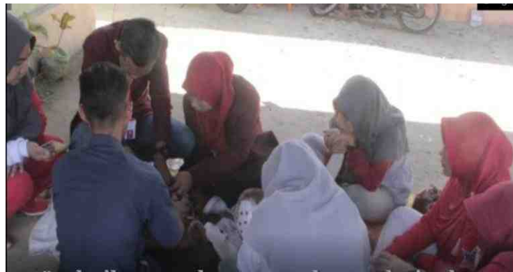
Gambar 5.14. Instruktur Mendampingi Masyarakat Dalam Kegiatan Pelatihan

Kerja secara kelompok yang dirancang oleh mahasiswa KKS menjadikan kegiatan lebih dapat dikontrol oleh dua instruktur yang didatangkan dari kota Gorontalo. Instruktur mendatangi kelompok-kelompok masyarakat yang sedang membuat pot bunga. Peranan instruktur sangat penting karena bisa memberikan ide-ide kreasi pot bunga yang dibuat masyarakat. Nilai estetika suatu produk khususnya pot bunga dapat tercipta dari lekapan atau hiasan yang ditempatkan dari bentuk dasar pot tersebut.