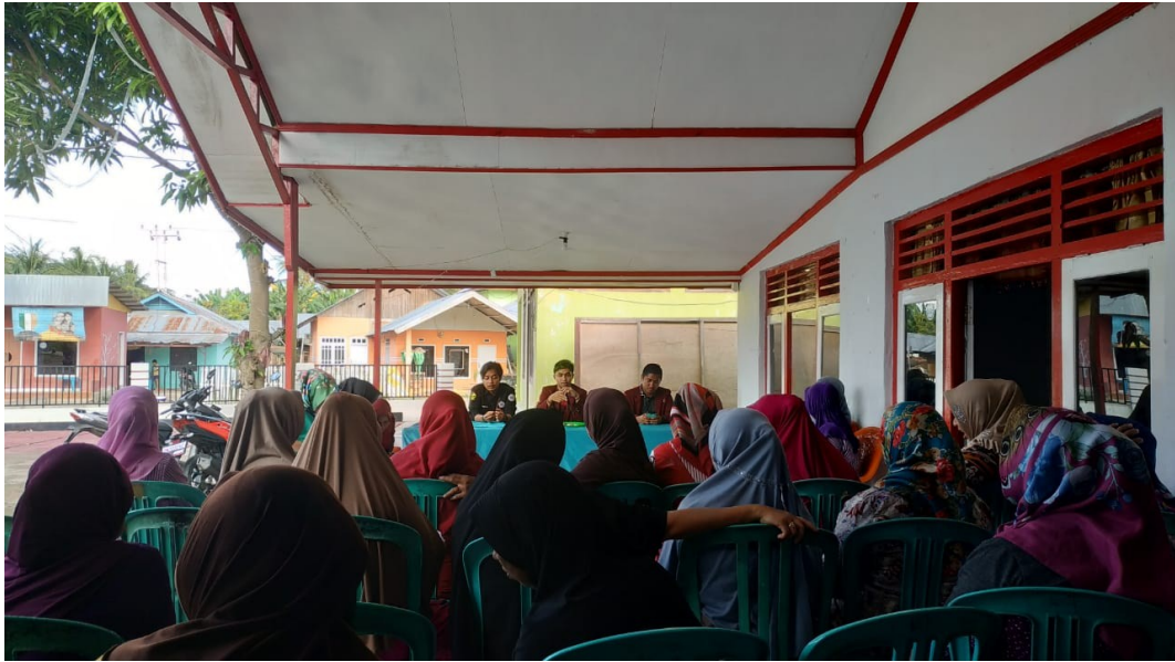
Gambar 1. Pemaparan Program Pengabdian Kepada Masyarakat

Pemaparan program ini dilaksanakan oleh mahasiswa KKS Pengabdian guna memberikan gambaran dan pemahaman tentang beberapa kegiatan inti yang akan dilaksanakan dalam pengabdian masyarakat ini.