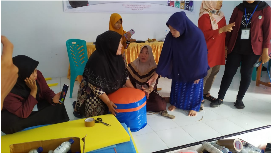
Gambar 5. Hasil Akhir Pembuatan Kursi Sofa dari Botol Plastik Bekas