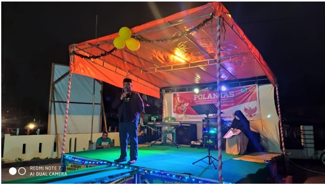
Gambar 10. Pembukaan Pekan Olah Raga dan Pentas Seni (POLANTAS) oleh Kepala Desa

Sementara kegiatan lain yang telah dilaksanakan oleh mahasiswa KKS adalah membersihkan kantor Desa Modelomo.