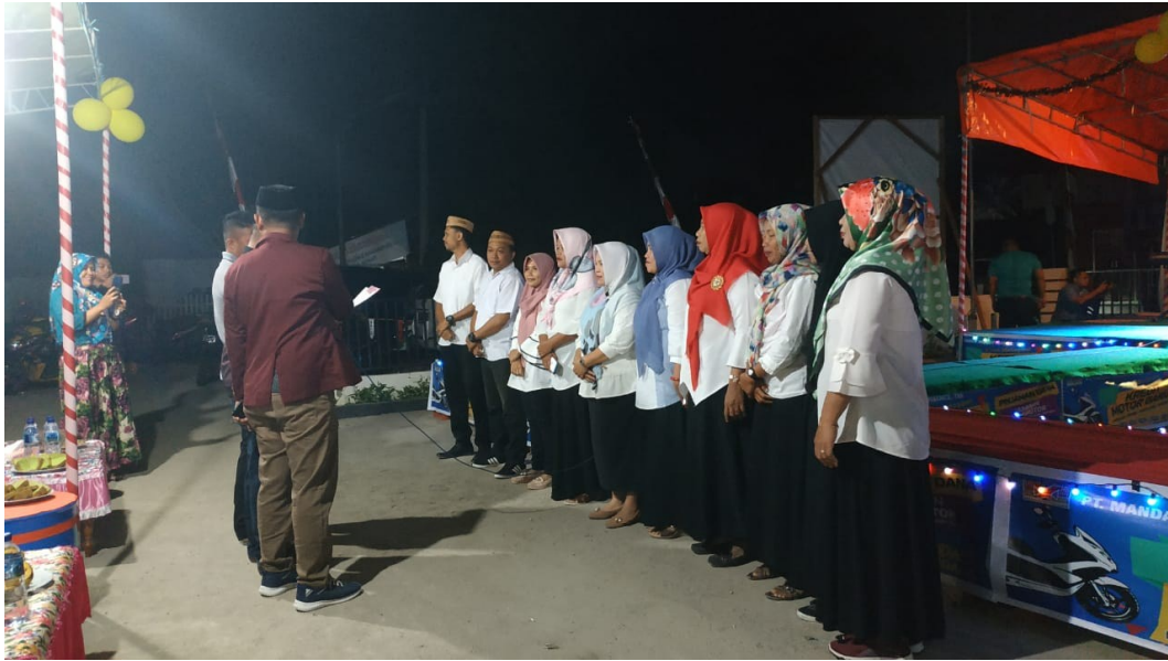
Gambar 8. Pelantikan Kepengurusan Relawan Tempat Pembuangan Sampah Sementara (TPS)