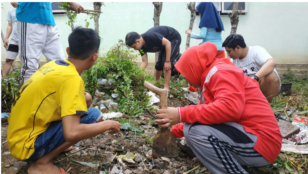
Gambar 11. Pembersihan Kantor Desa Modelomo Oleh Mahasiswa

Sementara kegiatan lain yang telah dilaksanakan oleh mahasiswa KKS adalah membersihkan kantor Desa Modelomo.