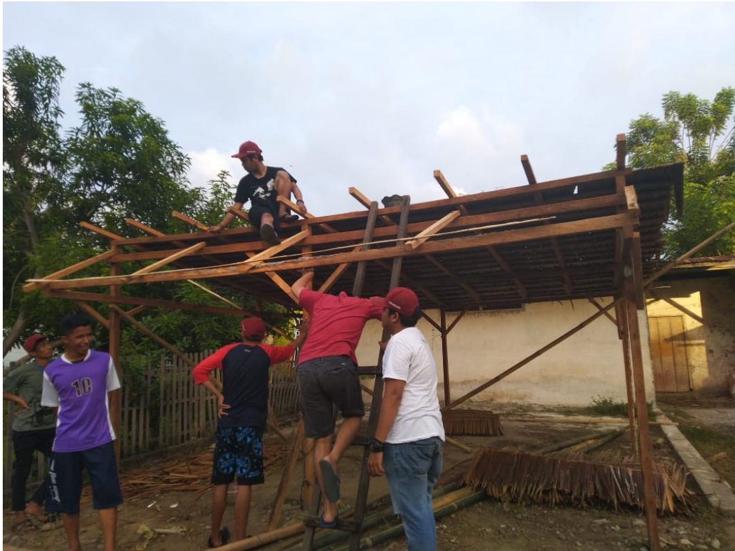
Gambar 7. Proses Pembangunan Tempat Pembuangan Sampah Sementara (TPS)

Untuk pengelolaannya sudah ditetapkan beberapa orang sebagai relawan pengurus tempat pembuangan sampah sementara (TPS) yang bertanggung jawab dalam pengoperasiannya telah dibuatkan surat keputusan pada tahun 2019 oleh Kepala Desa.