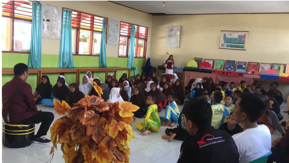
Gambar 6. Sosialisasi di Sekolah-Sekolah yang ada di Desa Modelomo