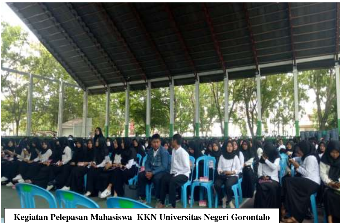
Kegiatan Pelepasan Mahasiswa KKN Universitas Negeri Gorontalo