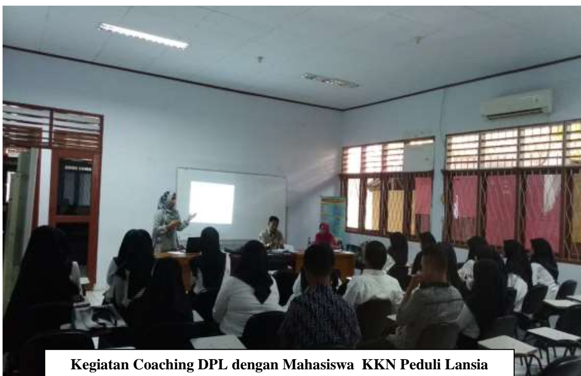
Kegiatan Coaching DPL dengan Mahasiswa KKN Peduli Lansia