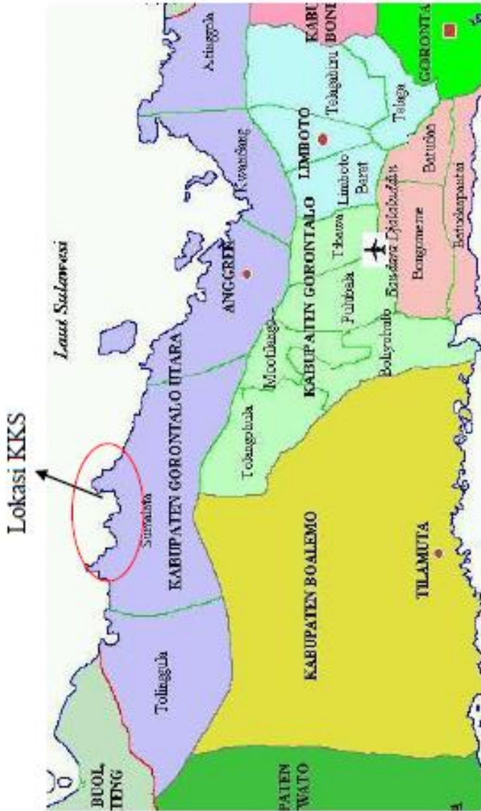
Lampiran 1. Peta Lokasi Pelaksanaan Program KKS Pengabdian