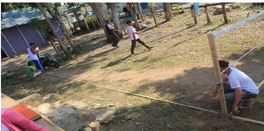
Gambar 5.5. Gambar kegiatan pembuatan panggung kesenian dan lapangan takraw