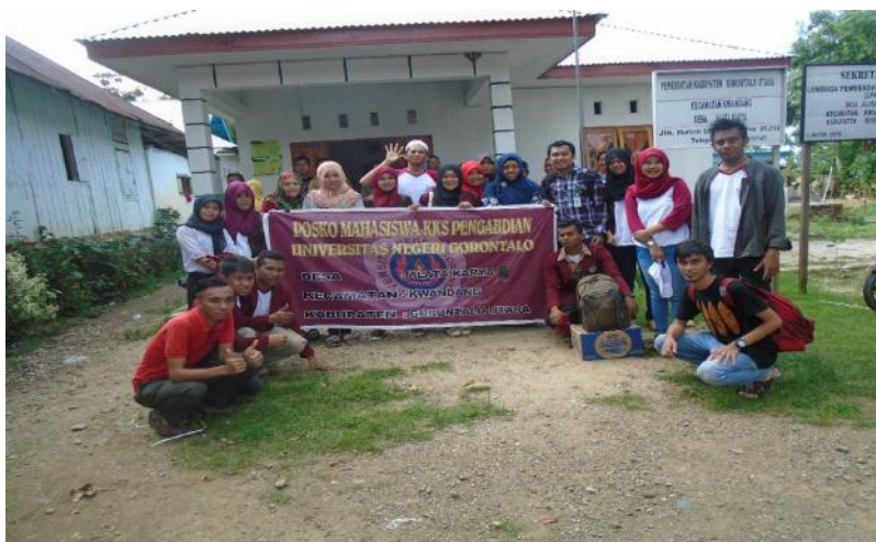
Gambar 5.12. Penarikan peserta Mahasiswa KKS Desa Alata Kaarya