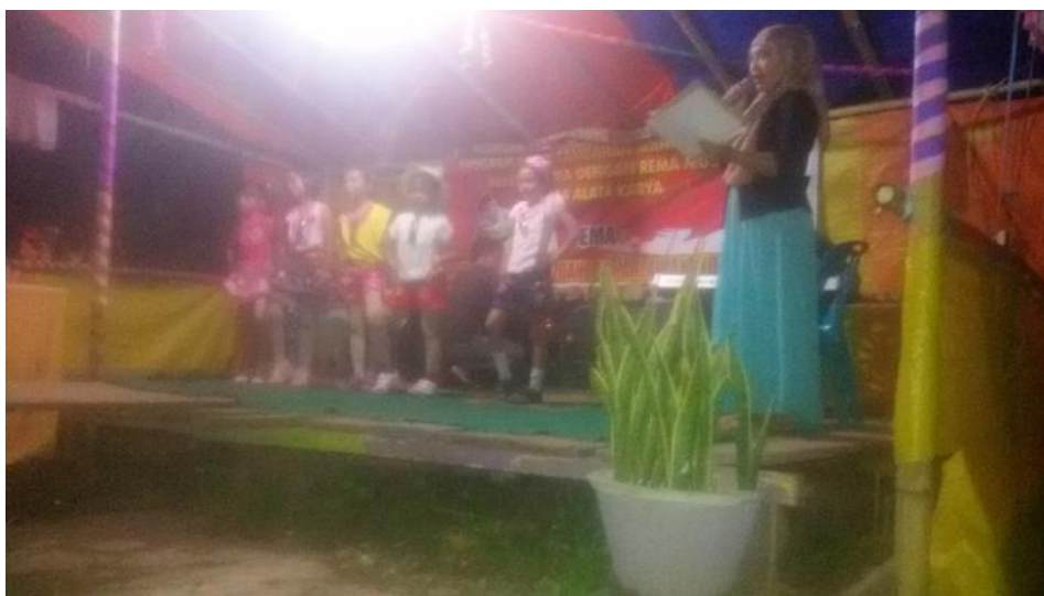
Gambar 5.8. Dokumentasi Penutupan Lomba seni dan olah Raga di Desa Alata Karya.