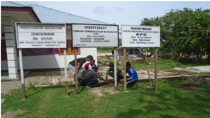
Gambar 5.9. Penanaman pohon