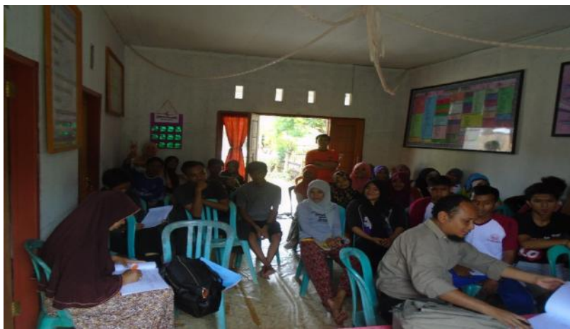
Gambar 5.11. Monitoring yang dilakukan oleh DPL