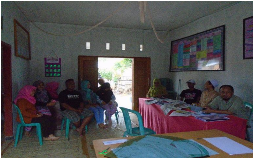
Gambar 5.4. Monitoring Dan Evaluasi kegiatan oleh DPL