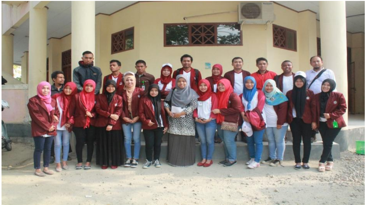
Gambar 5.2. Pengantaran Mahasiswa peserta KKS

Setelah proses pembekalan selesai, kemudian dilanjutkan dengan proses pemberangkatan peserta menuju lokasi KKS. Persiapan Keberangkatan bertempat di halaman Fakultas Teknik Universitas Negeri Gorontalo. Pemberangkatan mahasiswa KKS ke lokasi desa alata karya .Penerimaan mahasiswa KKS oleh kepala desa, aparat desa masyarakat setempat.