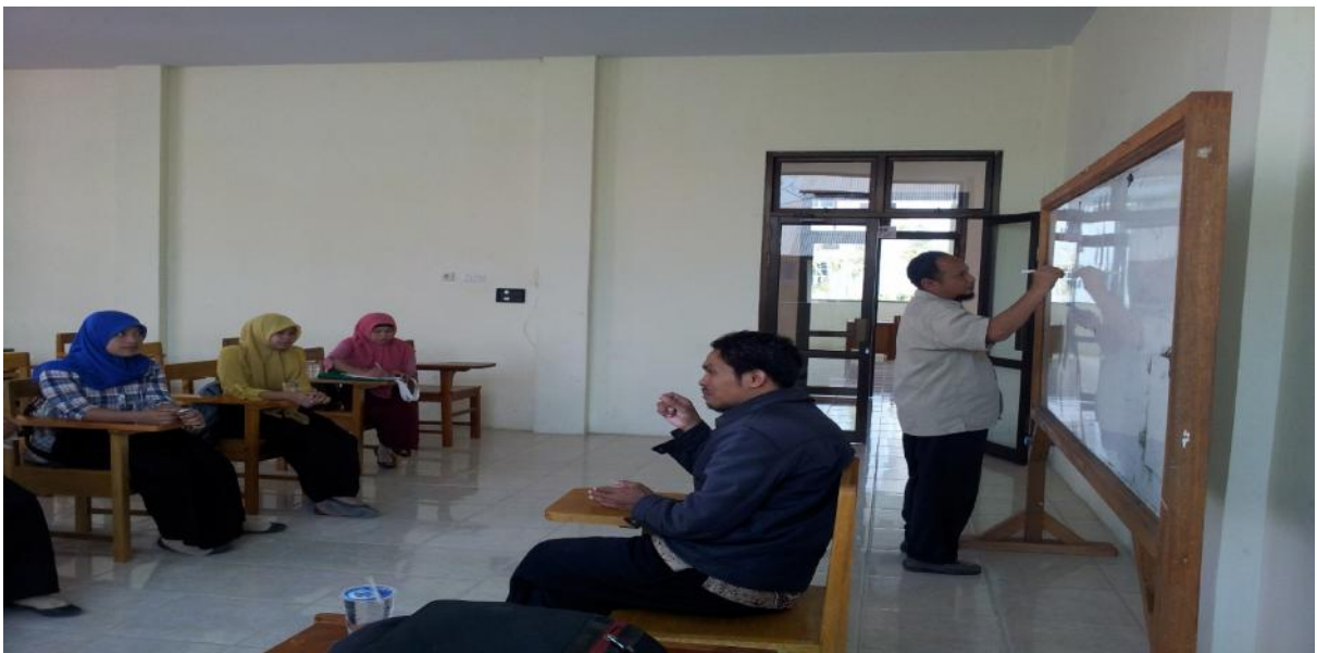
Gambar 5.1. Coaching Dengan Mahasiswa peserta KKS

Memberikan gambaran umum kondisi desa yang akan ditempati. Pembekalan dilakukan pada tanggal 8 Oktober 2015 di ruang kuliah yang ada di kompleks gedung Fakultas Teknik.