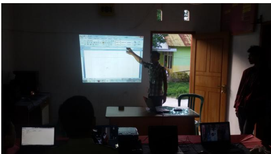
Gambar 5.10. Dokumentasi Pelatihan Komputer bagi aparat Desa Alata Karya