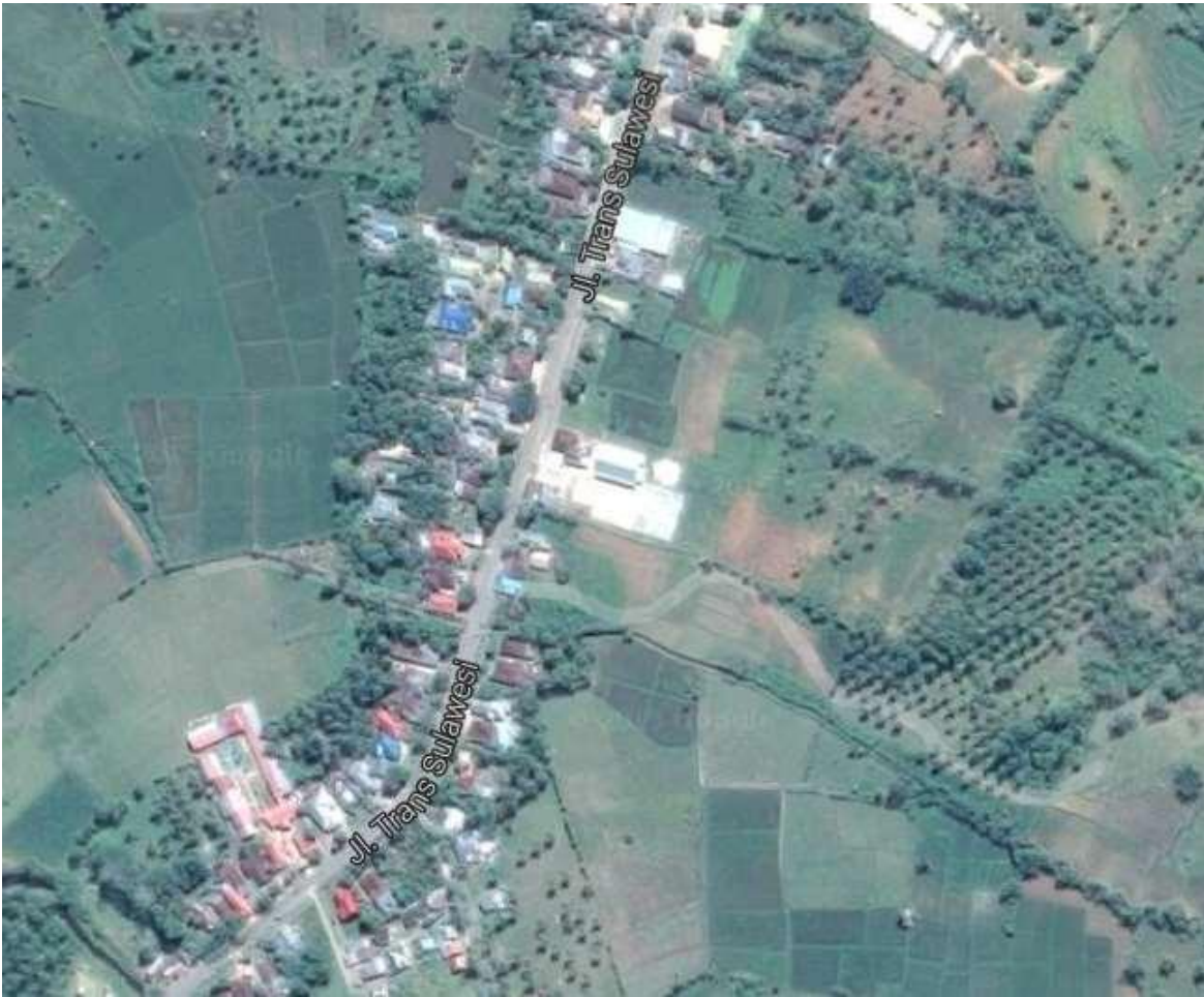
Sebagian Wilayah Desa Alata Karya