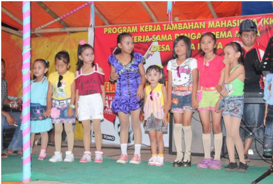
Gambar 5.6. Dokumentasi Lomba seni pada Desa Alata Karya