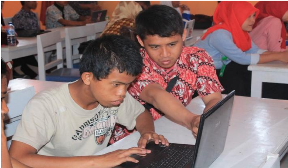
Gambar 5.3. Pelatihan Dasar Komputer Mahasiswa peserta KKS DiSLB Kwandang Kabupaten Gorontalo Utara

Kelompok kerja hasil kesepakatan kemudian disajikan dalam bentuk Pelaksana Pelatihan oleh Mahasiswa KKS ..