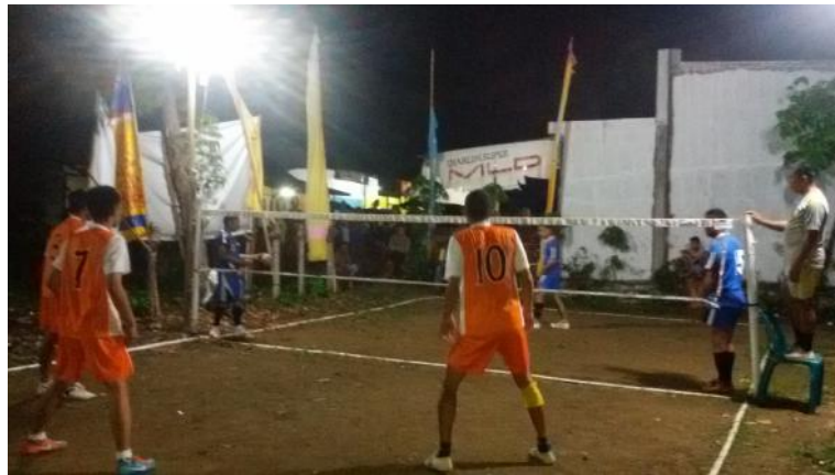
Gambar 5.7. Dokumentasi Pelaksanaan kegiatan olah raga Lomba sepak takrow