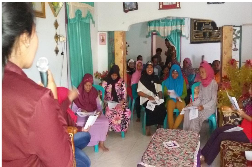
Penyuluhan Perilaku Hidup Bersih dan Sehat (PHBS) di Dusun Serpite Desa Wonggahu