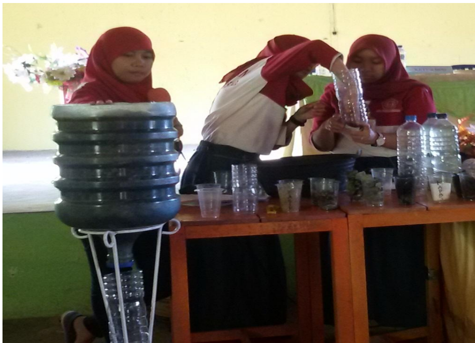
Mahasiswa KKS menjelaskan kepada masyarakat mengenai alat dan bahan serta pembuatan alat penyaring air bersih