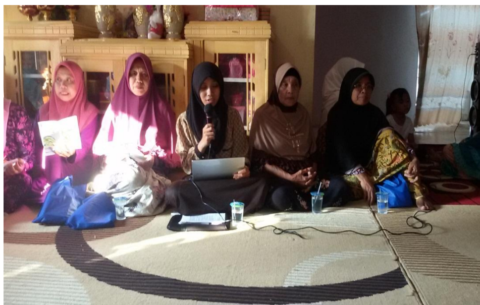
Penyuluhan Perilaku Hidup Bersih dan Sehat (PHBS) di Dusun Bonduladidi Timur Desa Wonggahu