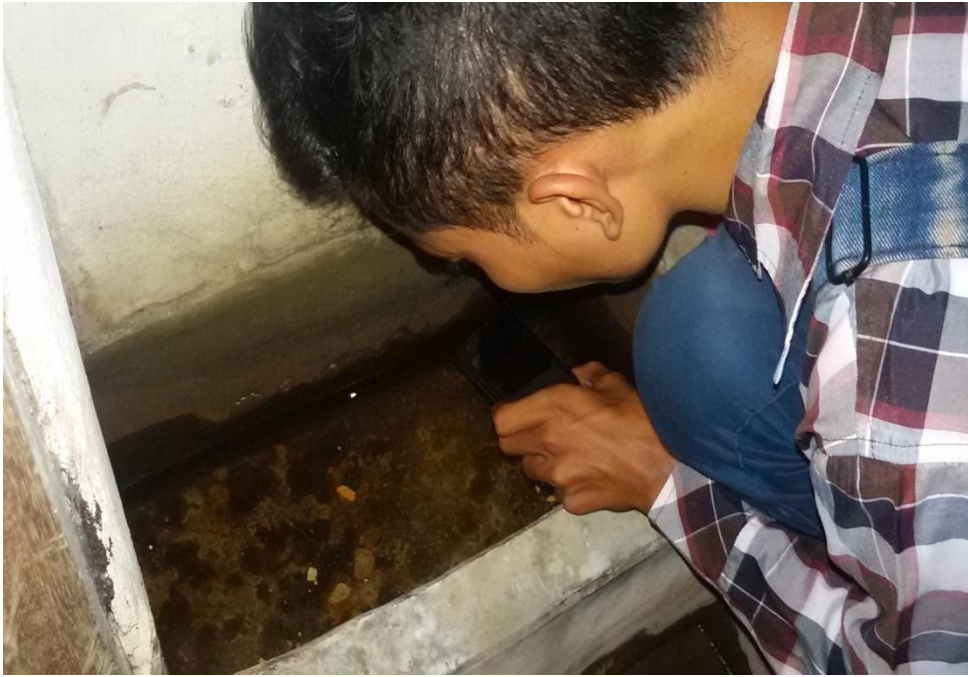
Survey jentik pada bak penampungan air di dusun Sombari