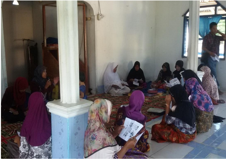
Penyuluhan Perilaku Hidup Bersih dan Sehat (PHBS) di Dusun Sombari Desa Wonggahu