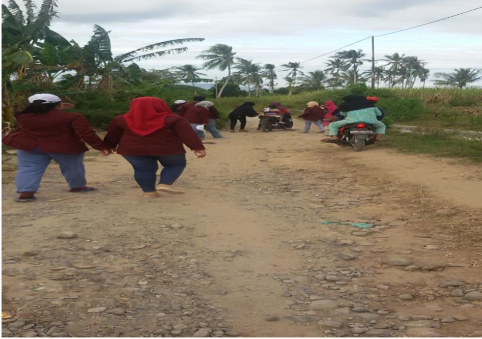
Survey jentik di dusun Serpite