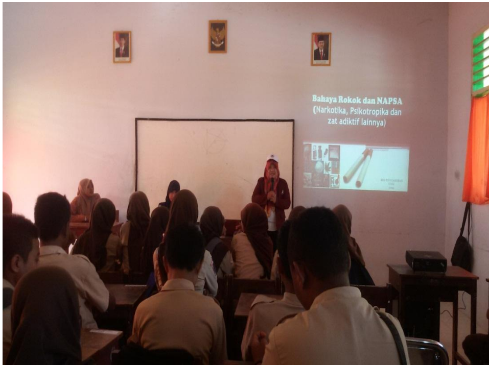
Penyuluhan Perilaku Hidup Bersih dan Sehat (PHBS) diMTs Boalemo