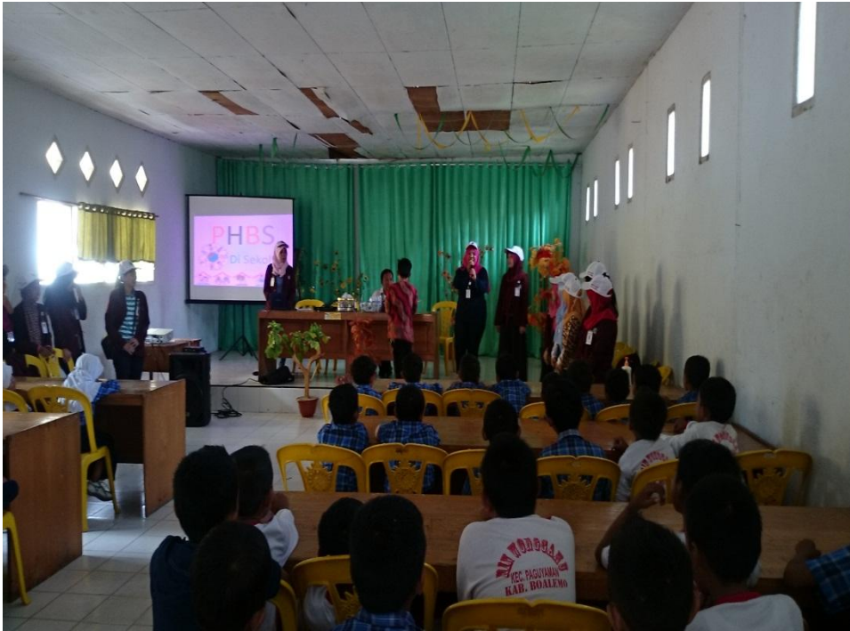
Penyuluhan Perilaku Hidup Bersih dan Sehat (PHBS) di Madrasah Ibtida'iah Negeri Wonggahu