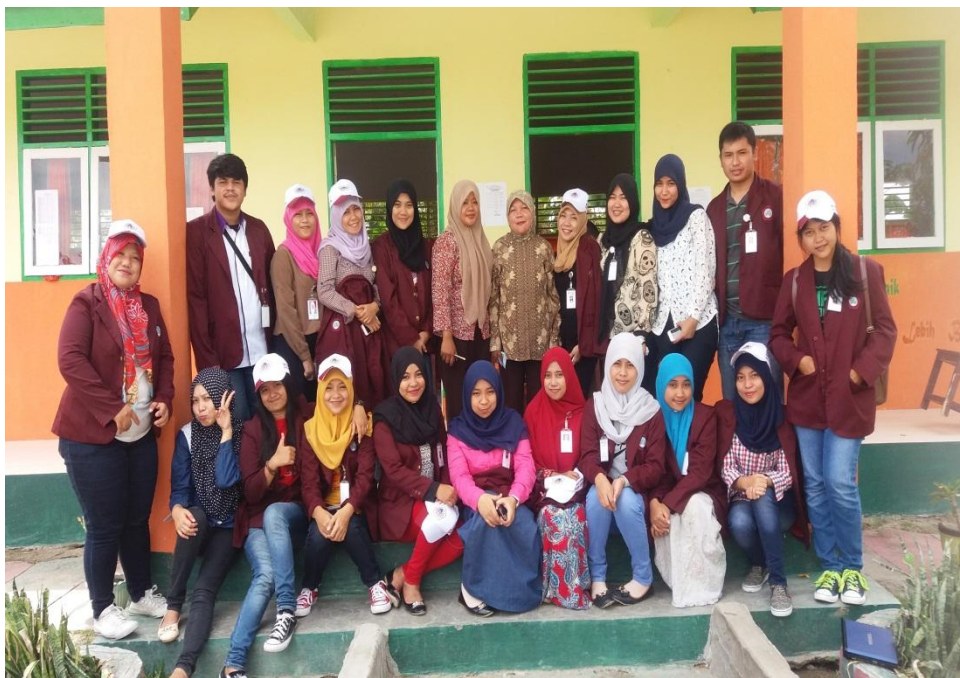
Foto bersama dengan guru MTs Boalemo