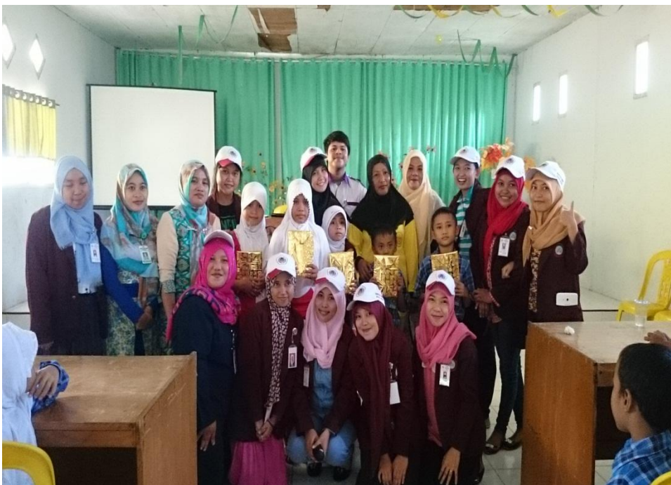
Foto bersama dengan guru Madrasah Ibtida'iah Negeri Wonggahu