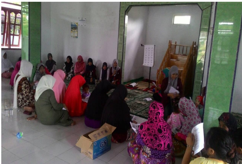
Penyuluhan Perilaku Hidup Bersih dan Sehat (PHBS) di Dusun Tohupo Desa Wonggahu