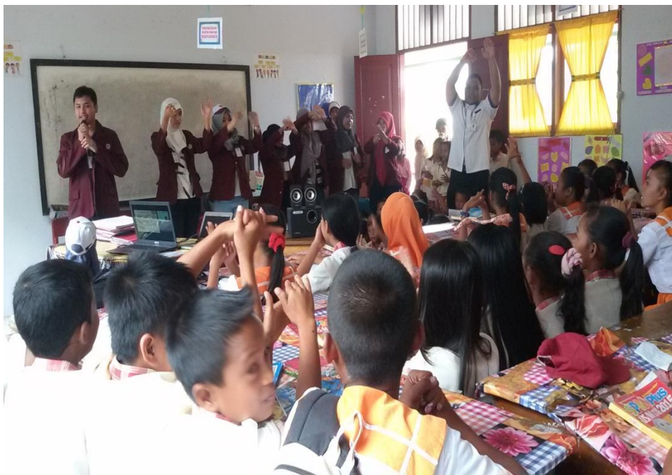
Siswa SDN 01 Paguyaman mempraktekkan salah 1 indikator PHBS Sekolah yaitu cara mencuci tangan yang baik dan benar