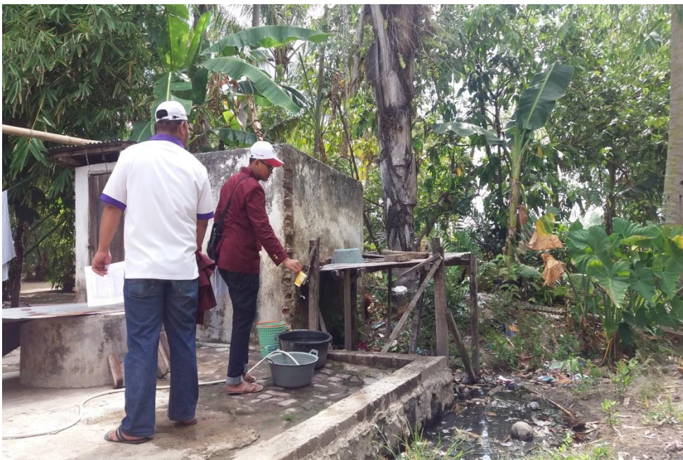
Survey jentik di dusun Tohupo