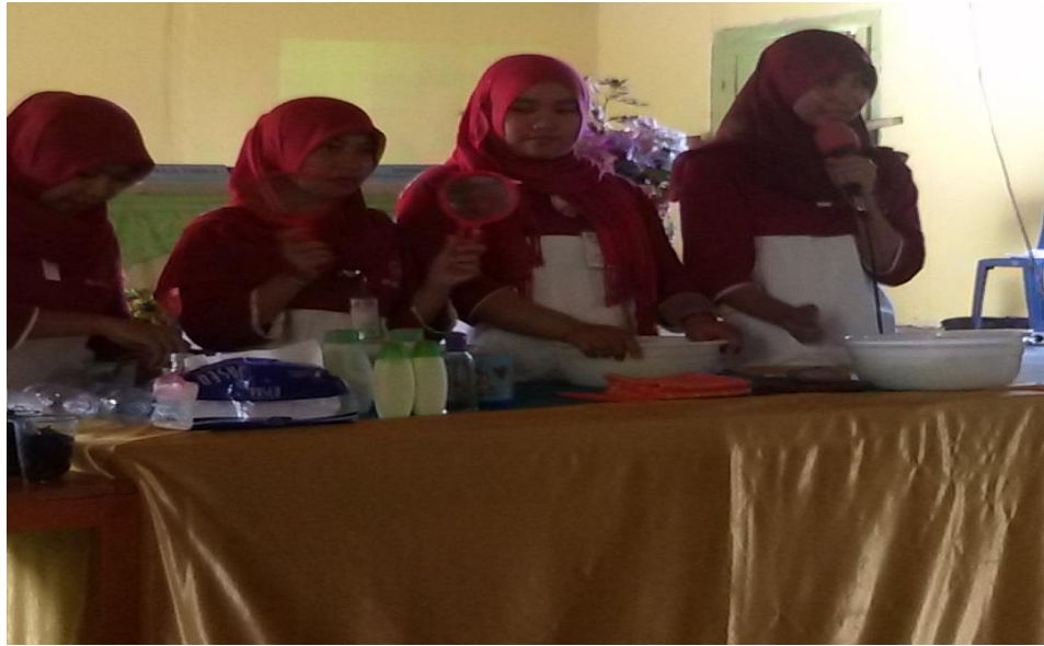
Mahasiswa KKS menjelaskan kepada masyarakat mengenai alat dan bahan pada Pembuatan Natural Insect Repellent Body Lotion Berbahan Dasar Daun Kemangi