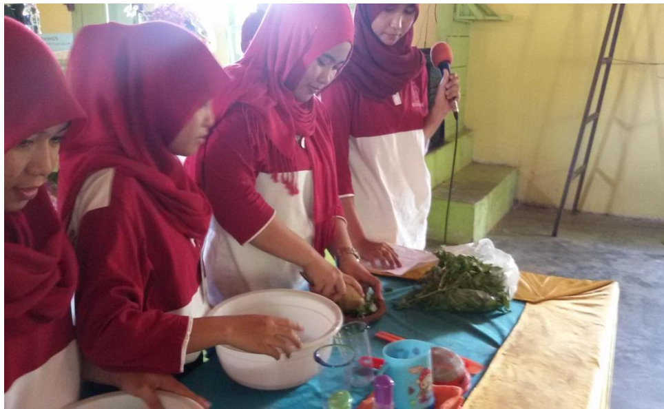
Proses pembuatan Natural Insect Repellent Body Lotion Berbahan Dasar Daun Kemangi