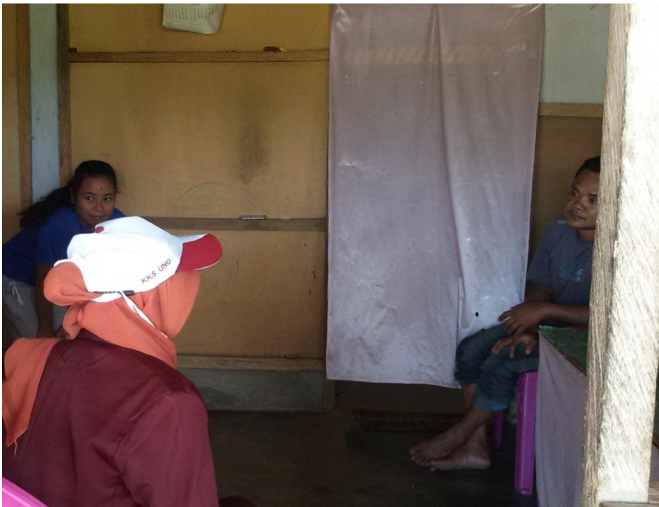
Survey jentik sekaligus sosialisasi bahaya dari nyamuk Aedes aegypti yang dapat menyebabkan penyakit DBD (Demam Berdarah Dengue) di dusun Datahu