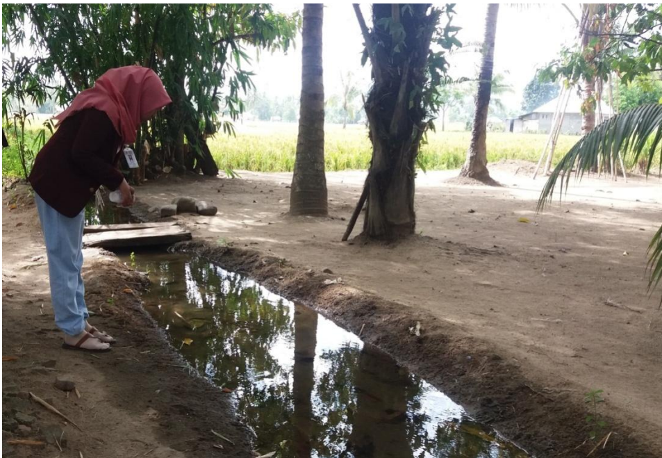
Survey jentik di dusun Bonduladidi Timur