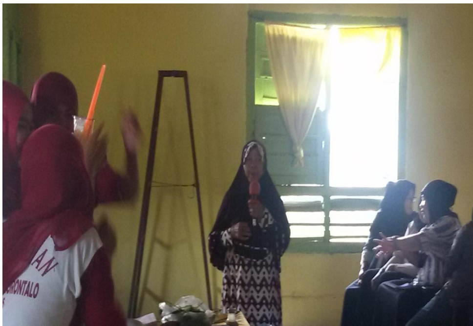
Proses tanya jawab salah satu masyarakat Desa Wonggahu mengenai Natural Insect Repellent Body Lotion Berbahan Dasar Daun Kemangi