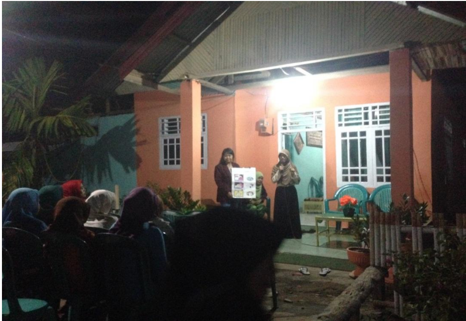
Penyuluhan Perilaku Hidup Bersih dan Sehat (PHBS) di Dusun Datahu Desa Wonggahu