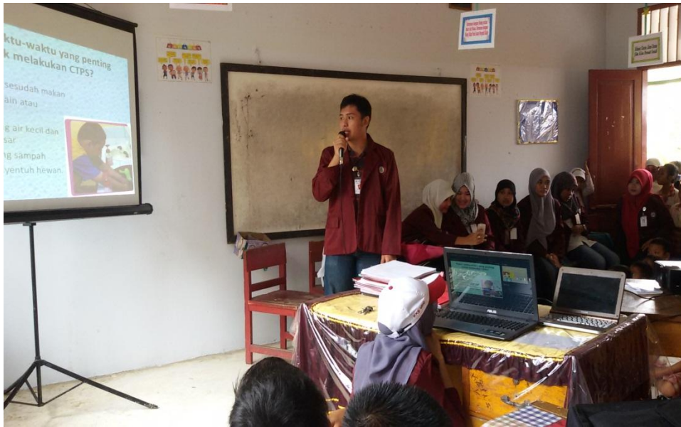
Penyuluhan Perilaku Hidup Bersih dan Sehat (PHBS) di SDN 01 Paguyaman