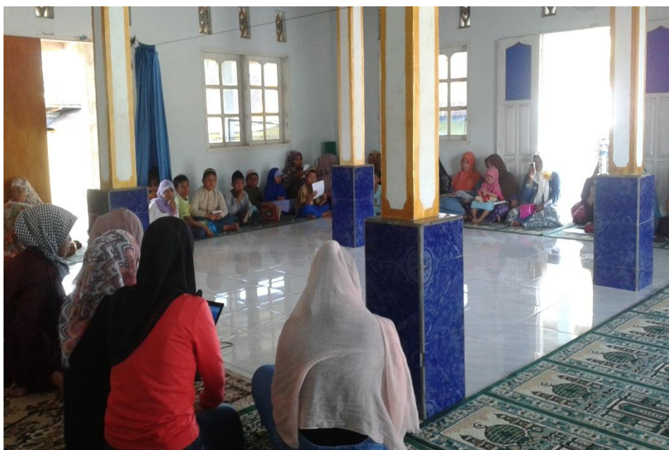
Penyuluhan Perilaku Hidup Bersih dan Sehat (PHBS) di Dusun Bonduladidi Barat Desa Wonggahu