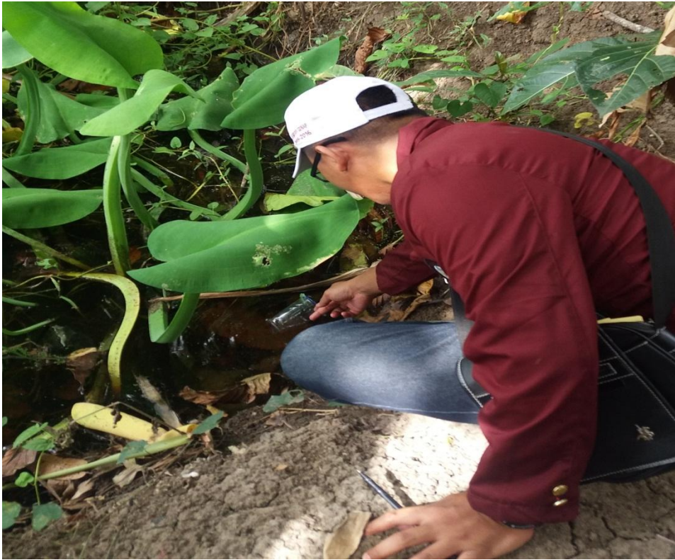
Survey jentik di dusun Bonduladidi Barat