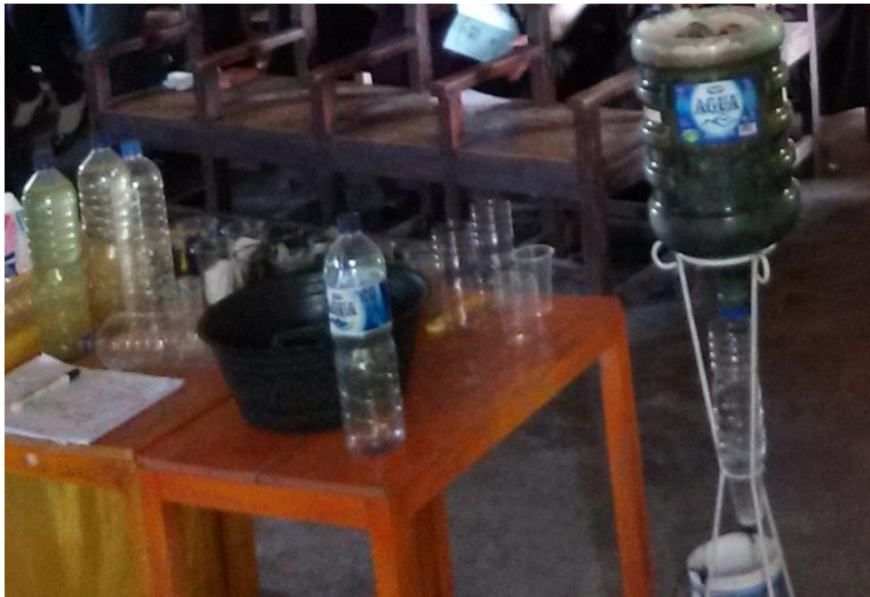
Alat dan bahan penyaringan air bersih