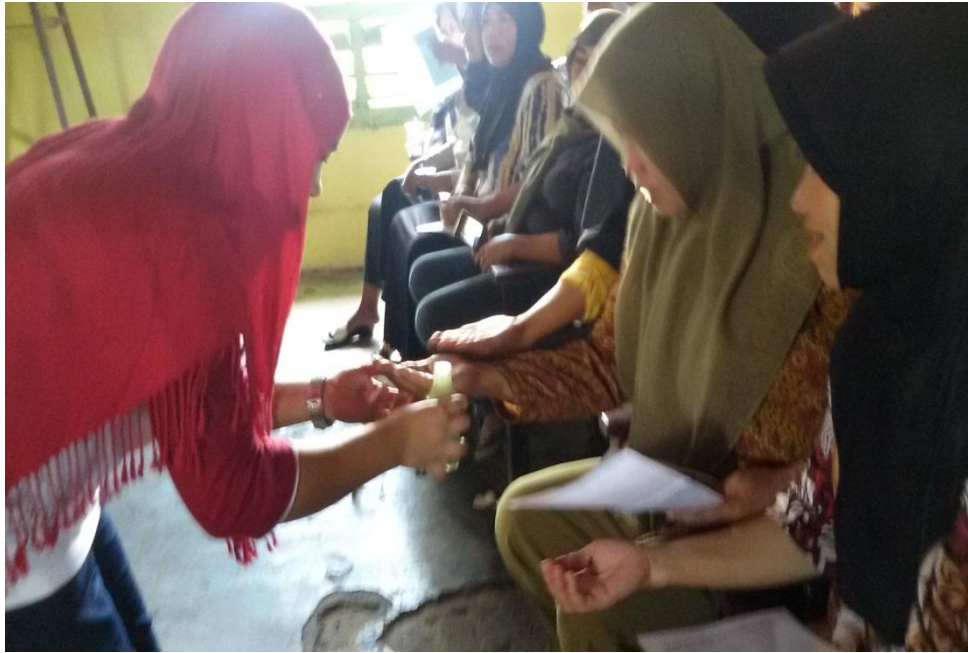
Antusias masyarakat Desa Wonggahu yang mencoba menggunakan Natural Insect Repellent Body Lotion Berbahan Dasar Daun Kemangi