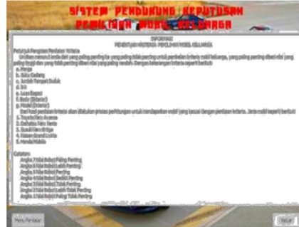
Gambar 2. Menu Home

terdapat tombol “Menu Penilaian” dan tombol “Keluar”.