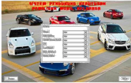
Gambar 3. Menu Penilaian