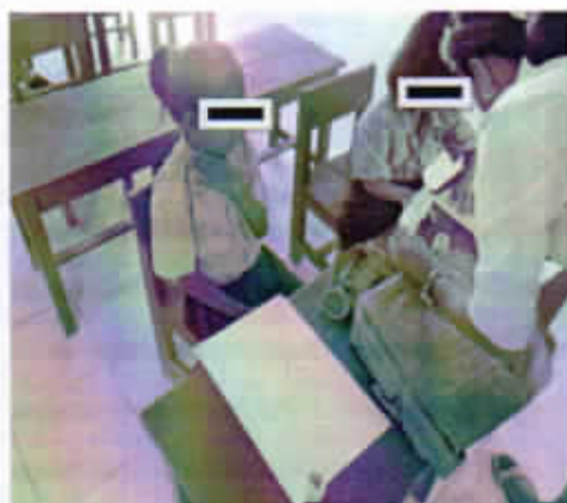
Gambar 3. Membuat perjanjian tingkah laku