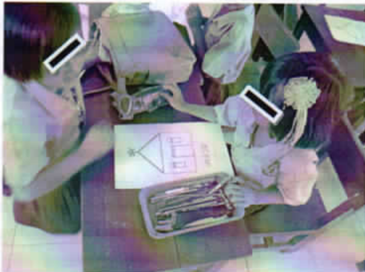
Gambar 2. Anak yang kurang percaya diri ketika di kelas karena sering mengalami kekerasan di rumah

2) Memberikan perintah dengan jelas dan spesifik dengan kalimat yang