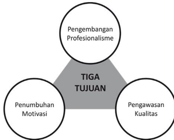
Gambar 1. Tujuan supervisi akademik, diambil dari Richard Rudman

Menurut Rudman 12 ada tiga tujuan supervisi akademik sebagaimana dapat dilihat pada gambar 1. berikut: