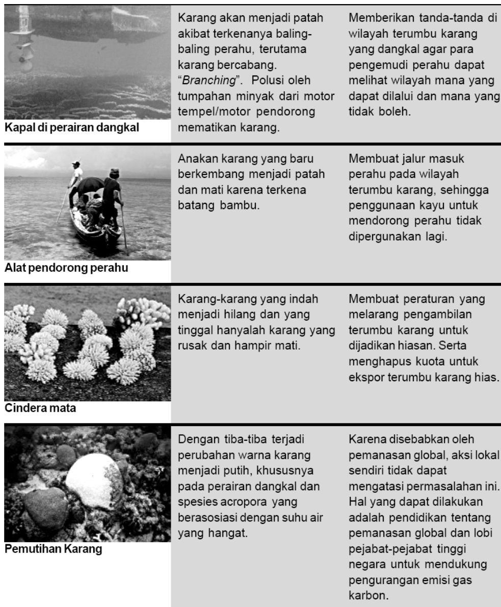
Tabel 1 Ancaman manusia terhadap terumbu karang, indikasi yang timbul, dan beberapa kemungkinan penanganan yang bisa dilakukan