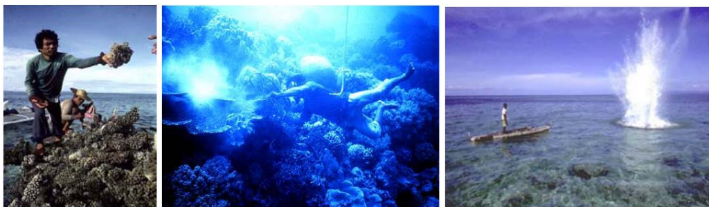
Gambar 3 Beberapa bentuk eksploitasi yang sangat merusak.

Kegiatan manusia yang menyebabkan terjadinya degradasi terumbu karang antara lain: (1) Penambangan dan pengambilan karang, (2) Penangkapan ikan dengan menggunakan alat dan metoda yang merusak, (3) Penangkapan yang berlebih, (4) Pencemaran perairan, (5) Kegiatan pembangunan di wilayah pesisir, dan (6) Kegiatan pembangunan di wilayah hulu (Gambar 3). Sedangkan degradasi terumbu karang yang diakibatkan oleh alam antara lain: pemanasan global ( global warming ), bencana alam seperti angin taufan ( storm ), gempa tektonik ( earth quake ), banjir ( floods ) dan tsunami serta fenomena alam lainnya seperti El-Nino , La-Nina dan lain sebagainya.