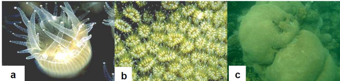
Gambar 1 (a) Polip karang; (b) koloni karang; (c) struktur kerangka karang

Sedangkan coral atau karang, merupakan salah satu organisme laut yang tidak bertulang belakang ( invertebrate ), berbentuk polip yang berukuran mikroskopis (Gambar 1a), namun mampu menyerap kapur dari air laut dan mengendapkannya sehingga membentuk timbunan kapur yang padat.