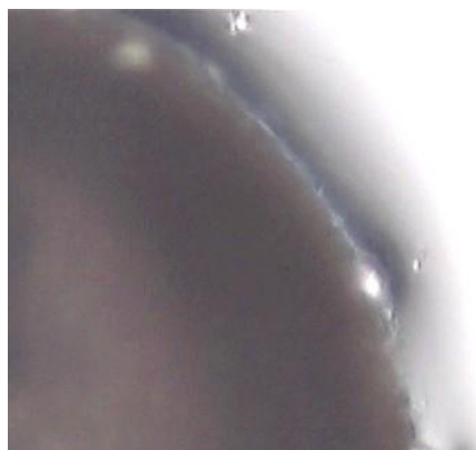
Gambar 2 Sistokarp dengan Lubang Ostirole

Pelepasan karpospora dari sistokarp terjadi setelah 72 jam, dari lubang ( ostirole ). Sebelum karpospora dikeluarkan, ostirole terlihat jelas dan terjadi penonjolan berupa daerah bening di sekitar sistokarp . Lubang ostirole dapat dilihat pada Gambar 2 di bawah ini.