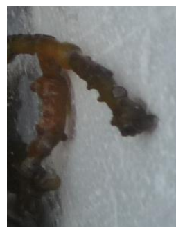
Gambar 1 Thallus Karposporofit Gracilaria salicornia

Thalus Gracilaria salicornia yang diperoleh pada bulan November telah dipenuhi sistokarp yang dicirikan dengan adanya bintil-bintil di permukaan thallus sebagaimana terlihat pada Gambar 1.