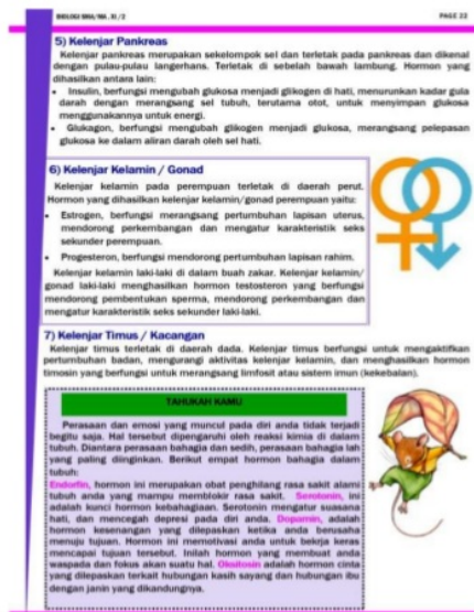
Gambar 3. Contoh Konten Materi