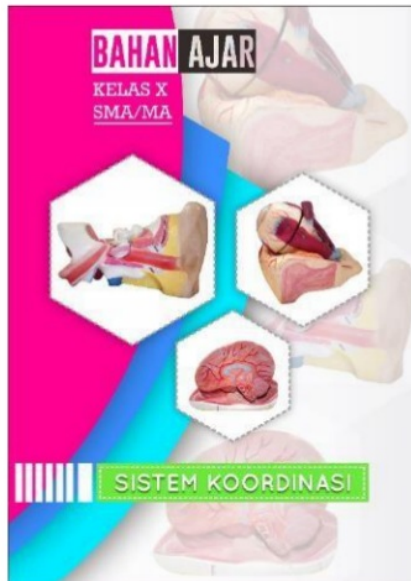
Gambar 1. Sampul Depan Bahan Ajar