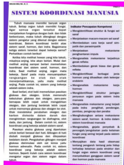
Gambar 2. Halaman Awal Bahan Ajar