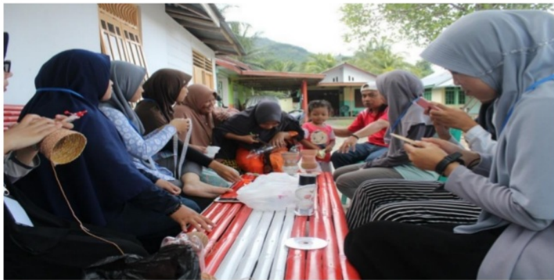
Gambar 3. Proses Pembuatan Vas Bunga dan Bunga