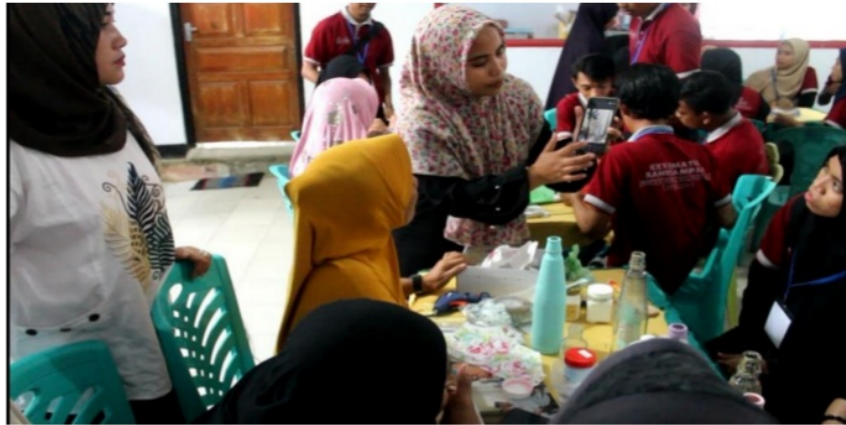
Gambar 5. Proses Pembuatan Kerajinan dari Botol Kaca