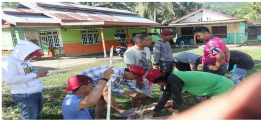
Gambar 9. Proses Pembuatan Tempat Sampah