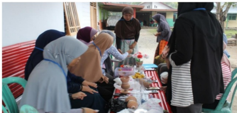
Gambar 4. Proses Pembuatan Vas Bunga dan Bunga