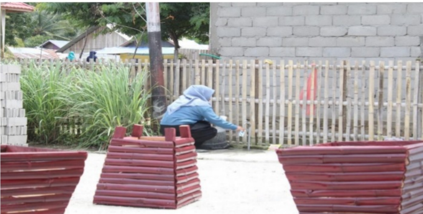
Gambar 10. Proses Pembuatan Tempat Sampah