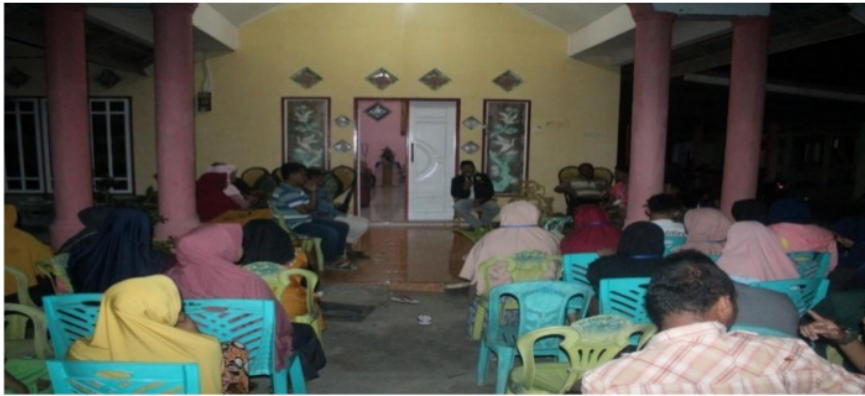
Gambar 8. Pembentukan Bank Sampah