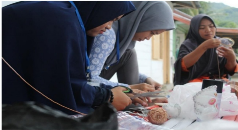
Gambar 2. Proses Pembuatan Vas Bunga dan Bunga