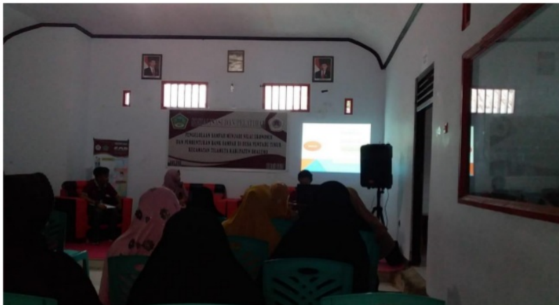
Gambar 1. Sosialisasi Pengelolaan Sampah