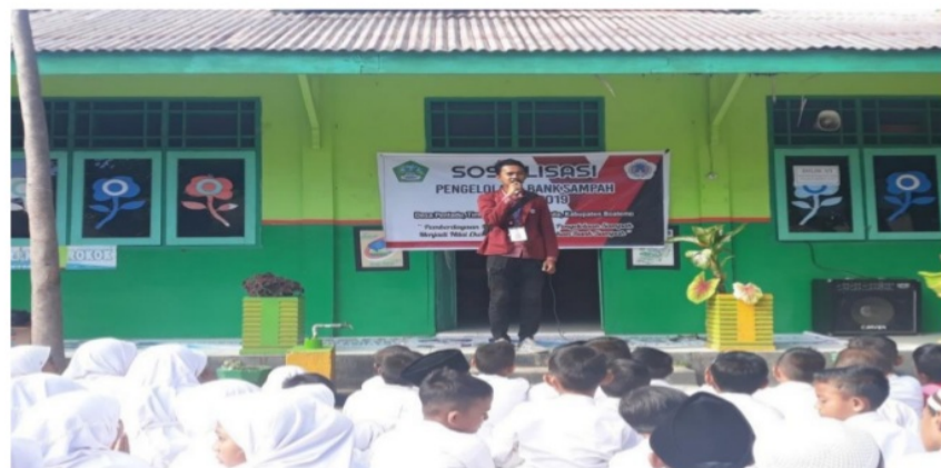
Gambar 7. Sosialisasi Pengelolaan Sampah dan Pembentukan Bank Sampah Di Sekolah-sekolah di Desa Pentadu Timur