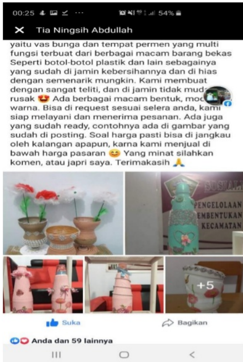
Gambar 11. Pemasaran on line melalui FB