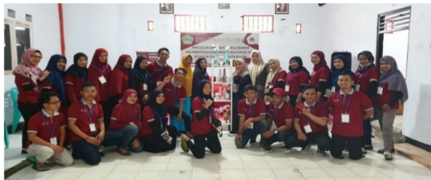
Gambar 6. Kerajinan yang dihasilkan