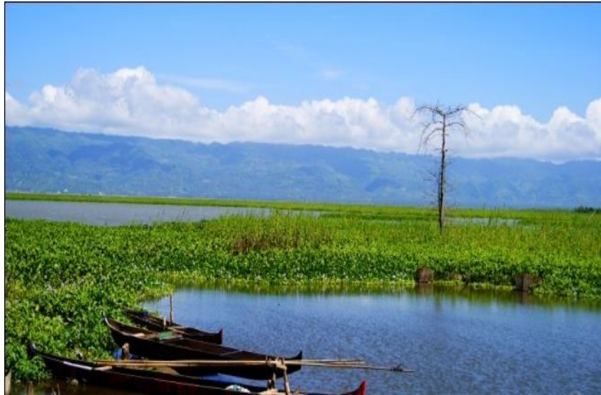
Gambar 1. Eceng gondok di pesisir Danau Limboto

peluang dan tantangan dalam pemanfaatan potensi wilayah. Desa Iluta merupakan salah satu desa di kabupaten Gorontalo yang menjadi desa binaan Universitas Negeri Gorontalo. Beberapa kegiatan akademik juga dilaksanakan disini. Kondisi tingkat ekonomi masyarakat desa berada pada menengah ke bawah yang sebagian besar mata pencahariannya bergantung di Danau Limboto Kabupaten Gorontalo. Secara geografis Desa Iluta berbatasan langsung dengan danau Limboto dan wilayah Kota Gorontalo.