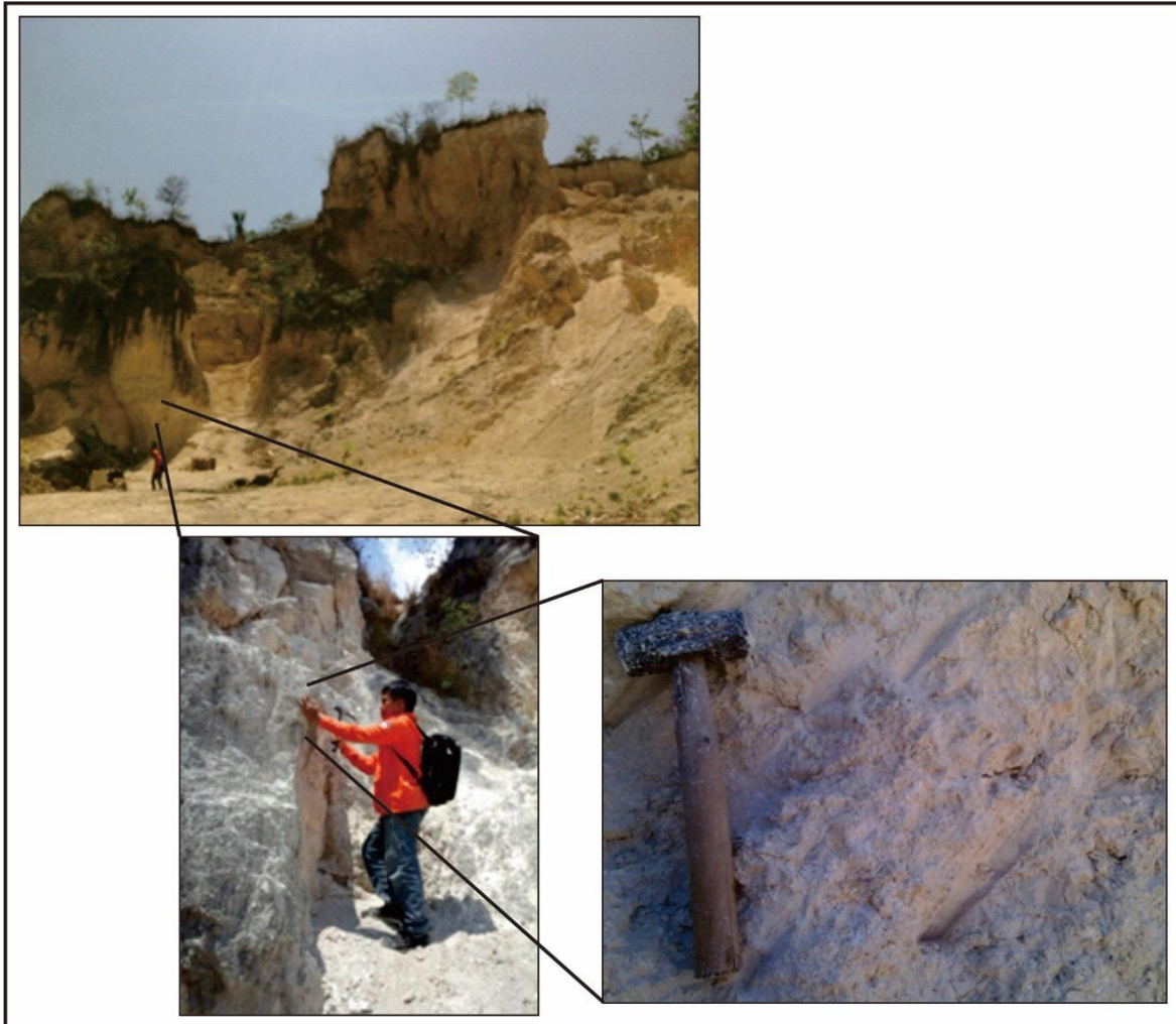
Gambar 2. Survei lapangan sekaligus analisis petrologi dan sampling untuk analisis petrografi

batugamping adalah Kalsirudit (Grabau, 1905) atau Coralline Floatstone (Embry dan Klovan, 1971).