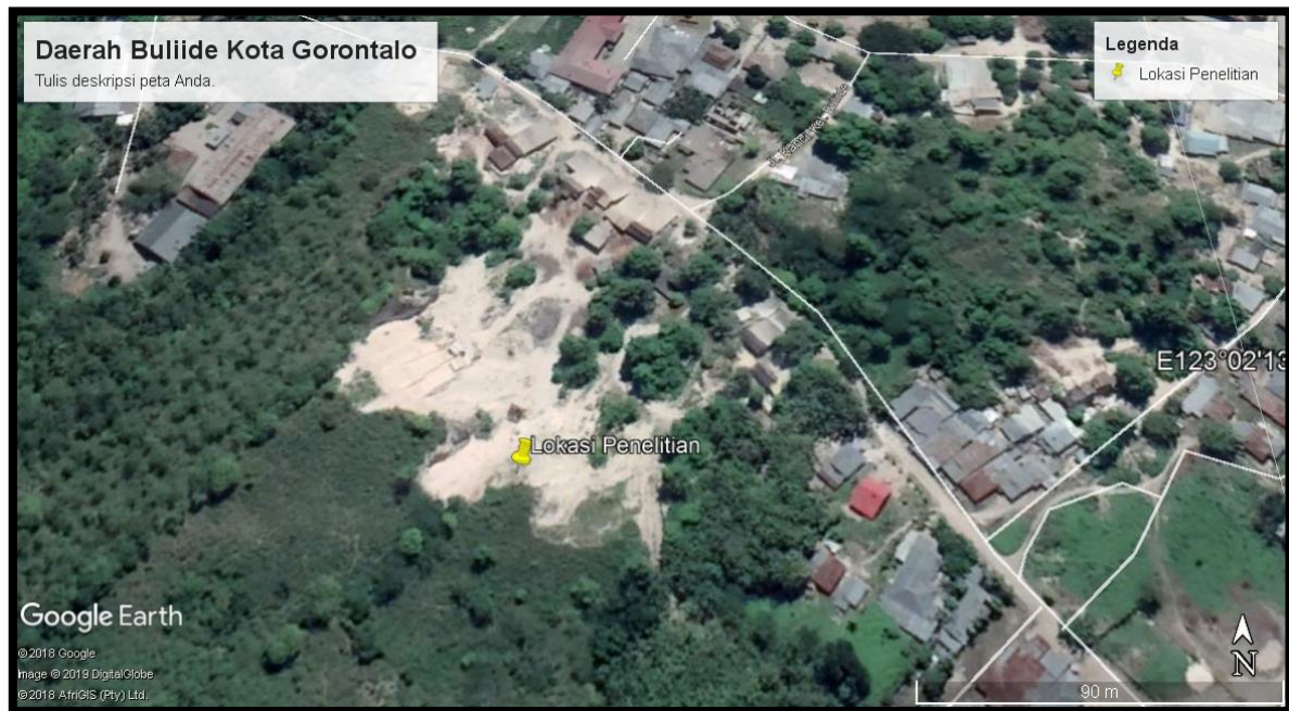
Gambar 1. Lokasi penelitian Kelurahan Buliide Kecamatan Kota Barat Gorontalo (Anonim., 2019)

Metode penelitian yang dilakukan ada dua metode yakni metode survei lapangan dan metode analisis laboratorium. Pendekatan penelitian yang dilakukan ada dua yakni analisis kualitatif dan analisis kuantitatif. Untuk survei lapangan fokus deskripsi dan interpretasi jenis batugamping serta sampling yang layak dianalisis laboratorium. Analisis laboratorium berupa analisis petrografi di laboratorium Geo Optik. Tahapan analisis petrografi diawali pembuatan sayatan tipis ( thin section ) dengan metode blocking berfungsi mengimpregnasi larutan biru ( blue dye ) ke dalam pori untuk membedakan pori asli batuan dengan pori selama preparasi (Dickson, 1966; Crabtre et al., 1984). Analisis petrografi menggunakan mikroskop polarisasi binokular Euromex 1053 yang dilengkapi kamera terhubung komputer (Allen et al., 1963; Lawrence, 1993; Scholle dan Scholle, 2003; Tetley dan Daczko, 2013; Azizi et al., 2014; Darul et al., 2017; Serge dan Senthilkumar, 2017; Ofulume et al., 2018; Putra, 2018). Analisis petrografi sangat membantu mengetahui komposisi mineral penyusun batuan dan jenis porositas sehingga dapat diketahui tipe diagenesis. Interpretasi tipe diagenesis ini nantinya akan membantu menentukan lingkungan diagenesis batugamping tersebut setelah terbentuk atau diendapkan (Maryanto, 2007, 2012; Maryanto dan Permana, 2013; Arosi dan Wilson, 2015; Junursyah et al., 2018).