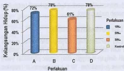
Gambar 3 Tingkat Kelangsungan Hidup Ikan Nila Merah ( Oreochromis Niloticus )

terendah karena disebabkan oleh tingginya salinitas (Gambar 3).