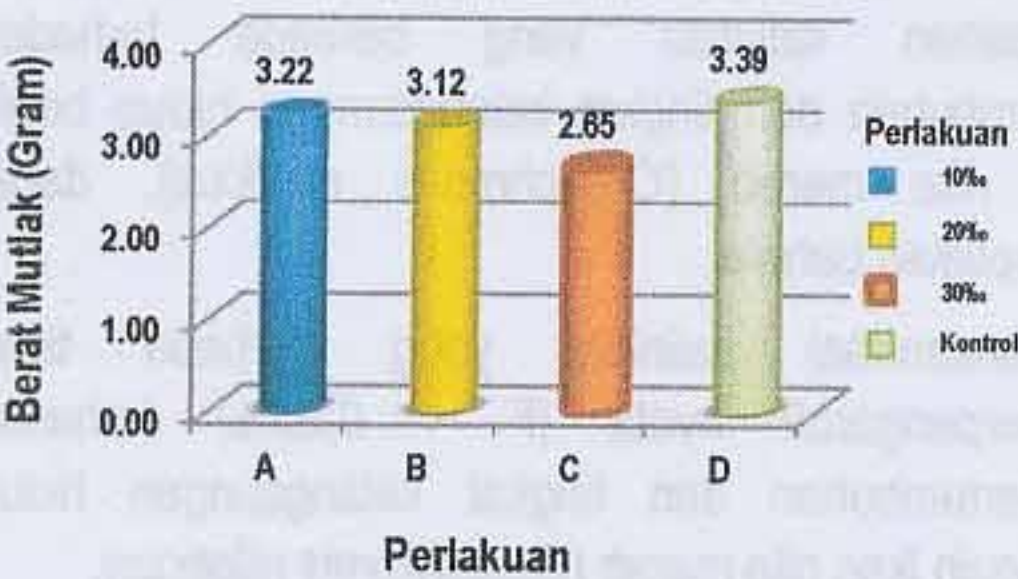
Gambar 2 Pertumbuhan Berat Mutlak Benih Ikan Nila Merah ( Oreochromis niloticus )

Hasil analisis ragam berat benih ikan nila merah (Gambar 2) menunjukkan bahwa salinitas yang berbeda tidak memberikan pengaruh yang nyata ( F < 0,05\% ) terhadap pertumbuhan berat ikan nila merah.