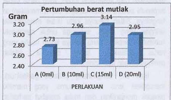
Gambar 1 Pertumbuhan berat mutlak benih ikan lele sangkuriang

Benih ikan lele sangkuriang yang dipelihara selama penelitian mengalami pertumbuhan berat mutlak pada setiap perlakuan, namun terjadi peningkatan pertumbuhan yang signifikan pada perlakuan C sebesar 3,14 gram, kemudian perlakuan B sebesar 2,96 gram, pertumbuhan ketiga ditunjukkan pada perlakuan D yaitu 2,95 gram, Sedangkan perlakuan A memiliki pertumbuhan berat mutlak terendah yakni 2,73 gram. terjadi hubungan pertambahan berat antara pakan yang diberi penambahan viterna dan yang tidak diberi tambahan viterna.