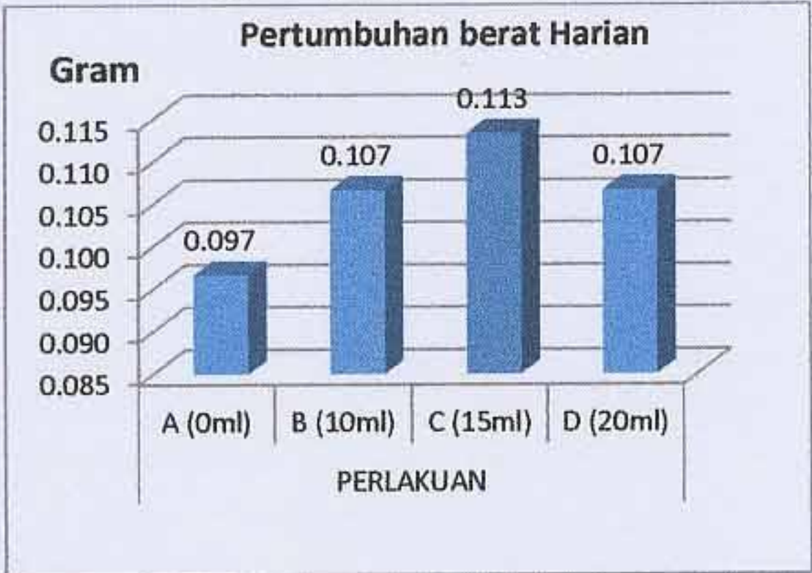
Gambar 2 Grafik pertumbuhan berat harian

Pertumbuhan berat harian benih ikan lele sangkuriang ( Clarias gariepinus ) selama 28 hari dengan menggunakan empat perlakuan yakni perlakuan A (dosis viterna 0 ml/kg pakan), perlakuan B (dosis viterna 10 ml/kg pakan), dan perlakuan C (dosis viterna 15 ml/kg pakan) dan perlakuan D (dosis viterna 20 ml/kg pakan) dapat dilihat pada Gambar 2.