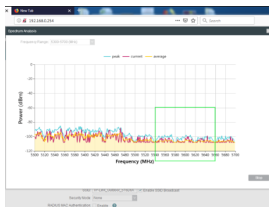
Gambar 1. Hasil Pengecekan pada Saat Tidak Ada Gangguan pada Frekuensi yang Ditetapan untuk Radar Cuaca BMKG Provinsi Gorontalo

interferensi dari luar ataukah ada kerusakan pada perangkat radar. Pengecekan ini juga dilakukan untuk melokalisir band frekuensi mana yang harus diclearence mengingat Juni 2018 telah dilakukan penanganan gangguan frekuensi radar cuaca BMKG Gorontalo. Hasil pengecekan seperti ditampilkan pada Gambar 1 berikut.