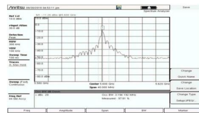
Gambar 3. Hasil Pengukuran Bandwidth Radar Cuaca BMKG Gorontalo

Gambar 2. Hasil Pengecekan Gangguan yang Terjadi pada Frekuensi yang Ditetapan untuk Radar Cuaca BMKG Provinsi Gorontalo Berdasarkan data pada Gambar 2 dapat diketahui bahwa saat terjadi gangguan maka level sinyal akan semakin bertambah atau mengalami perubahan dari level sebelumnya. Adapun hasil pengukuran bandwidth radar cuaca BMKG Gorontalo ditampilkan pada Gambar 3.