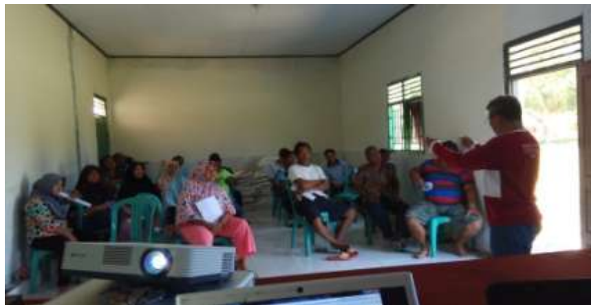
Pelatihan Pembuatan Pupuk Organik cangkang Telur di Aula Kantor Desa