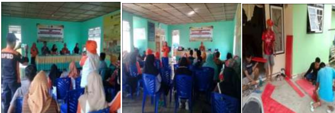
Sosialisasi Penanggulangan Bencana Di Desa Girisa