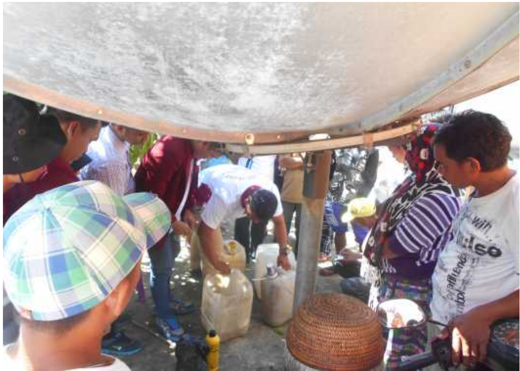
Gambar 6. Teknologi pembuatan biourin sapi