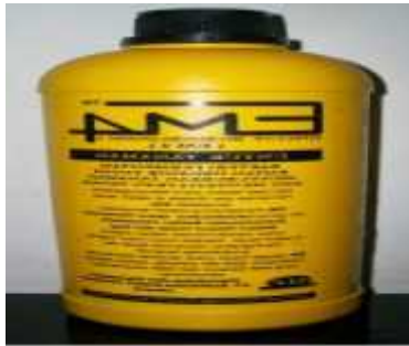
Gambar 3. Bioaktivator EM4