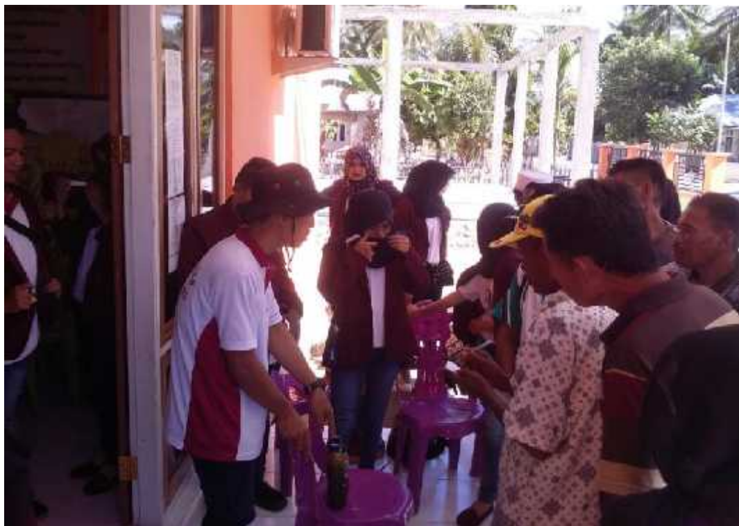
Gambar 7. Teknologi pembuatan biopestisida