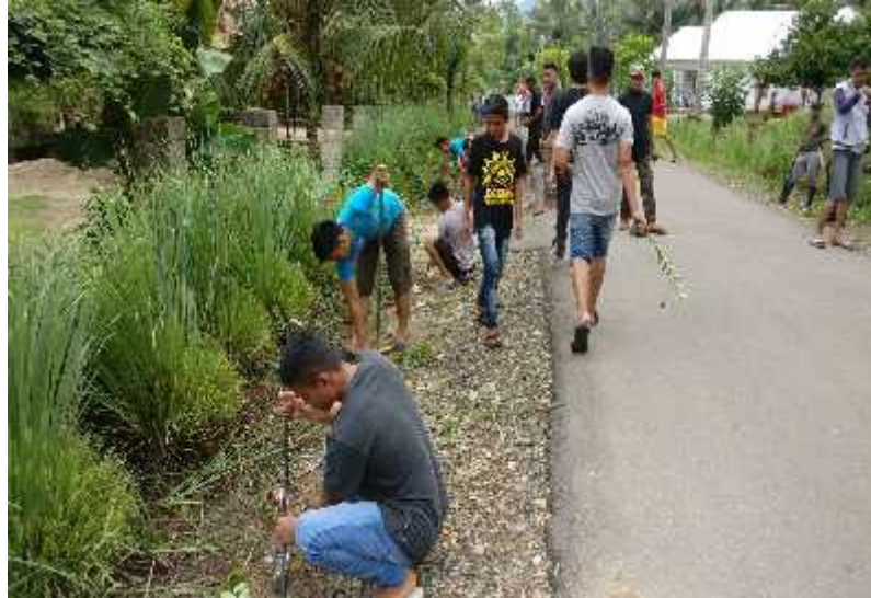
Gambar 8. Kegiatan penanaman pohon pelindung