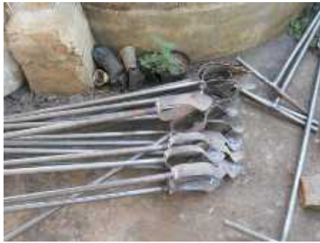
Gambar 1. Bor tanah