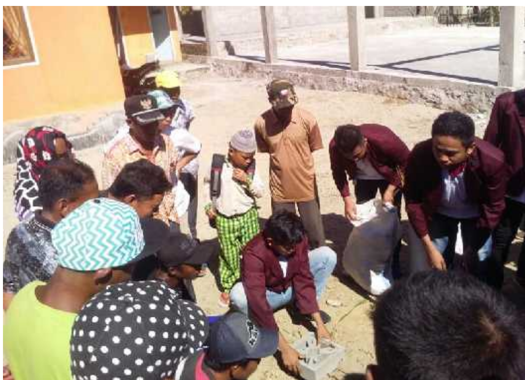
Gambar 5. Teknologi pembuatan biopori