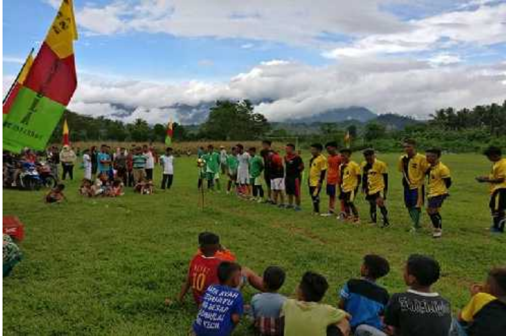
Gambar 11. Kegiatan turnamen sepakbola