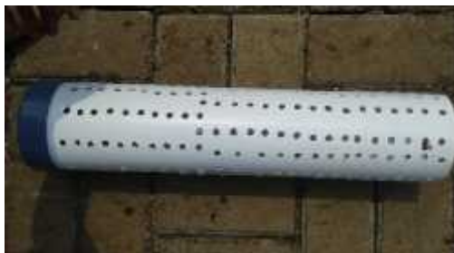
Gambar 2. PVC yang dilubangi