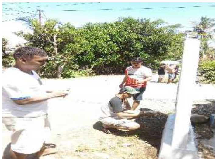
Gambar 10. Kegiatan pembuatan batas dusun desa Bondula