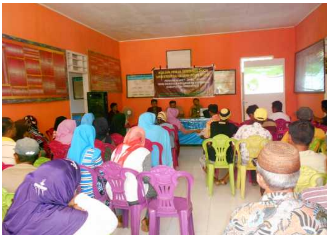
Gambar 4. Pelatihan dan penyuluhan teknologi adaptasi iklim