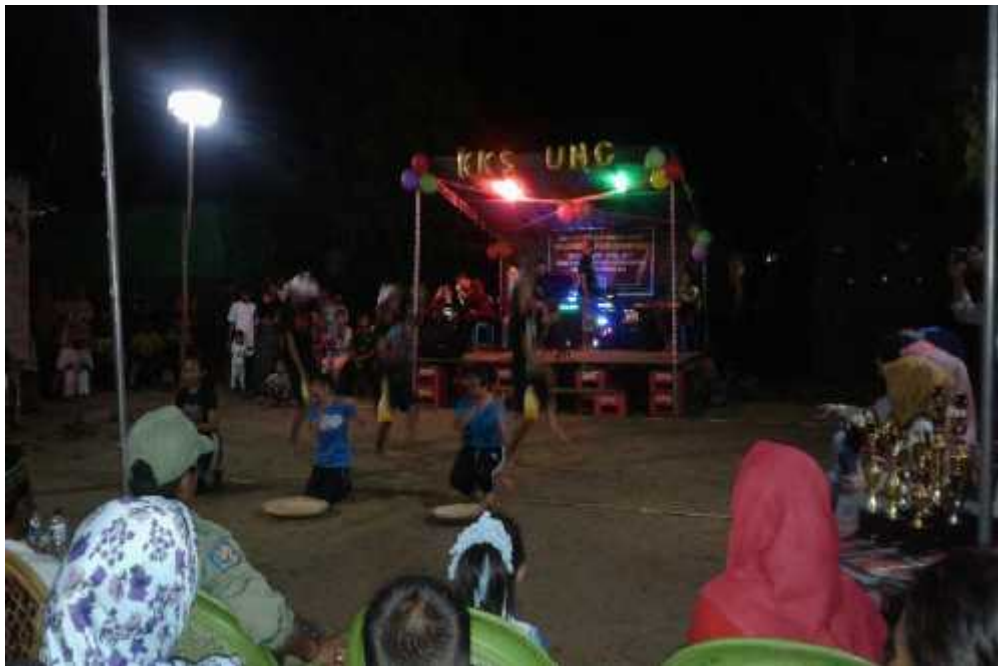
Gambar 12. Kegiatan malam penutupan dengan berbagai atraksi kesenian di lapangan desa