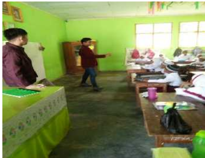
Gambar 9. Kegiatan melakukan pendidikan dan pengajaran di SD