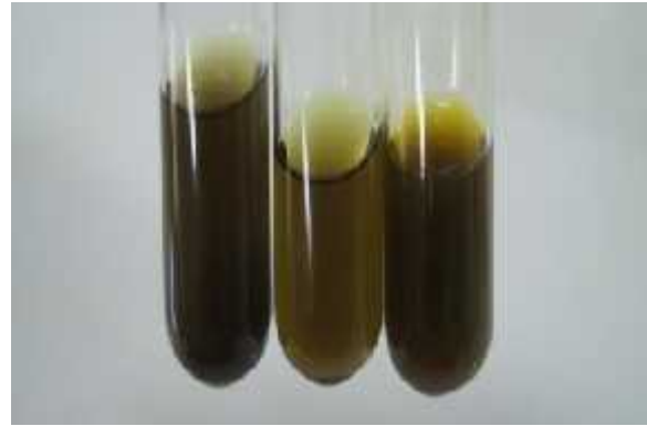
Gambar 2 Hasil identifikasi tanin menggunakan FeCl_3

Berdasarkan hasil identifikasi tanin menggunakan FeCl_3 , tannin positif ditemukan pada buah, daun dan kulit batang mangrove S. alba yang diekstrak menggunakan pelarut metanol yang ditandai dengan warna hijau kehitaman. Hasil identifikasi tanin menggunakan FeCl_3 dapat dilihat pada Gambar 2.