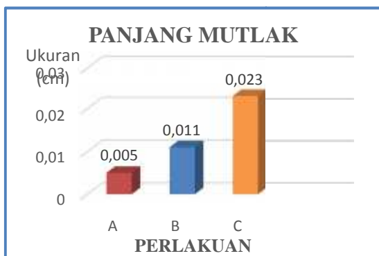
Gambar 1 Grafik pertumbuhan panjang mutlak benih ikan lele sangkuriang.

Hasil pengukuran panjang benih ikan lele sangkuriang yang dilakukan selama 10 hari pemeliharaan menunjukkan adanya perbedaan pada setiap perlakuan. Perlakuan yang digunakan yaitu frekuensi pemberian pakan alami cacing sutera ( Tubifex sp. ), perlakuan A (2 kali), perlakuan B (3 kali), perlakuan C (4 kali). Adapun perbedaan setiap perlakuan tersebut dapat dilihat pada Gambar 1