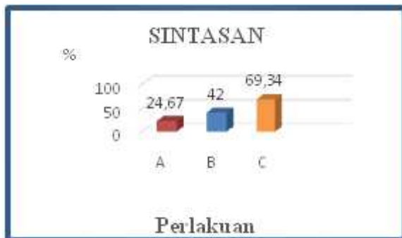
Gambar 5 Grafik Sintasan Ikan Lele Sangkuriang

Sintasan benih ikan lele sangkuriang ( Clarias sp ), pada akhir pengamatan dapat di lihat pada Gambar 5.