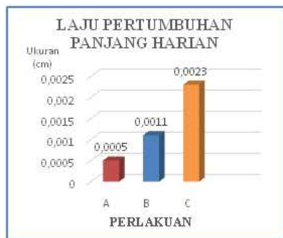
Gambar 3 Grafik laju pertumbuhan panjang harian