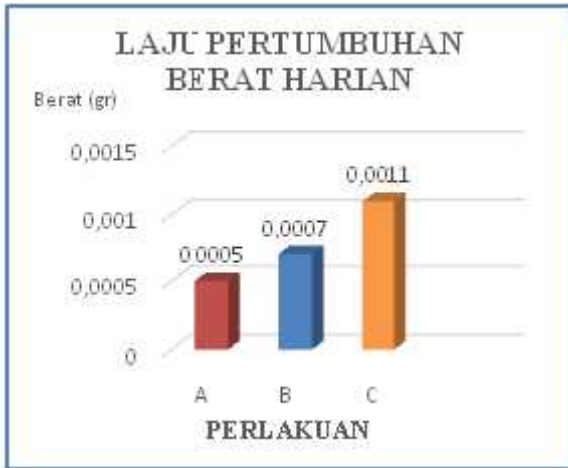
Gambar 4 Laju pertumbuhan berat harian

Perlakuan frekuensi pemberian pakan alami cacing sutera ( Tubifex sp ), yang berbeda pada benih ikan lele sangkuriang ( Clarias sp ), menunjukkan laju pertumbuhan harian rata – rata yang berbeda pula (Gambar 8). Laju pertumbuhan harian panjang tertinggi ditunjukkan pada frekuensi pemberian pakan sebanyak 4 kali dilanjutkan dengan frekuensi pemberian pakan sebanyak 3 kali masing-masing berturut - turut 0,0023 cm/hari, 0,0011 cm/hari dan paling rendah pada frekuensi pemberian pakan sebanyak 2 kali yaitu 0,0005 cm/hari. Selanjutnya laju pertumbuhan berat tubuh harian tertinggi ditunjukkan pada frekuensi pemberian pakan sebanyak 4 kali dilanjutkan dengan frekuensi pemberian pakan sebanyak 3 kali dan yang terendah yakni pada frekuensi pemberian pakan sebanyak 2 kali masing-masing berturut – turut 0,0011 gr/hari, 0,0007 gr/hari dan 0,0005 gr/hari.