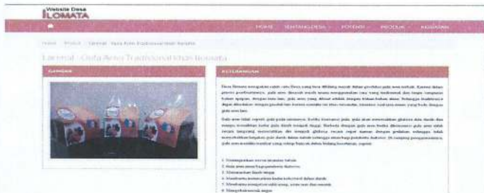
Kelompok Gula Aren Arenbi: