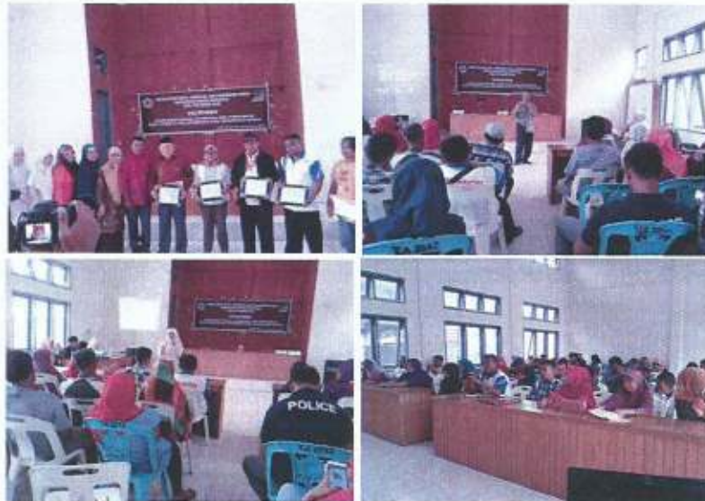
Gambar 3: Pelaksanaan Kegiatan