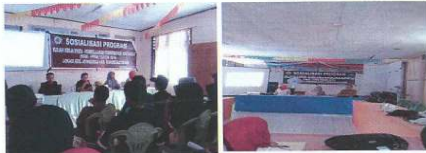
Gambar 2: Pelaksanaan Kegiatan