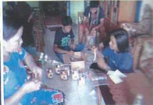
Kelompok Gula Aren Larenal: