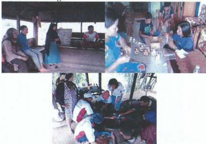
Gambar 4: Pelaksanaan Kegiatan

Kegiatan pendampingan merupakan kelanjutan dari kegiatan pelatihan. Pendampingan dilakukan oleh 30 mahasiswa KKN PPM sebagaimana sesuai dengan pembagian tugas berdasarkan latar program studi. Sepuluh (10) mahasiswa program studi S1 manajemen mendampingi UMK untuk memperbaiki manajemen usaha, Sepuluh (10) mahasiswa S1 Akuntansi mendampingi UMK dalam membuat laporan keuangan usaha, Sepuluh (10) mahasiswa program studi S1 Sistem Informasi dan Pendidikan Teknologi Informasi mendampingi pembuatan desain kemasan produk dan website online marketing .