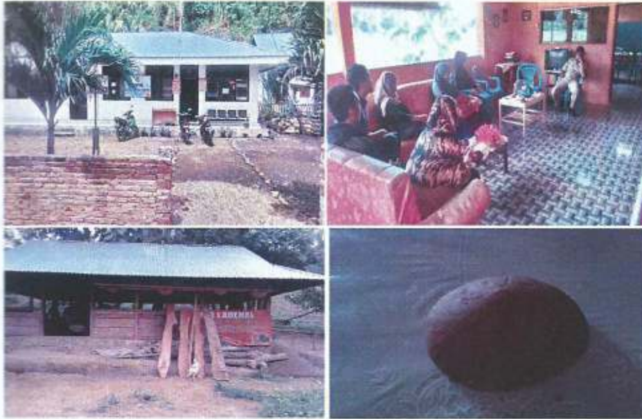
Gambar 1: Situasi dan Kondisi Mitra