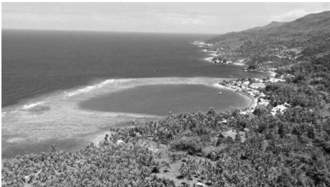
Gambar Laguna di Pantai Biluhu

Di samping itu, makin banyak pengunjung, makin besar kemungkinan pantai serta wilayah desa akan menjadi kotor, sebab tidak semua pengunjung menyadari pentingnya menjaga kebersihan lingkungan pantai.