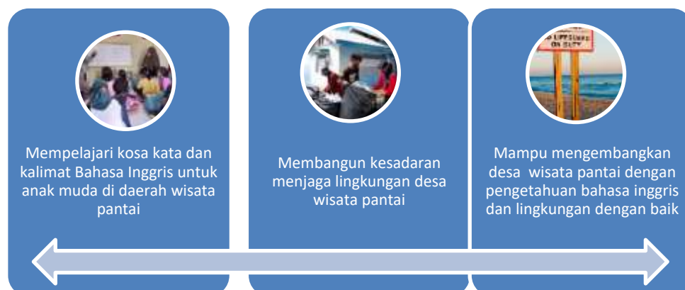
Gambar Tujuan Pelaksanaan Pengabdian di Desa Biluhu Timur

Dengan demikian, melalui program KKN Tematik (KKNT) Desa Membangun Dosen Pembimbing Lapangan (DPL) bersama mahasiswa KKN bertujuan agar masyarakat mendapatkan pengetahuan mengenai Bahasa Inggris Dasar dan mereka menyadari peran mereka dalam menjaga lingkungan di mana mereka tinggal dan menjadikannya sebagai budaya atau gaya hidup mereka sehari-hari. Lebih jauh lagi, penerapan program yang tidak terlepas dari penggunaan teknologi masa kini dapat mendorong masyarakat terutama anak muda desa untuk dapat terinspirasi untuk mengembangkan desa mereka yang telah menjadi destinasi wisata.