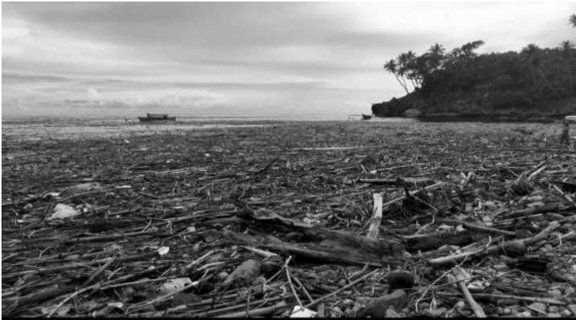
Gambar sampah kiriman di Pantai Biluhu

Biluhu secara tetap menerima sampah kiriman yang mengalir ke pantai itu terbawa arus laut dari arah kota Gorontalo.