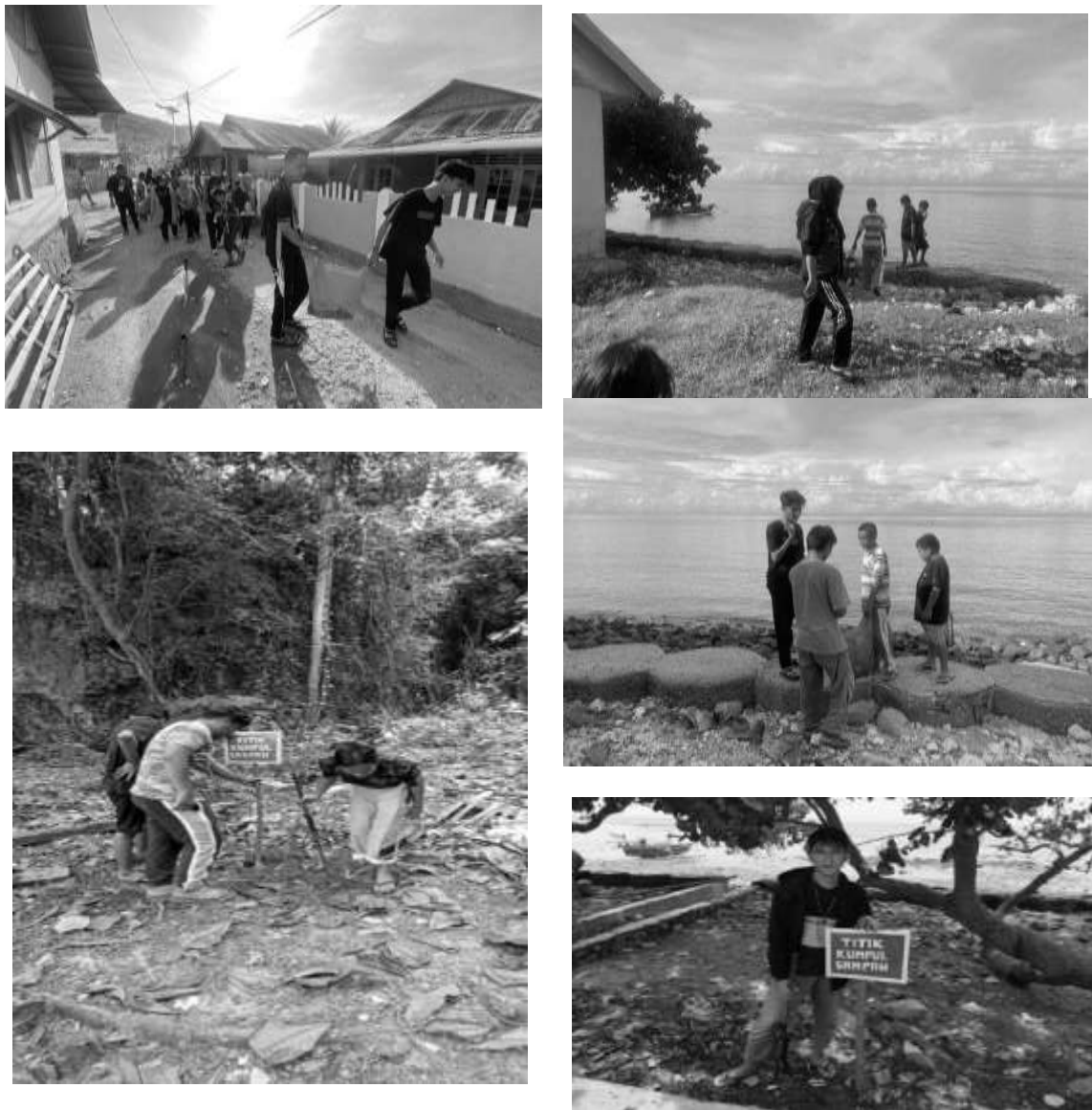
Gambar Program Bersih Pantai