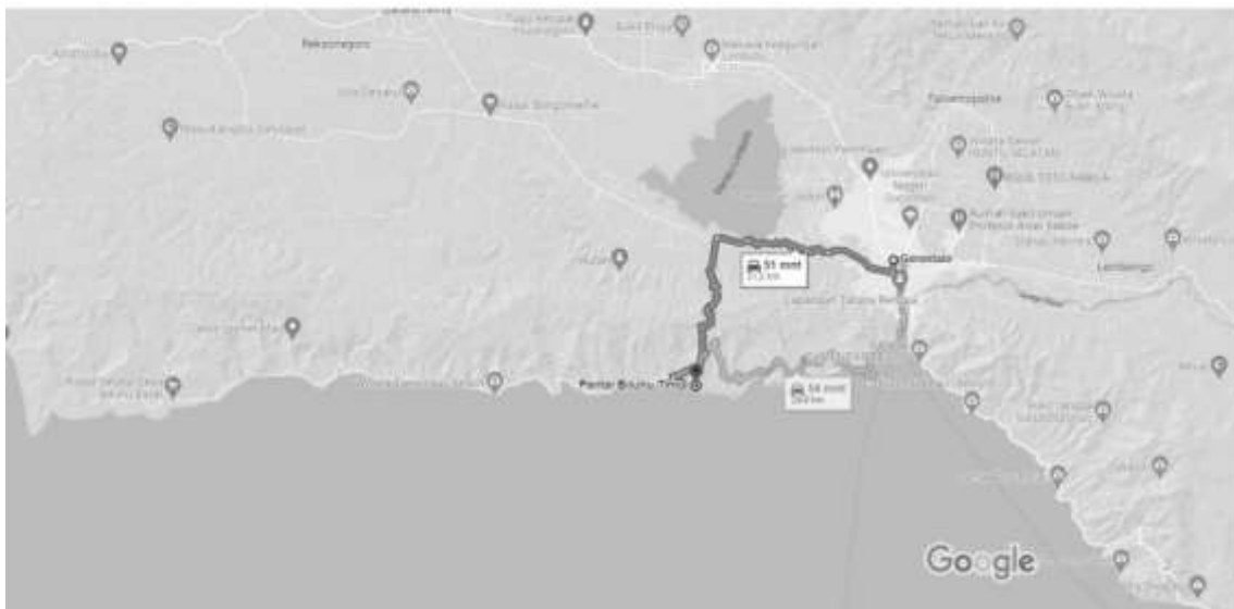
Gambar Peta Jarak Pantai Biluhu Timur ke Kota Gorontalo

Pantai Biluhu berada di Desa Biluhu Timur, Kecamatan Batuda'a Pantai, Kabupaten Gorontalo, Provinsi Gorontalo, Indonesia. Pantai ini tidak terlalu jauh jaraknya dari pusat kota Gorontalo hanya berjarak kurang lebih 24-an kilometer. Untuk bisa sampai ke tempat ini, dari pusat Kota Gorontalo bisa ditempuh menggunakan kendaraan motor atau mobil melalui dua arah yakni melalui daerah Batuda'a atau melalui jalur tepian pantai, dengan waktu tempuh sekitar 50 - 60 menit. Namun demikian, pantai ini letaknya agak terpencil dan seperti tersembunyi, karena untuk bisa sampai menuju Pantai Biluhu kita harus melalui perjalanan melewati bukit hingga menurunnya sampai ke lembah bukit, akan tetapi kita akan melalui pemandangan indah dan menakjubkan. Pantai ini merupakan salah satu pantai terindah yang ada di Provinsi Gorontalo dan merupakan pantai yang menjadi salah satu pendukung kemajuan Provinsi Gorontalo di sektor pariwisata. Karena itu, keberadaan pantai ini juga selayaknya dapat memajukan perekonomian masyarakat di desa Biluhu.