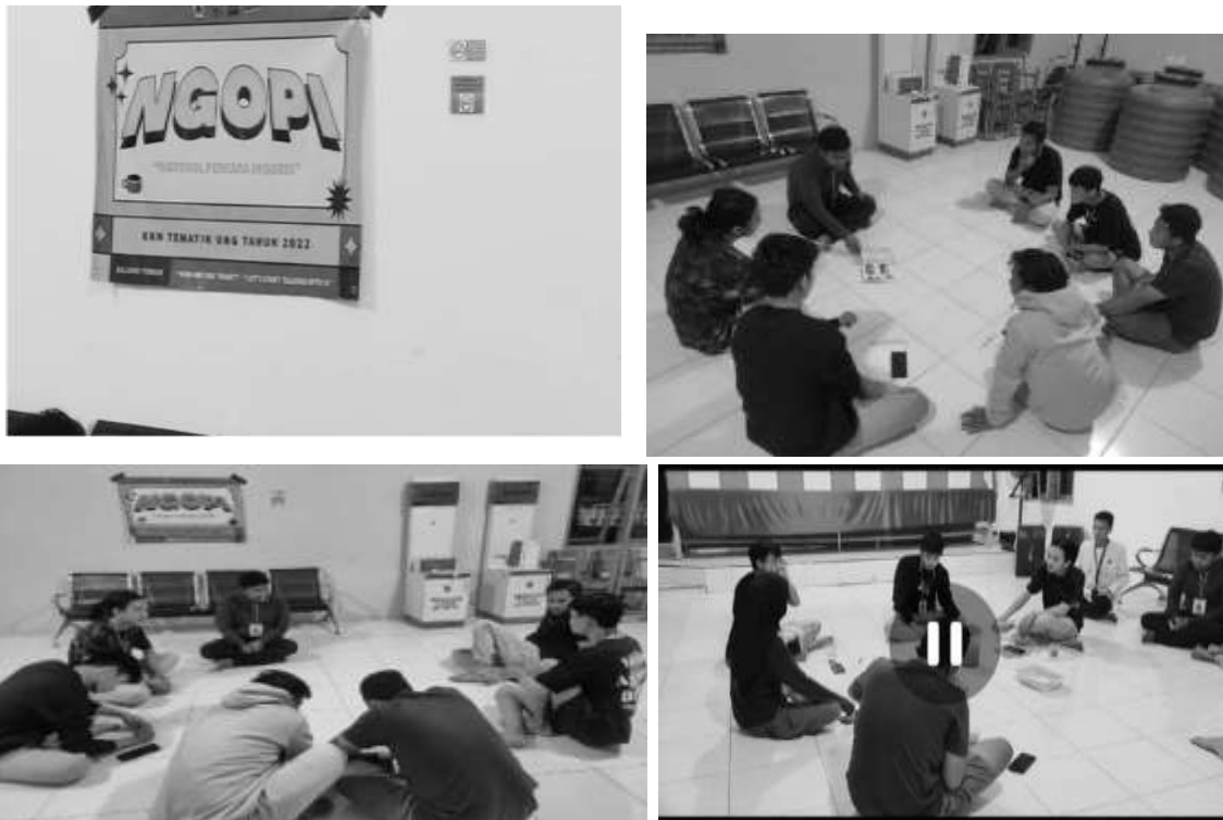
Gambar NGOPI (Ngobrol Perkara Inggris)

b. Pembekalan Bahasa Inggris dengan Rema Muda atau Karang Taruna Desa Biluhu Timur yang diberi tema NGOPI (Ngobrol Perkara Inggris) . Pembekalan Bahasa Inggris bagi Karang Taruna ini tidak dilakukan secara formal seperti pada siswa SD dan SMP, tetapi dilakukan dengan cara memberi informasi kata-kata dan percakapan Bahasa Inggris sederhana dengan ngobrol santai sambil minum kopi, tetapi kata-kata Bahasa Inggris dapat diserap oleh para remaja. Metode ini disukai oleh para remaja di desa Biluhu Timur. Pada kesempatan ini juga, mahasiswa juga berbicara mengenai kebersihan desa yang menjadi desa wisata. Langkah-langkah apa yang sebaiknya dilakukan.