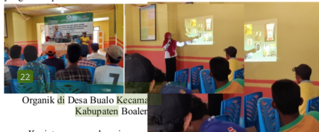
Organik di Desa Bualo Kecamatan Kabupaten Boalemo

Setelah mendapat jawaban dari pemateri dan Tim PPDM, maka optimisme peserta terhadap keberlanjutan kegiatan ini semakin nampak karena selain mudah membuatnya, sarana dan prasarana pembuatan pupuk tersedia, juga ketersediaan bahan baku pupuk organik yang melimpah di Desa Bualo saat ini.