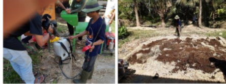
Gambar 7. Ketrampilan Peserta dalam Formulasi dan Pencampuradukan Bahan Baku Pupuk Organik

ketrampilan mencampur larutan EM4+molase+air sesuai dosis anjuran. Selain itu, ketrampilan dalam mencampuradukan semua bahan baku pupuk organik juga meningkat pula (Gambar 7).