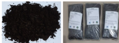
Gambar 8. Pupuk Organik yang Sudah Jadi dan Pengemasannya.

Kemampuan peserta dalam menilai keberhasilan pupuk organik yang dibuat juga sudah meningkat. Hal ini ditunjukkan oleh ketrampilan peserta dalam menentukan pupuk organik yang dibuat sudah berhasil atau tidak berdasarkan kriteria bau pupuk organik dan warna pupuk organik yang dibuat (Gambar 8).