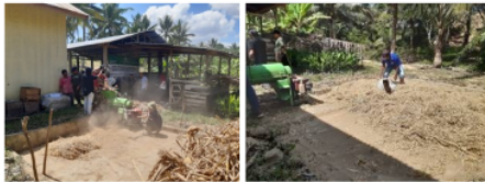
Gambar 6. Ketrampilan Peserta dalam Pencacahan Bahan Baku Pupuk Organik

Secara umum, peserta telah mampu mengoperasikan mesin pencacah yang menghasilkan cacahan limbah pertanian yang cukup halus. Bahkan, 25% para mandiri peserta dapat melakukan pencacahan yang baik dengan tingkat keamanan dan keselamatan yang cukup baik. Hasilnya ditunjukkan pada Gambar 6.