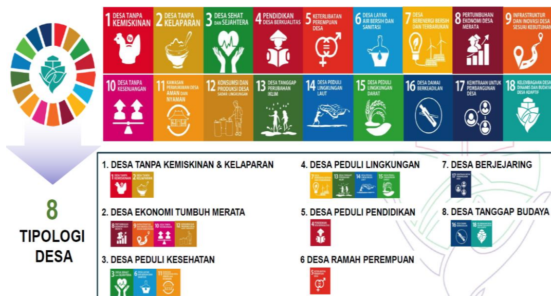
Gambar 1. Delapan Topologi Desa dalam Pencapaian SDGs (Sustainable Development Goals)