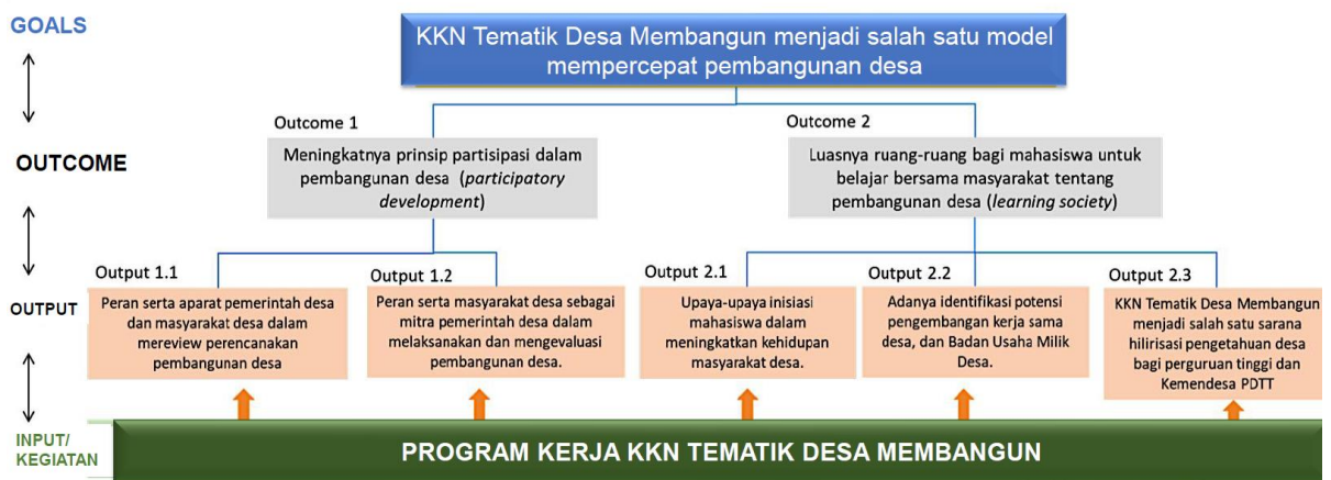
Gambar 3. Bagan Capaian Hasil KKNT Desa Membangun