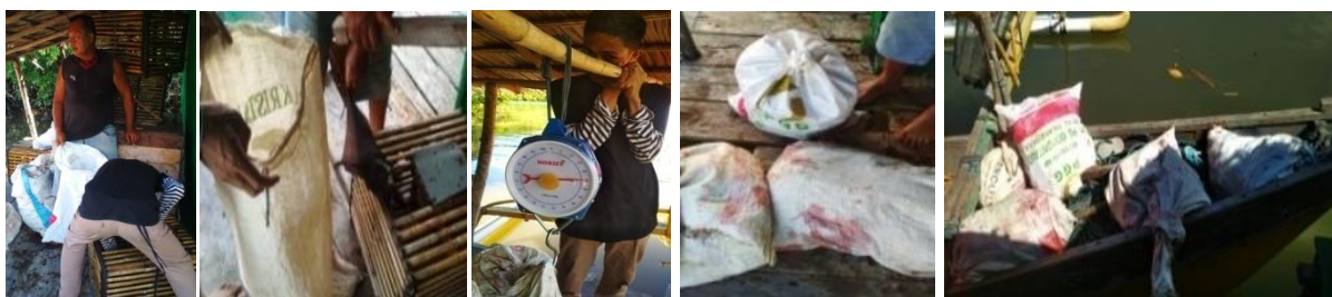
a b c d

Menurut Lasaharu & Boekoesoe 2(020), Pemasaran ternak atau hewan biasanya melalui pemesanan atau dijemput langsung oleh pedagang ditempat produsen atau peternak yang ingin menjual ternaknya.