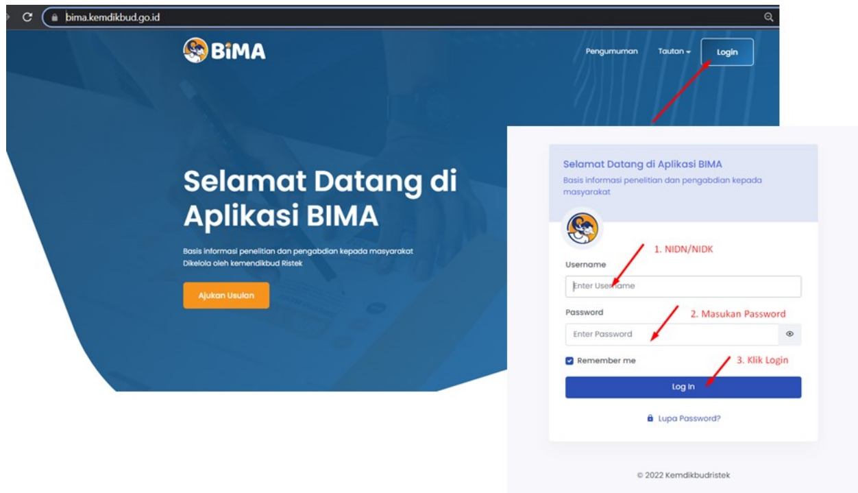
Gambar 1. Beranda akses memasuki aplikasi BIMA

Penerima pendanaan penelitian dan pengabdian kepada masyarakat di Perguruan Tinggi Akademik Tahun Anggaran 2022, wajib melakukan revisi proposal, rencana anggaran biaya (RAB), dan mengunggah surat pernyataan kesanggupan pelaksanaan melalui aplikasi BIMA pada laman http://bima.kemdikbud.go.id/ dengan menggunakan akun ketua pengusul masing-masing, sebagaimana diperlihatkan pada Gambar 1.