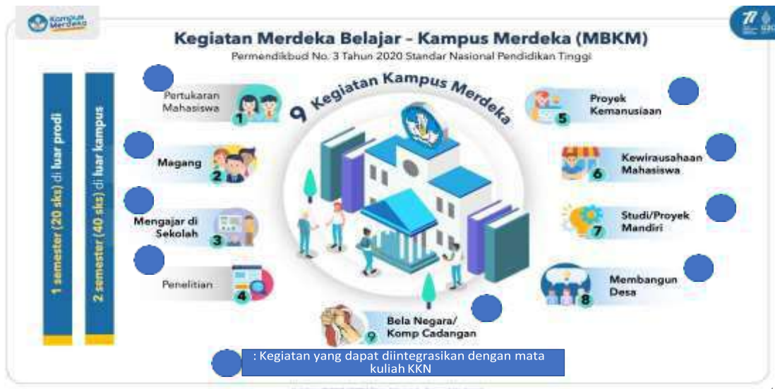
Gambar 3. Kegiatan MBKM terintegrasi KKN