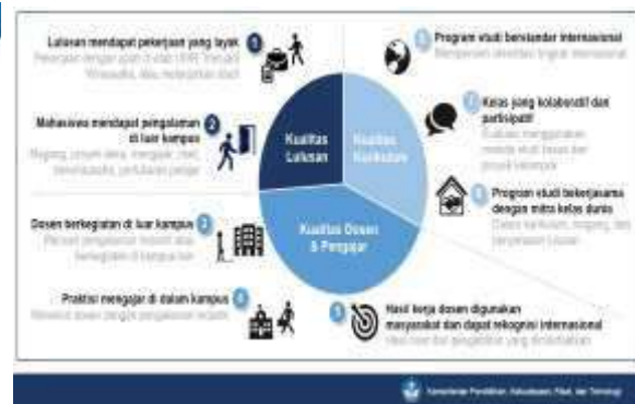
Gambar 2. Indikator Kinerja Utama