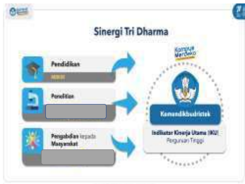
Gambar 1. Sinergi Tri Dharma

Kegiatan Tri Dharma yang dilakukan pada program studi diarahkan untuk mendukung ketercapaian indikator kinerja utama (IKU) Perguruan Tinggi (Gambar 1 dan 2) dan memfasilitasi kegiatan merdeka belajar kampus merdeka (MBKM) (Gambar 3). Setiap program studi dapat berinovasi untuk mengintegrasikan kegiatan MBKM dengan mata kuliah Kuliah kerja nyata (KKN), yang juga merupakan salah satu mata kuliah wajib pada struktur kurikulum program studi. Penetapan mata kuliah yang akan dikonversikan mengacu pada Pedoman Kurikulum Universitas Negeri Gorontalo.