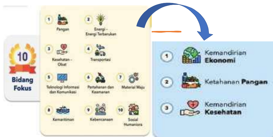
Gambar 5. Bidang Fokus RIRN dan tema MBKM terintegrasi KKN