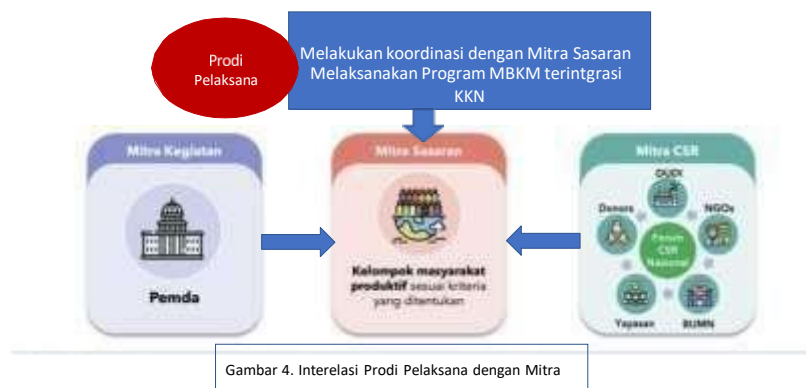
Gambar 4. Interelasi Prodi Pelaksana dengan Mitra

Pelaksanaan Program kegiatan Merdeka Belajar Kampus Merdeka terintegrasi KKN dan KKN Tematik tahun 2024 akan diprioritaskan di wilayah Teluk Tomini . Hal ini sejalan dengan prioritas pembangunan masyarakat di wilayah 3T (Perpres No 63 tahun 2020) dan kategori wilayah miskin (BPS, 2021). Provinsi Gorontalo termasuk dalam urutan ke 6 dari 10 daerah dengan jumlah penduduk miskin terbanyak pada September 2021 (BPS, Januari 2022), dengan jumlah penduduk miskin sebesar 15,41 persen dan Sulawesi Tengah di urutan ke 10 dengan presentasi penduduk miskin sebesar 12,18 persen. Sebaran wilayah penduduk miskin ternyata berada dalam wilayah Teluk Tomini. Maksimal pelaksanaan program ini dilakukan dalam waktu sekitar 4 bulan, dan terdapat Interelasi antara Program studi Pelaksana dan mitra sasaran dan mitra CSR sebagaimana disajikan pada Gambar 4.