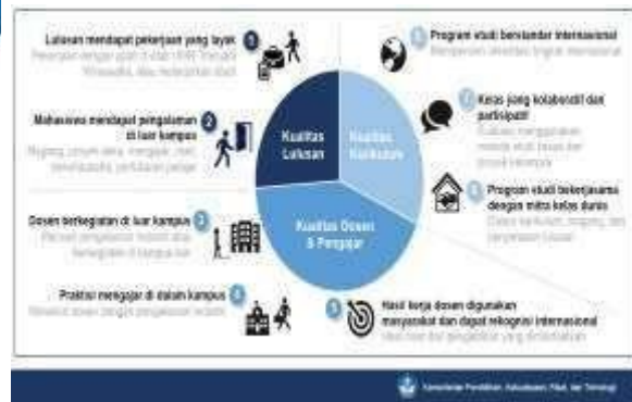
Gambar 2. Indikator Kinerja Utama