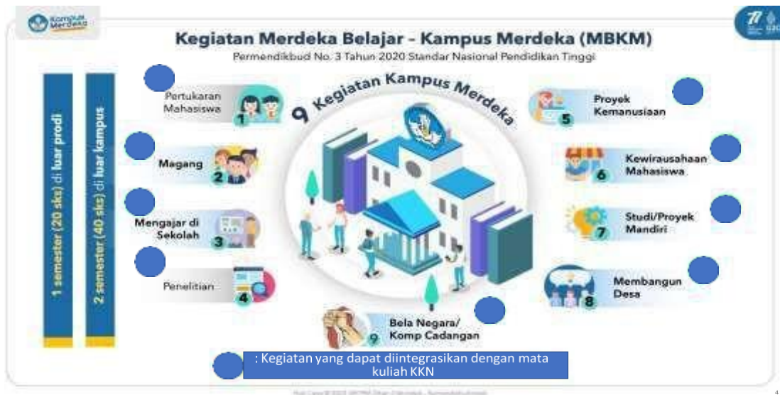
Gambar 3. Kegiatan MBKM terintegrasi KKN