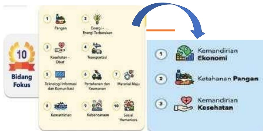
Gambar 5. Bidang Fokus RIRN dan tema MBKM terintegrasi KKN