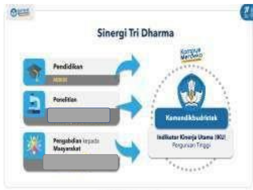
Gambar 1. Sinergi Tri Dharma

Kegiatan Tri Dharma yang dilakukan pada program studi diarahkan untuk mendukung ketercapaian indikator kinerja utama (IKU) Perguruan Tinggi (Gambar 1 dan 2) dan memfasilitasi kegiatan merdeka belajar kampus merdeka (MBKM) (Gambar 3). Setiap program studi dapat berinovasi untuk mengintegrasikan kegiatan MBKM dengan mata kuliah Kuliah kerja nyata (KKN), yang juga merupakan salah satu mata kuliah wajib pada struktur kurikulum program studi. Penetapan mata kuliah yang akan dikonversikan mengacu pada Pedoman Kurikulum Universitas Negeri Gorontalo.