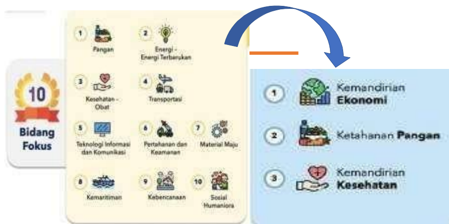
Gambar 3. Bidang Fokus RIRN dan tema Kuliah Kerja Nyata (KKN) Tematik