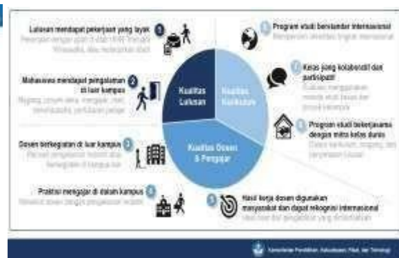
Gambar 2. Indikator Kinerja Utama

Pelaksanaan Program kegiatan Kuliah Kerja Nyata (KKN) Tematik tahun 2024 akan diprioritaskan di wilayah Teluk Tomini . Hal ini sejalan dengan prioritas pembangunan masyarakat di wilayah 3T (Perpres No 63 tahun 2020) dan kategori wilayah miskin (BPS, 2021). Provinsi Gorontalo termasuk dalam urutan ke 6 dari 10 daerah dengan jumlah penduduk miskin terbanyak pada September 2021 (BPS, Januari 2022), dengan jumlah penduduk miskin sebesar 15,41 persen dan Sulawesi Tengah di urutan ke 10 dengan presentasi penduduk miskin sebesar 12,18 persen. Sebaran wilayah penduduk miskin ternyata berada dalam wilayah Teluk Tomini. Maksimal pelaksanaan program ini dilakukan dalam waktu sekitar 45 Hari.