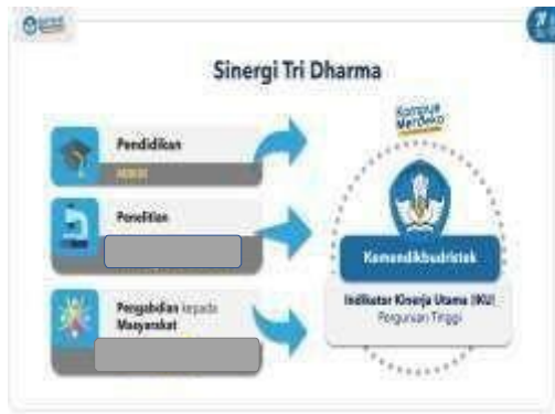
Gambar 1. Sinergi Tri Dharma

Kegiatan Tri Dharma yang dilakukan pada program studi diarahkan untuk mendukung ketercapaian indikator kinerja utama (IKU) Perguruan Tinggi (Gambar 1 dan 2). Setiap program studi dapat berinovasi untuk mengintegrasikan kegiatan KKN pada mata kuliah Kuliah kerja nyata (KKN), yang juga merupakan salah satu mata kuliah wajib pada struktur kurikulum program studi. Penetapan mata kuliah yang akan dikonversikan mengacu pada Pedoman Kurikulum Universitas Negeri Gorontalo.