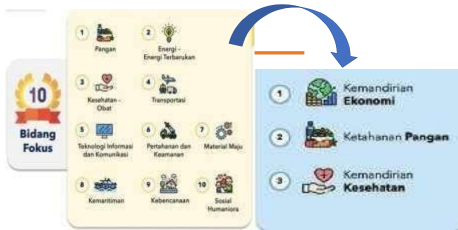
Gambar 5. Bidang Fokus RIRN dan tema MBKM terintegrasi KKN