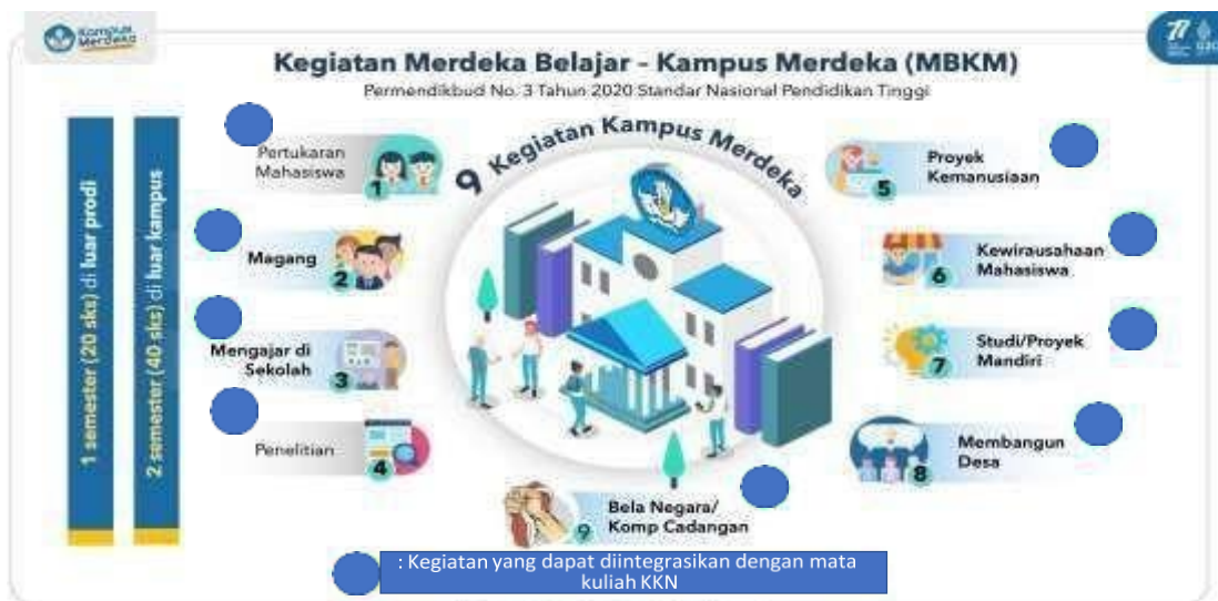
Gambar 3. Kegiatan MBKM terintegrasi KKN