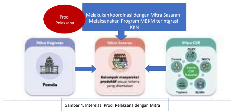
Gambar 4. Interelasi Prodi Pelaksana dengan Mitra

Pelaksanaan Program kegiatan Merdeka Belajar Kampus Merdeka terintegrasi KKN tahun 2024 akan diprioritaskan di wilayah Teluk Tomini . Hal ini sejalan dengan prioritas pembangunan masyarakat di wilayah 3T (Perpres No 63 tahun 2020) dan kategori wilayah miskin (BPS, 2021). Provinsi Gorontalo termasuk dalam urutan ke 6 dari 10 daerah dengan jumlah penduduk miskin terbanyak pada September 2021 (BPS, Januari 2022), dengan jumlah penduduk miskin sebesar 15,41 persen dan Sulawesi Tengah di urutan ke 10 dengan presentasi penduduk miskin sebesar 12,18 persen. Sebaran wilayah penduduk miskin ternyata berada dalam wilayah Teluk Tomini. Maksimal pelaksanaan program ini dilakukan dalam waktu sekitar 4 bulan, dan terdapat Interelasi antara Program studi Pelaksana dan mitra sasaran dan mitra CSR sebagaimana disajikan pada Gambar 4.