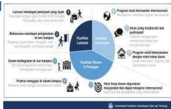
Gambar 2. Indikator Kinerja Utama