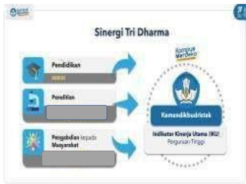
Gambar 1. Sinergi Tri Dharma

Kegiatan Tri Dharma yang dilakukan pada program studi diarahkan untuk mendukung ketercapaian indikator kinerja utama (IKU) Perguruan Tinggi (Gambar 1 dan 2) dan memfasilitasi kegiatan merdeka belajar kampus merdeka (MBKM) (Gambar 3). Setiap program studi dapat berinovasi untuk mengintegrasikan kegiatan MBKM dengan mata kuliah Kuliah kerja nyata (KKN), yang juga merupakan salah satu mata kuliah wajib pada struktur kurikulum program studi. Penetapan mata kuliah yang akan dikonversikan mengacu pada Pedoman Kurikulum Universitas Negeri Gorontalo.