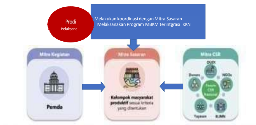
Gambar 5. Interelasi Prodi dengan Pelaksana Mitra

Pelaksanaan Program kegiatan MBKM terintegrasi KKN dan KKN Tematik akan diprioritaskan di wilayah Teluk Tomini . Hal ini sejalan dengan prioritas pembangunan masyarakat di wilayah 3T (Perpres No 63 tahun 2020) dan kategori wilayah miskin (BPS, 2024). Provinsi Gorontalo termasuk dalam 10 daerah dengan jumlah penduduk miskin terbanyak pada Maret 2024 (BPS 2024), dengan jumlah penduduk miskin sebesar 14,57 persen. Sebaran wilayah penduduk miskin ternyata berada dalam wilayah Teluk Tomini. Maksimal pelaksanaan program MBKM Terintegrasi KKN dilakukan sekitar 4 bulan dan KKN Tematik sekitar 1,5 bulan, dan terdapat Interelasi antara Program studi Pelaksana dan mitra sasaran dan mitra CSR sebagaimana disajikan pada Gambar 5.