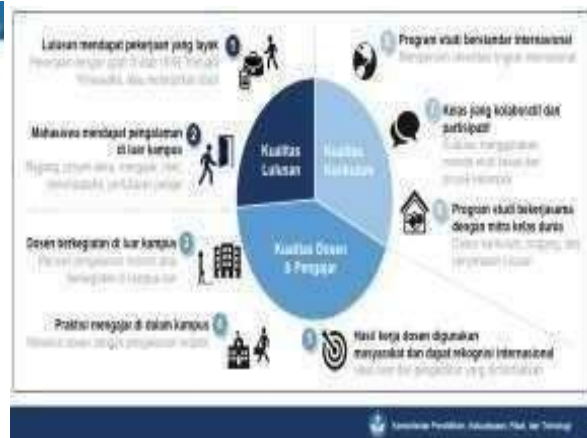
Gambar 3. Indikator Kinerja Utama