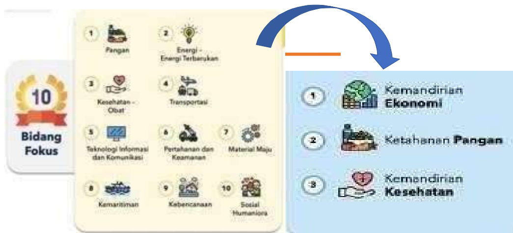
Gambar 6. Bidang Fokus RIRN MBKM terintegrasi KKN