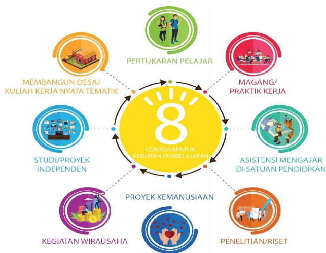
Gambar 1. Bentuk Kegiatan Pembelajaran Program MBKM

Proses pembelajaran dalam Kampus Merdeka merupakan salah satu perwujudan pembelajaran yang berpusat pada mahasiswa (student centered learning) yang sangat esensial. Pembelajaran dalam Kampus Merdeka memberikan tantangan dan kesempatan untuk pengembangan inovasi, kreativitas, kapasitas, kepribadian, dan kebutuhan mahasiswa, serta mengembangkan kemandirian dalam mencari dan menemukan pengetahuan melalui kenyataan dan dinamika lapangan seperti persyaratan kemampuan, permasalahan riil, interaksi sosial, kolaborasi, manajemen diri, tuntutan kinerja, target dan pencapaiannya. Melalui program merdeka belajar yang dirancang dan diimplementasikan dengan baik, maka hard skills dan soft skills mahasiswa akan terbentuk dengan kuat.