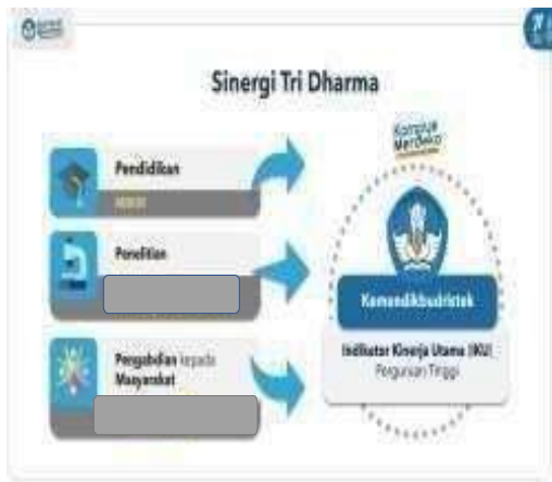
Gambar 2. Sinergi Tri Dharma

Kegiatan pengabdian kepada masyarakat merupakan bagian tugas Tri Dharma yang harus dilaksanakan oleh setiap dosen di perguruan tinggi (PT). Pengabdian kepada masyarakat dilaksanakan di luar kampus dengan melibatkan pihak lain, baik pihak di dalam kampus maupun di luar kampus. Program pemberdayaan masyarakat di perguruan tinggi ini diarahkan untuk memberikan solusi terhadap permasalahan yang ada di masyarakat berdasarkan analisis situasi. Kegiatan Tri Dharma yang dilakukan pada program studi diarahkan untuk mendukung ketercapaian indikator kinerja utama (IKU) Perguruan Tinggi (Gambar 2 dan 3) dan memfasilitasi kegiatan merdeka belajar kampus merdeka (MBKM) (Gambar 4). Setiap program studi dapat berinovasi untuk mengintegrasikan kegiatan MBKM dengan mata kuliah Kuliah kerja nyata (KKN), yang juga merupakan salah satu mata kuliah wajib pada struktur kurikulum program studi. Penetapan mata kuliah yang akan dikonversikan mengacu pada Pedoman Kurikulum Universitas Negeri Gorontalo (UNG).