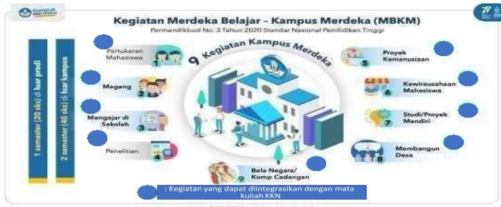
Gambar 4. Kegiatan MBKM Terintegrasi KKN