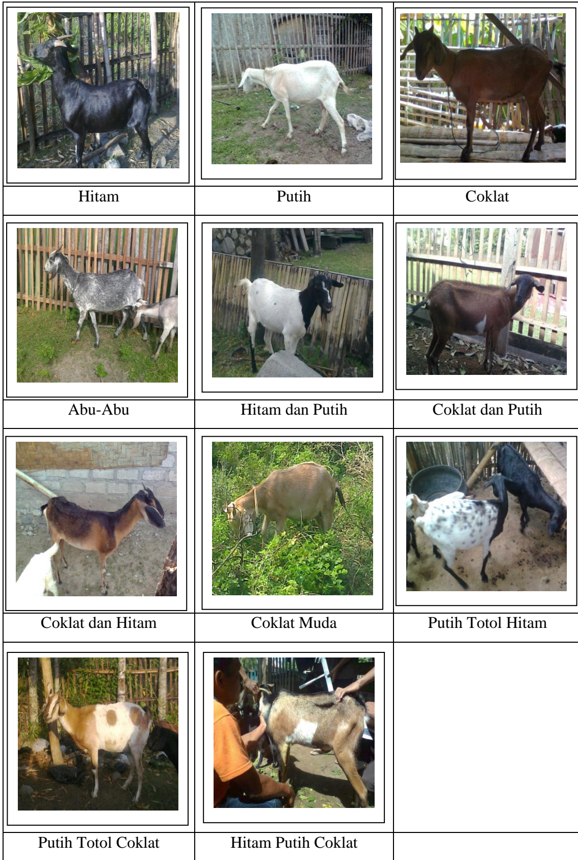
Gambar 2 Pola Warna Tubuh Kambing Lokal Bone Bolango